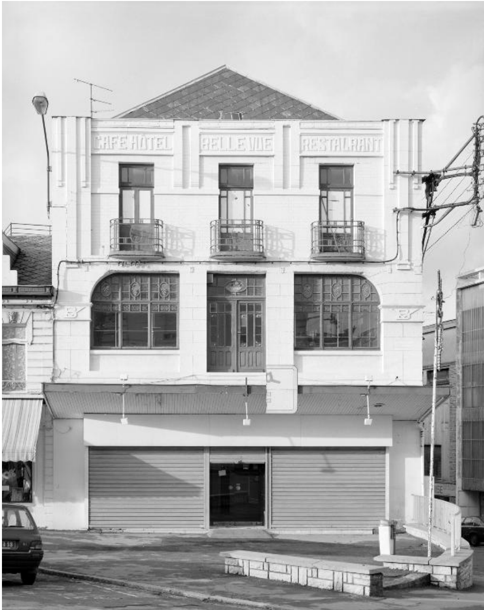
Vue générale de l'élévation sur la place.