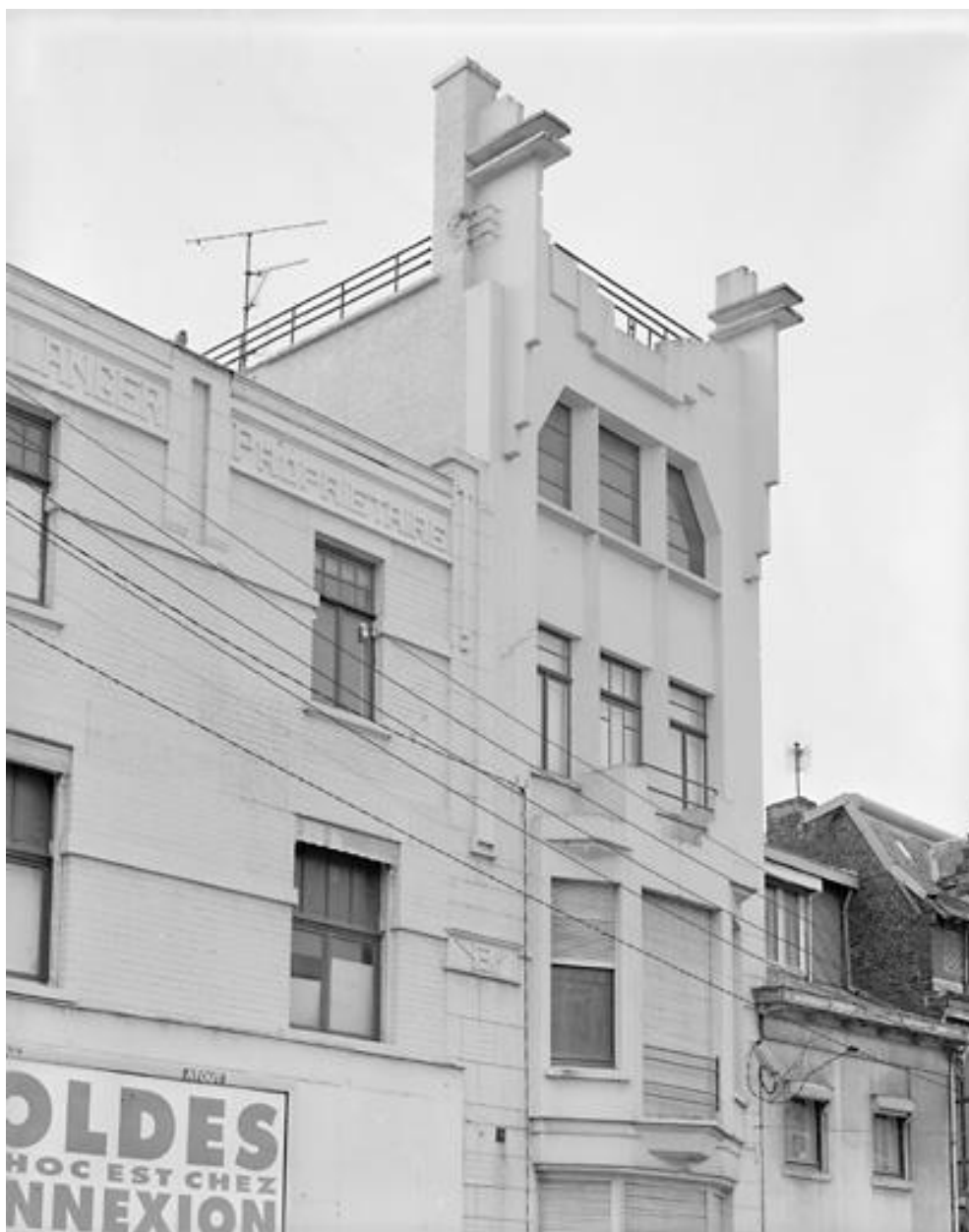
Élévation sur rue, détail de la façade.