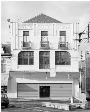
Vue générale de l'élévation sur la place. IVR31_19935900213V