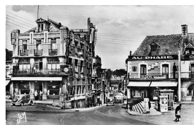
Vue de l'hôtel et perspective de la rue Marcel-Aimé. Carte postale, vers 1950.