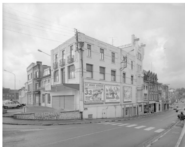
Vue de trois quarts. IVR31_19925901608V