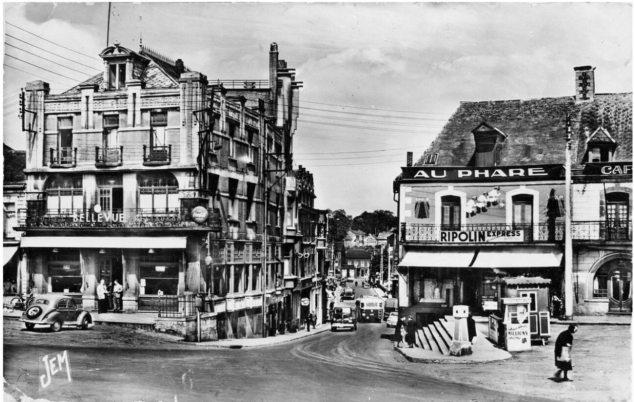
Vue de l'hôtel et perspective de la rue Marcel-Aimé. Carte postale, vers 1950.