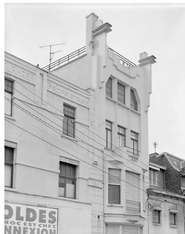
Élévation sur rue, détail de la façade. IVR31_19935900214V