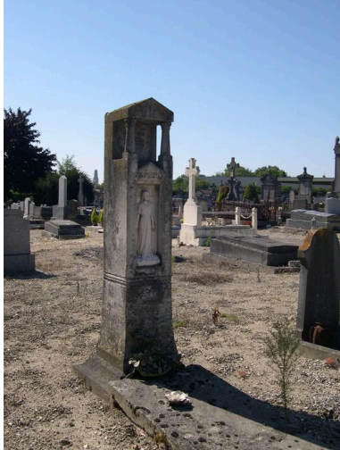
Vue générale. IVR22_20038010848NUCA