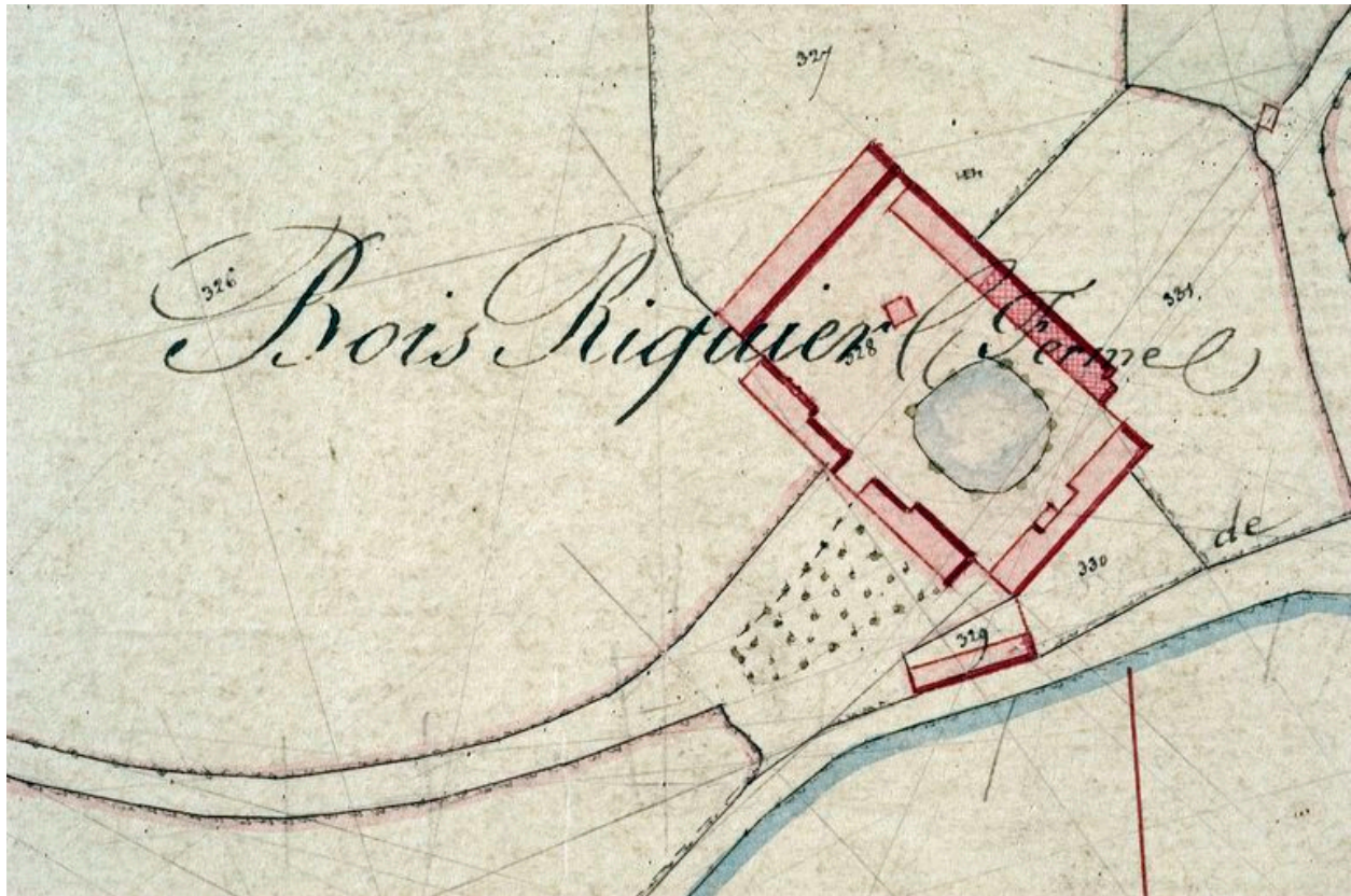
Extrait du cadastre napoléonien, 1834 (AD Somme ; 3P 1772/3).