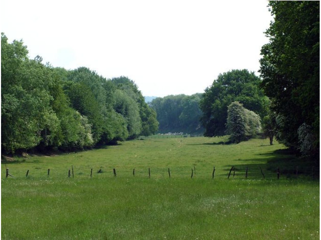
Vue, vers le sud, du vallon du Fond du Bois-Riquier (Ville-le-Marclet).