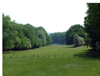
Vue, vers le sud, du vallon du Fond du Bois-Riquier (Ville-le-Marcelet).

IVR22_20088015415NUCA