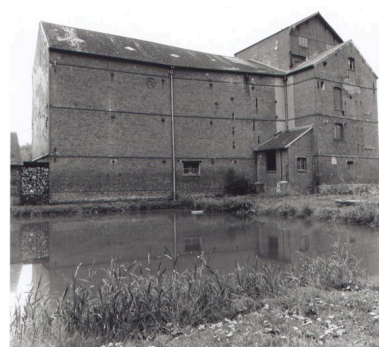
Vue d'ensemble de la minoterie. IVR22_20026000992X