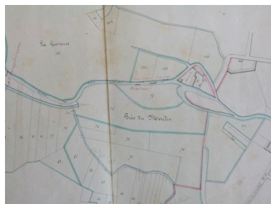
Plan général de Milly-sur-Thérain, détail du moulin de Milly, 25 septembre 1855. IVR22_20036000470NUCAB