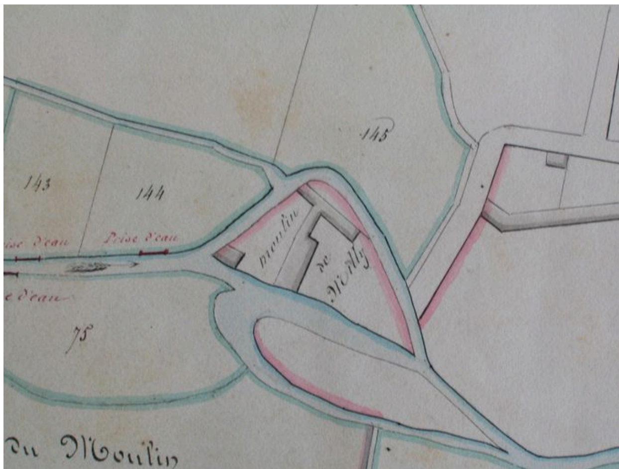
Plan du moulin de Milly, 25 septembre 1855.