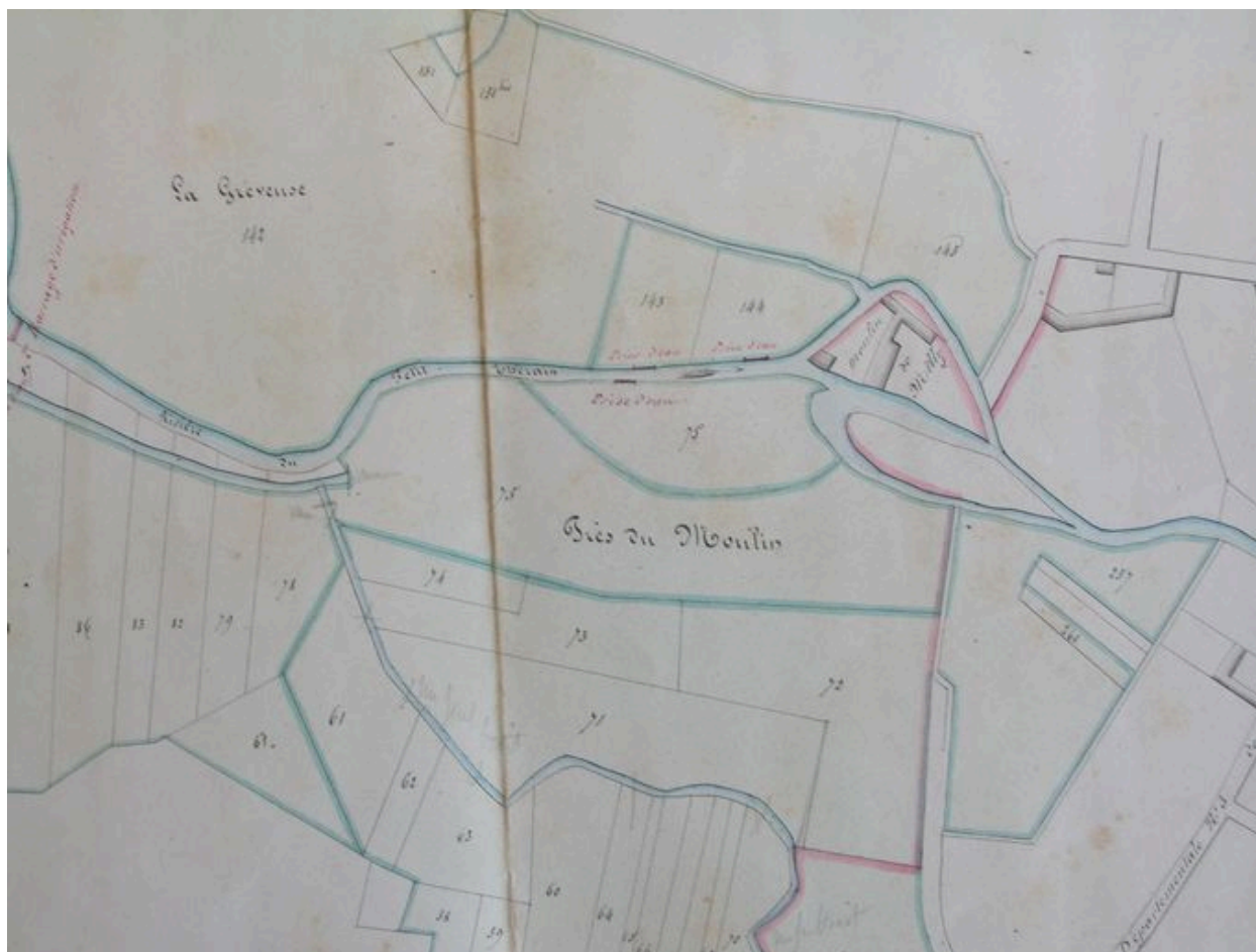
Plan général de Milly-sur-Thérain, détail du moulin de Milly, 25 septembre 1855.