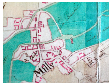
Plan du moulin de Milly, extrait du plan d'intendance de la commune, 21 septembre 1784.