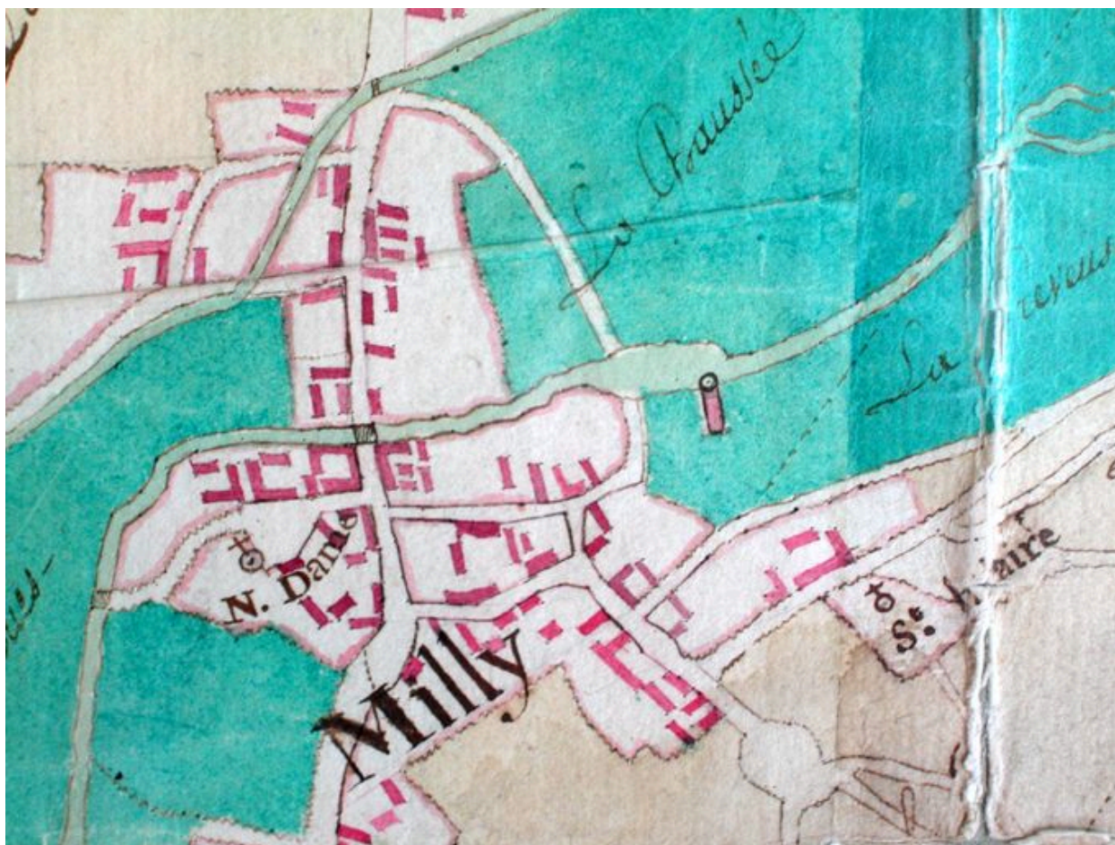
Plan du moulin de Milly, extrait du plan d'intendance de la commune, 21 septembre 1784.