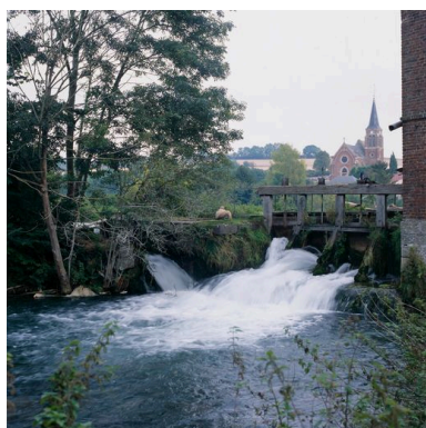
Le vannage de décharge.