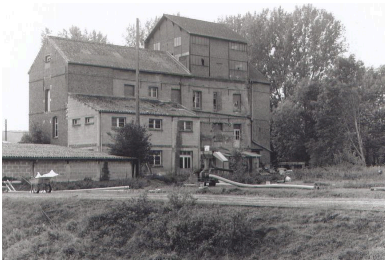
Ensemble postérieur de la minoterie.