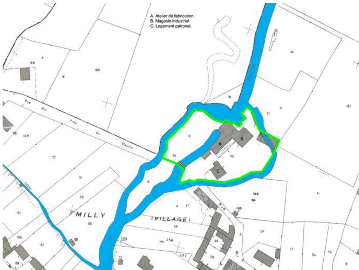
Plan masse, extrait du plan cadastral communal de Milly-sur-Thérain, section AD, 2002.