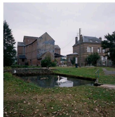
Vue générale de la minoterie et de son logement patronal. IVR22_20026001057XA