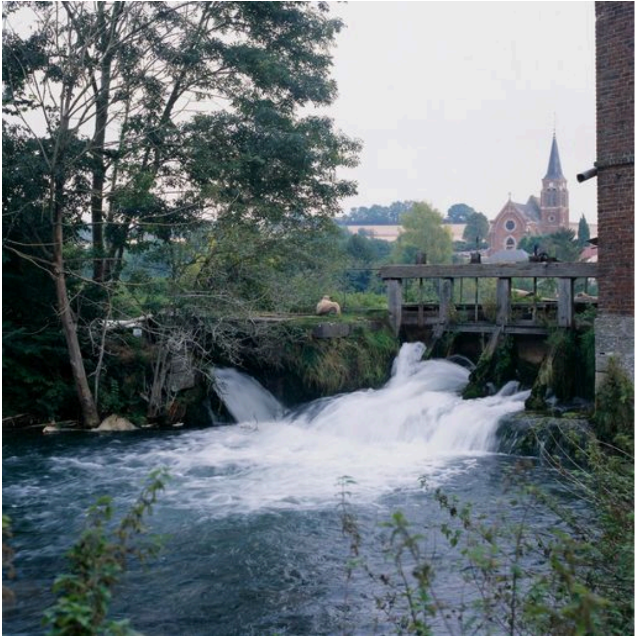
Le vannage de décharge.