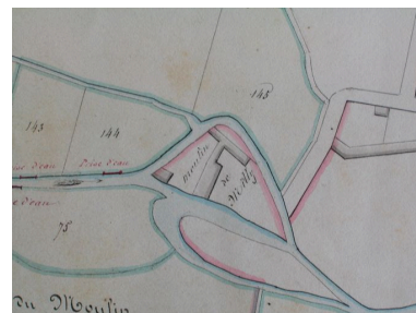
Plan du moulin de Milly, 25 septembre 1855. IVR22_20036000471NUCAB