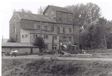
Ensemble postérieur de la minoterie. IVR22_20026000996X