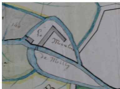
Plan masse du moulin de Milly, 2e quart 19e siècle (reproduction) IVR22_20036000472NUCAB