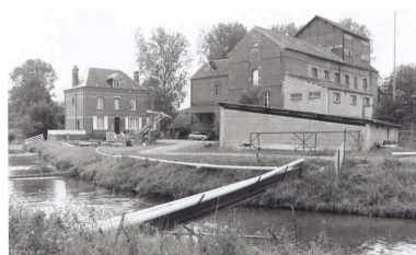
Vue générale de la minoterie. IVR22_20026000995X