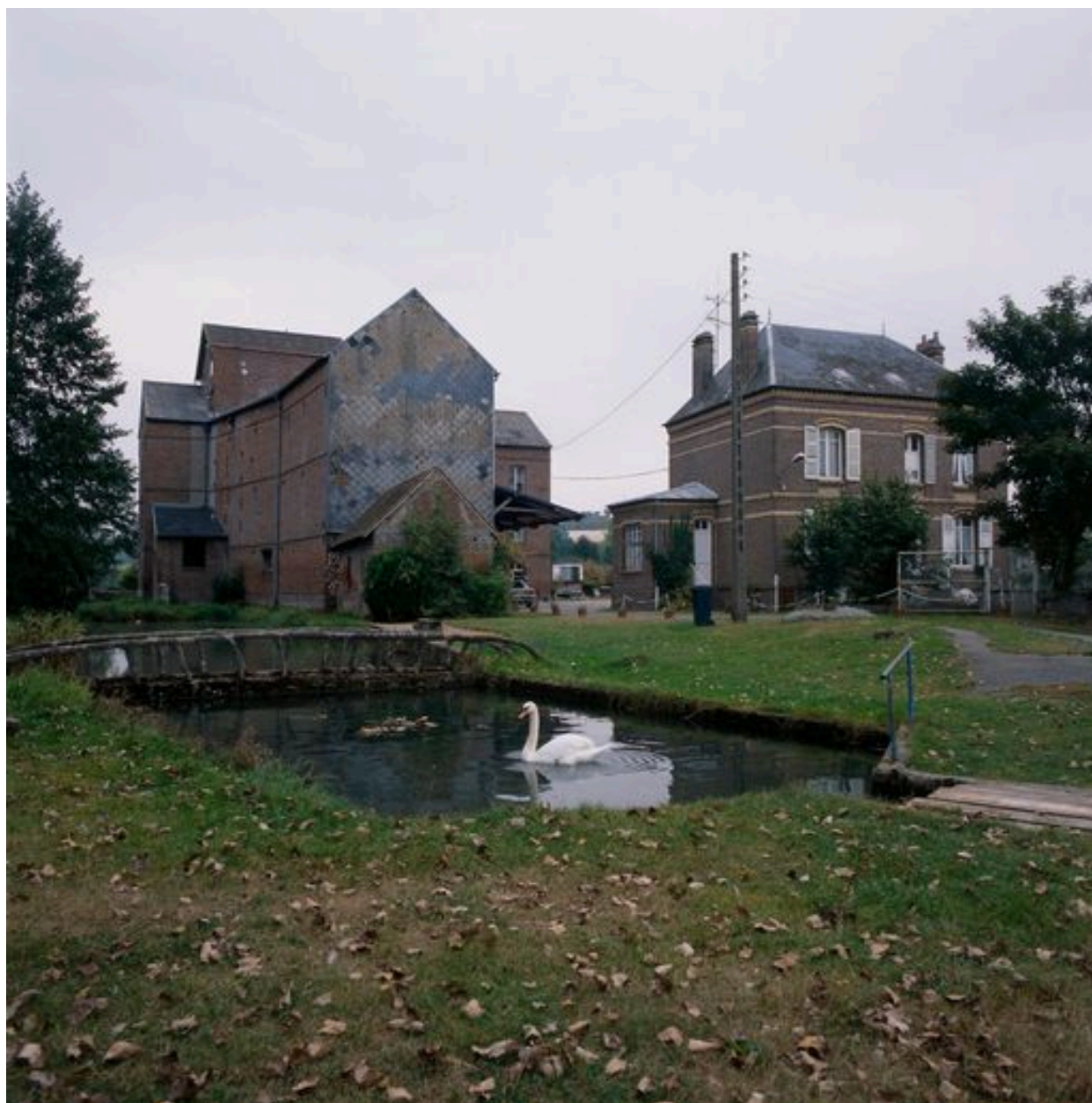
Vue générale de la minoterie et de son logement patronal.