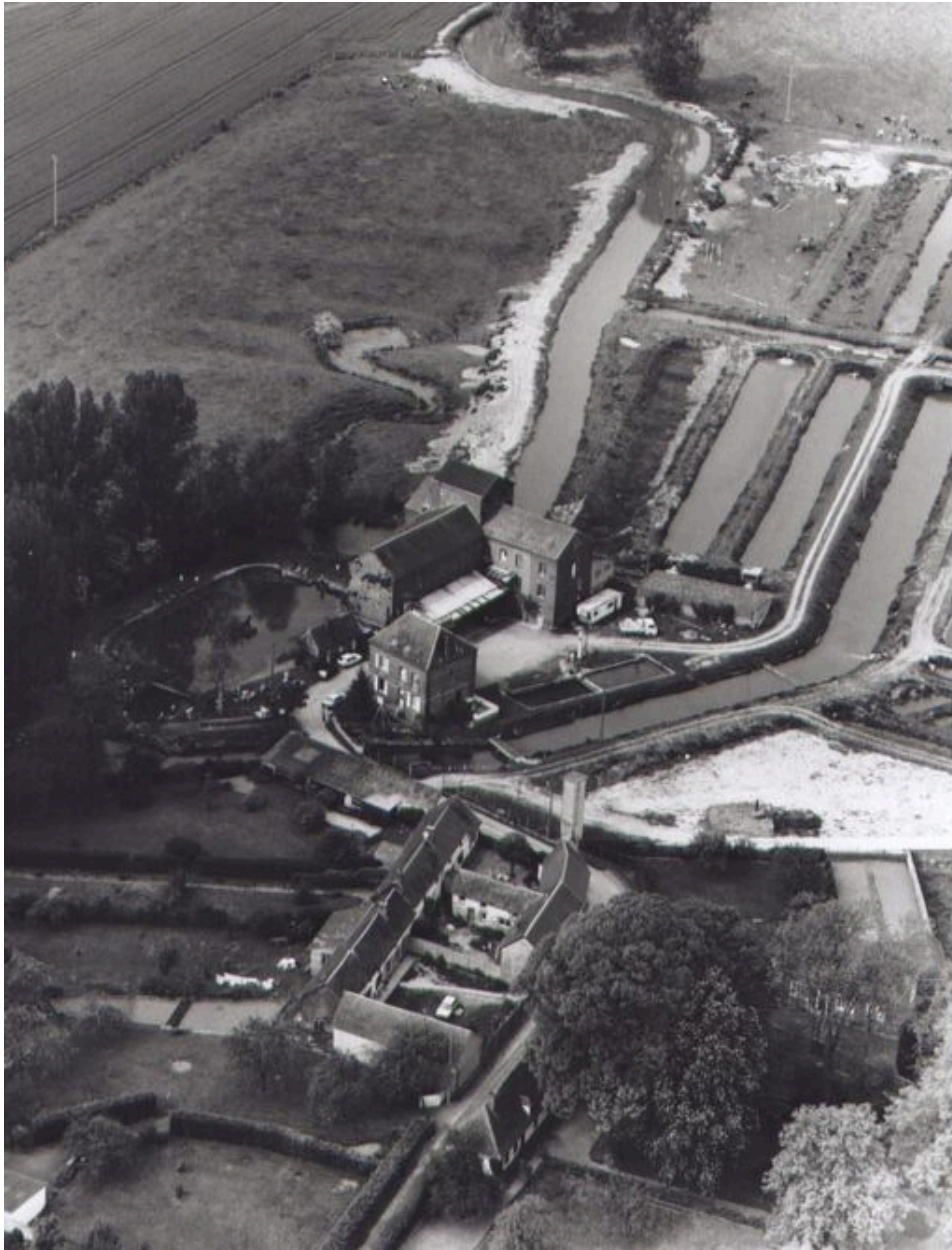
Vue aérienne de l'usine en 1994.