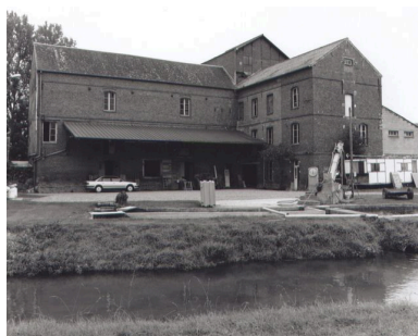
Ensemble sur cour de la minoterie.