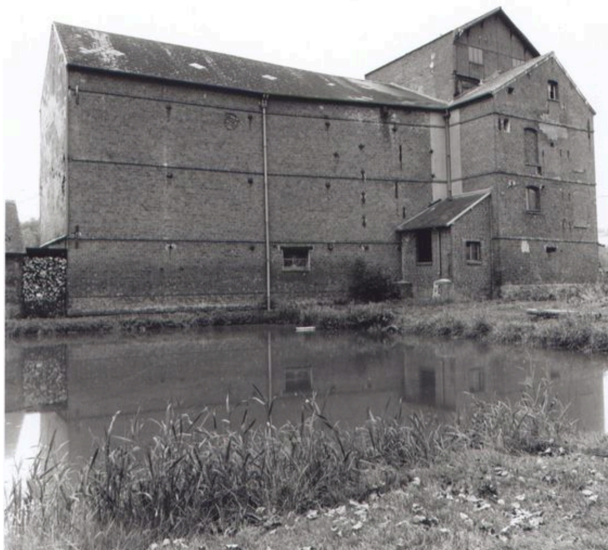
Vue d'ensemble de la minoterie.