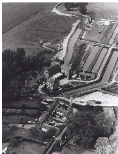
Vue aérienne de l'usine en 1994.