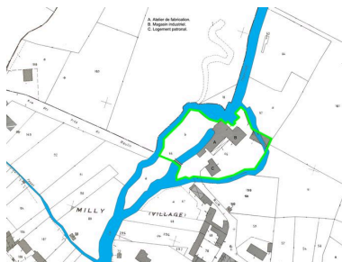
Plan masse, extrait du plan cadastral communal de Milly-sur-Thérain, section AD, 2002. IVR22_20036000565NUCAB