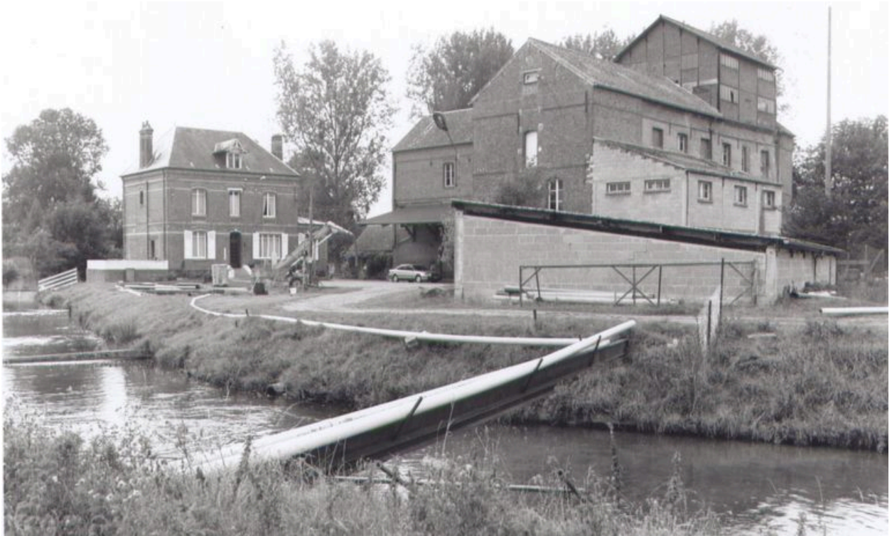
Vue générale de la minoterie.