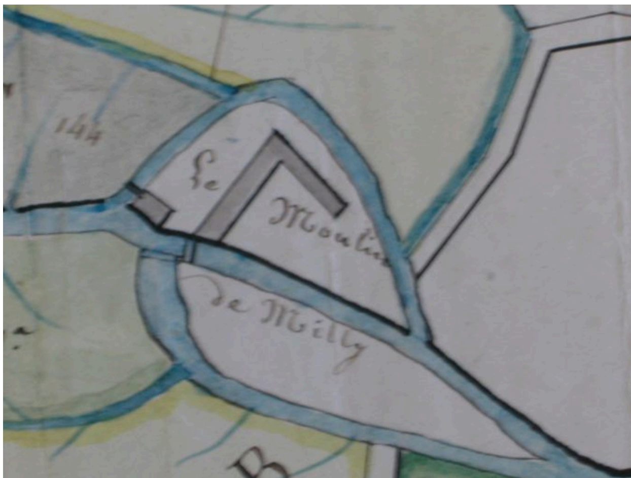
Plan masse du moulin de Milly, 2e quart 19e siècle