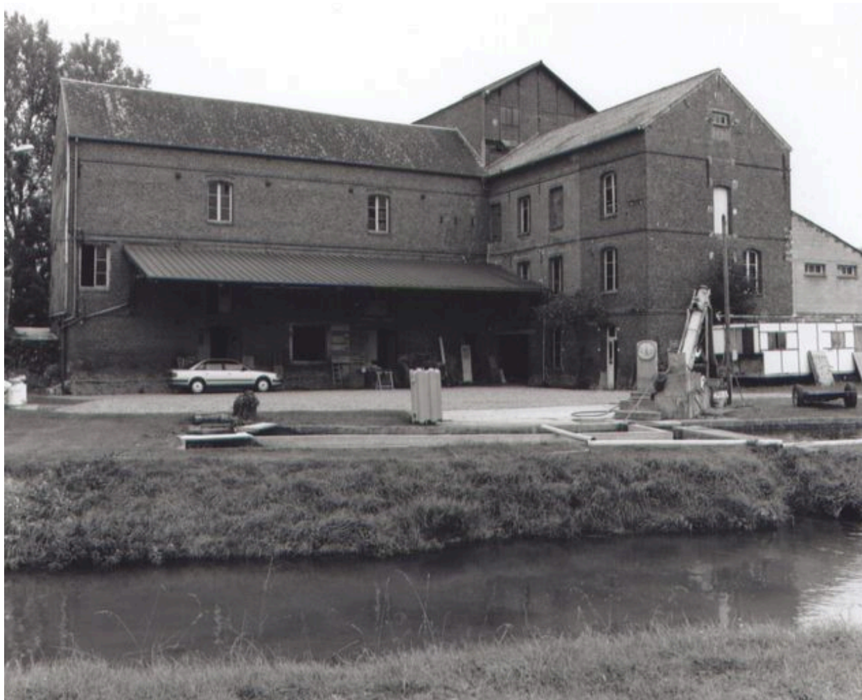
Ensemble sur cour de la minoterie.