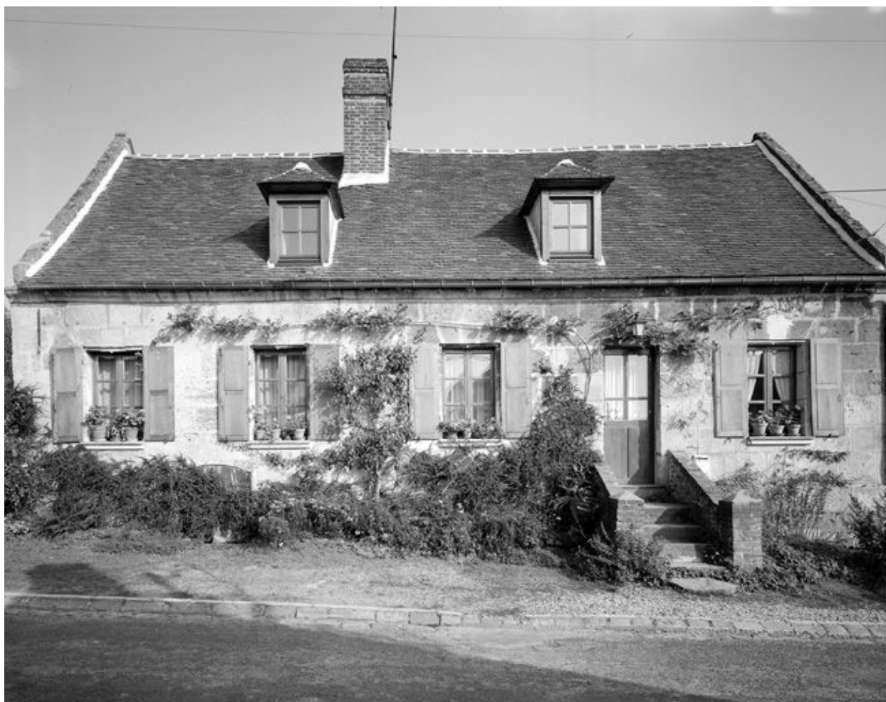
Logis. Vue générale.