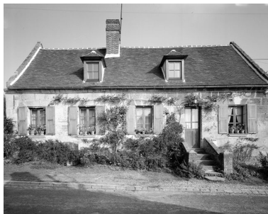
Logis. Vue générale. IVR22_19846001226V

Plan de situation. Extrait du plan cadastral de 1975, section D2 530 et 531.