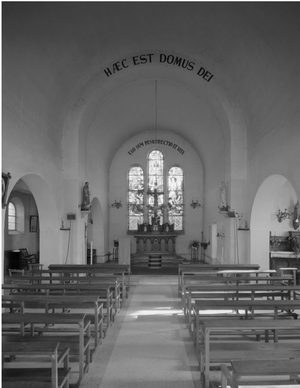
Vue intérieure vers le chœur.