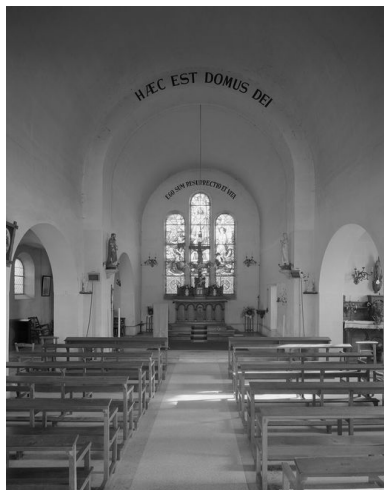
Vue intérieure vers le chœur. IVR22_19846001312V