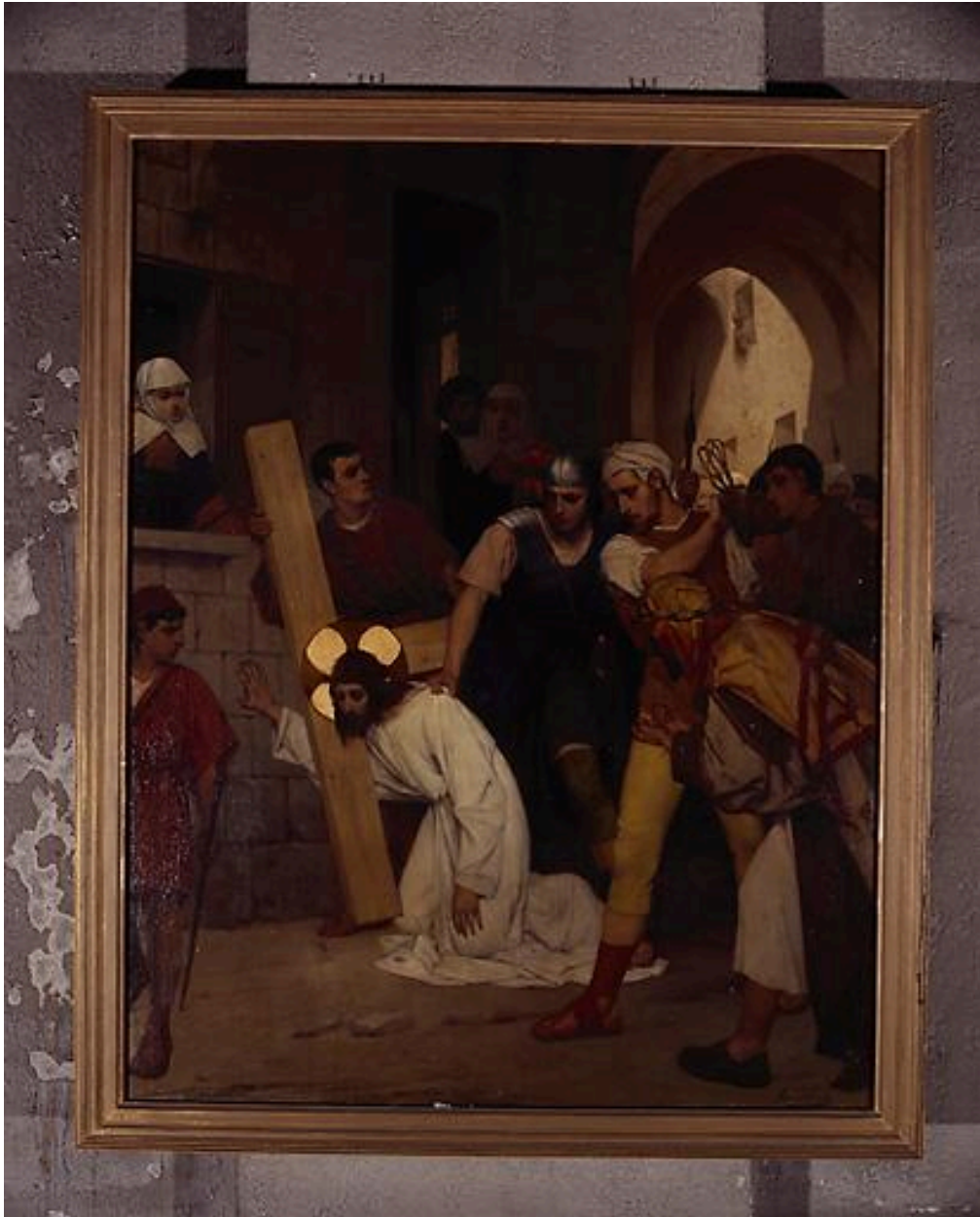
Station III, Jésus tombe pour la 1ère fois.