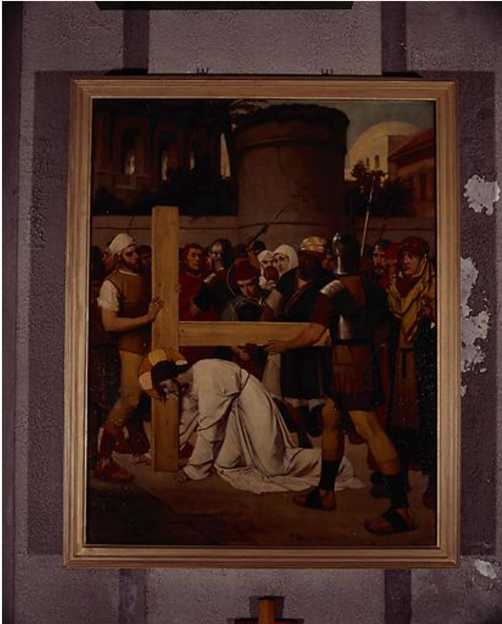
Station VII, Jésus tombe pour la 2e fois.