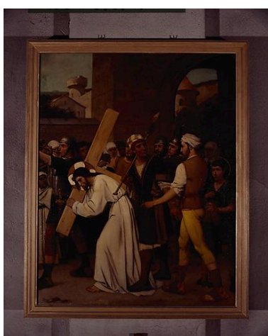
Station VI, Jésus aidé par Simon de Cyrène.