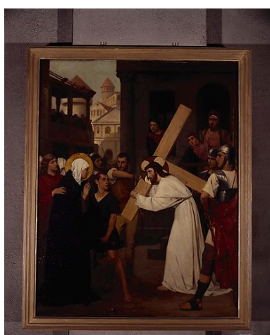
Station IV, Jésus rencontre sa Sainte Mère.