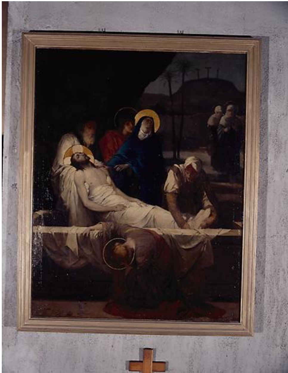
Station XIV, Jésus est mis au tombeau.