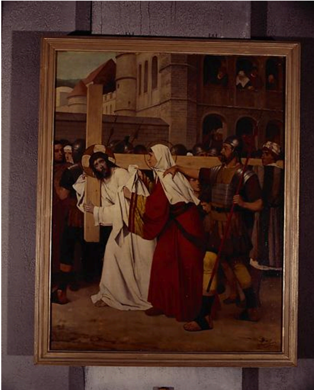
Station VI, Jésus essuyé par Sainte Véronique.