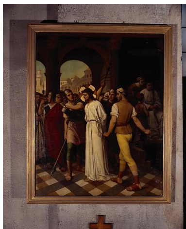
Station I, Jésus est condamné à mort. IVR31_19966200242XA