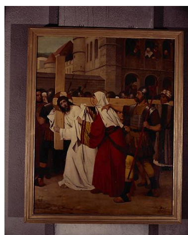
Station VI, Jésus essuyé par Sainte Véronique.