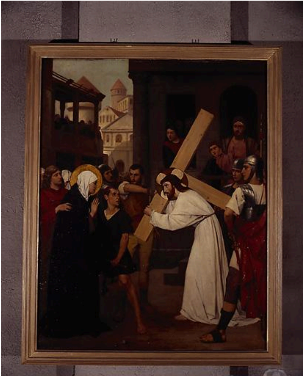
Station IV, Jésus rencontre sa Sainte Mère.