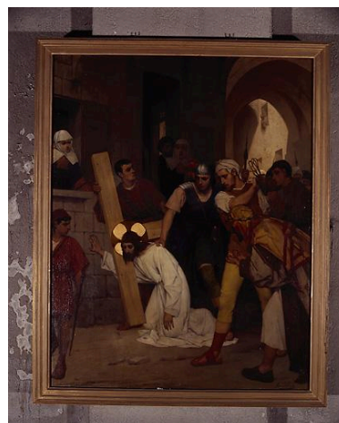
Station III, Jésus tombe pour la 1ère fois. IVR31_19966200244XA