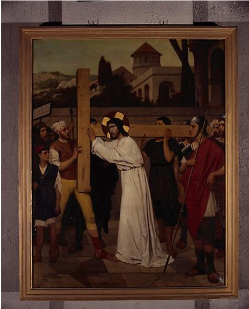
Station II, Jésus est chargé de sa croix.