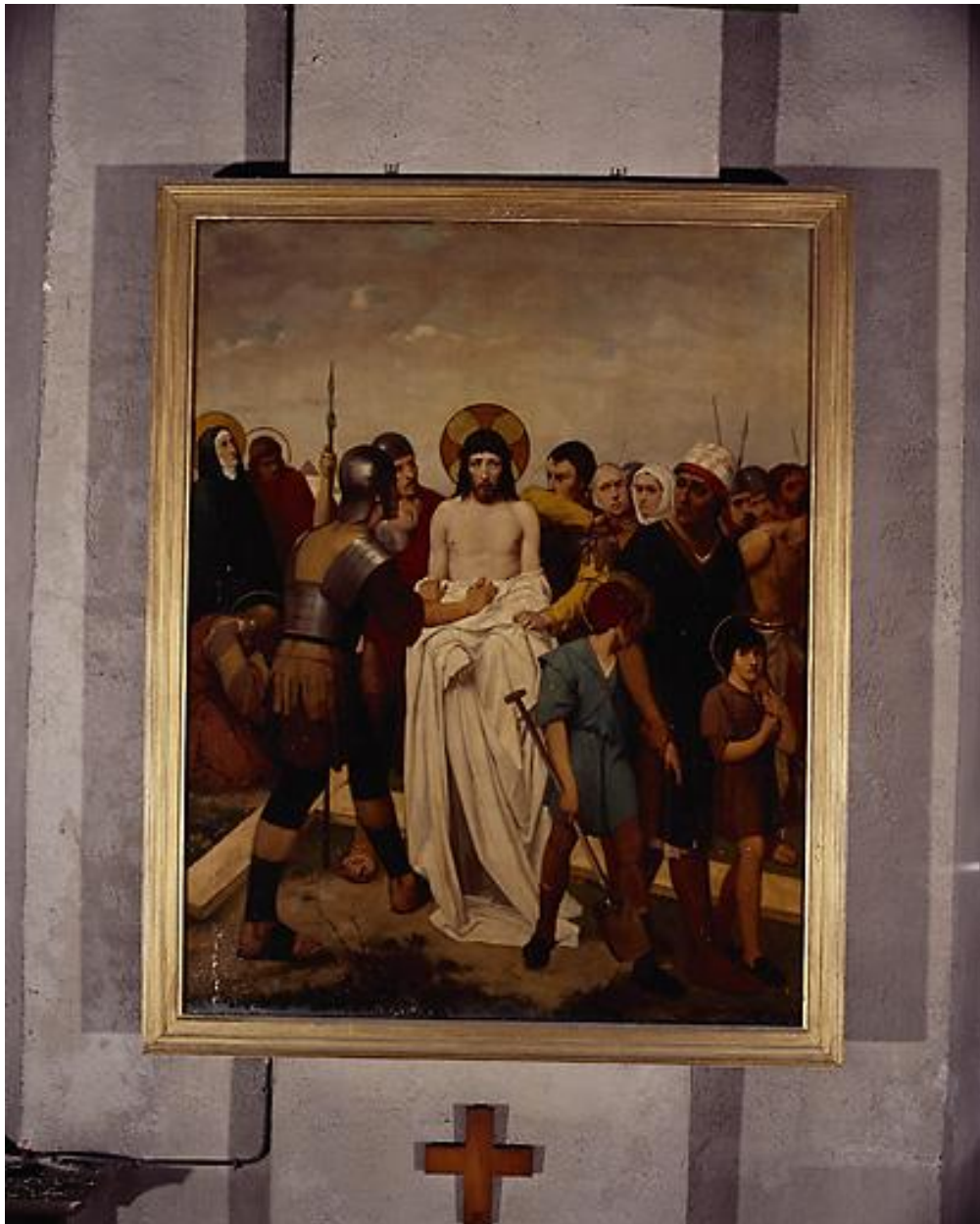
Station X, Jésus dépouillé de ses vêtements.