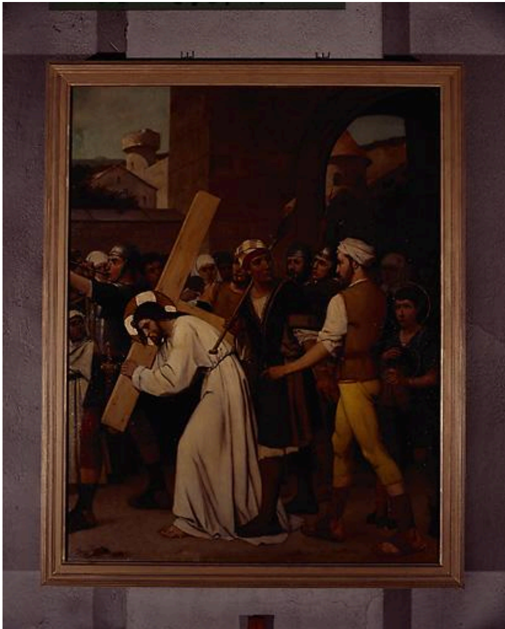
Station VI, Jésus aidé par Simon de Cyrène.