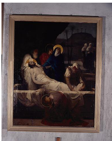
Station XIV, Jésus est mis au tombeau. IVR31_19966200255XA