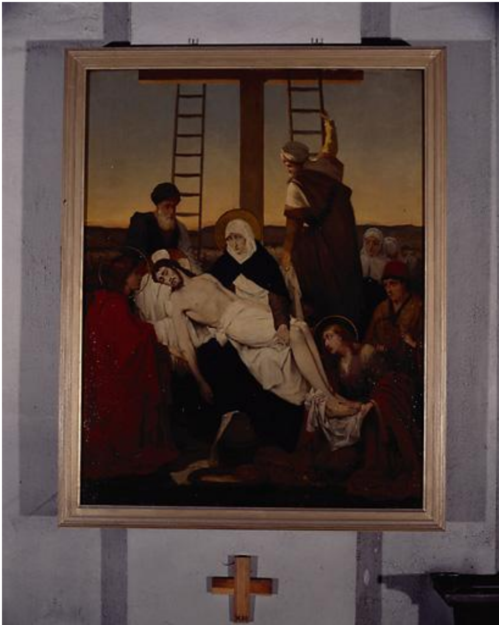
Station XIII, Jésus descendu de la croix.