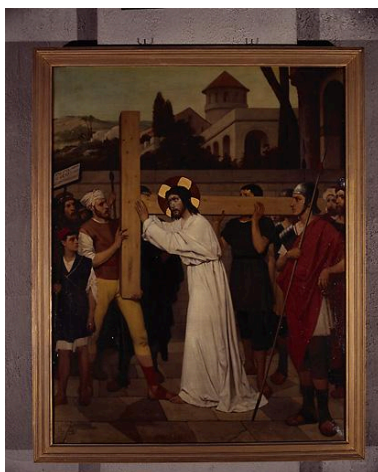
Station II, Jésus est chargé de sa croix. IVR31_19966200243XA