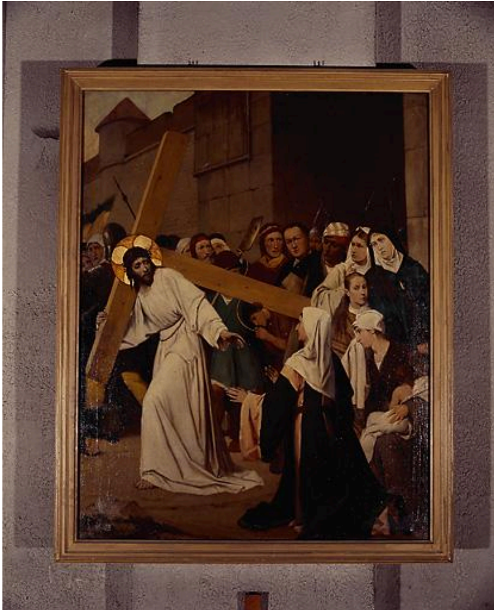
Station VIII, Jésus consolé par les filles de Jérusalem.