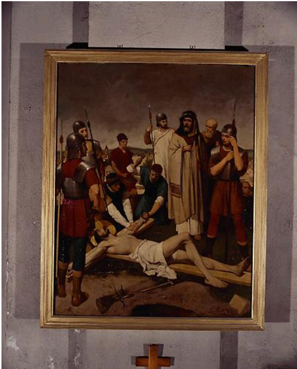
Station XI, Jésus cloué sur la croix.