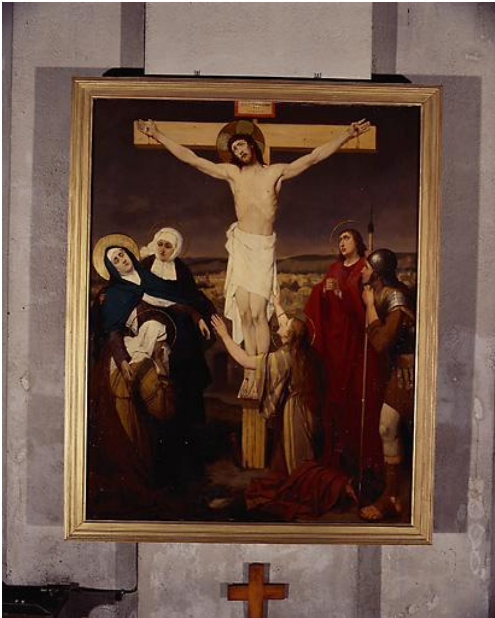
Station XII, Jésus meurt sur la croix.