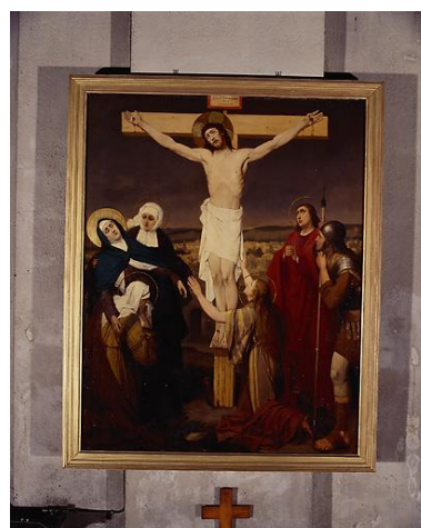
Station XII, Jésus meurt sur la croix.