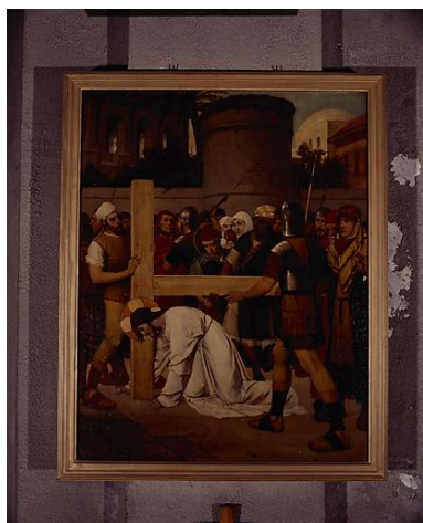
Station VII, Jésus tombe pour la 2e fois. IVR31_19966200248XA