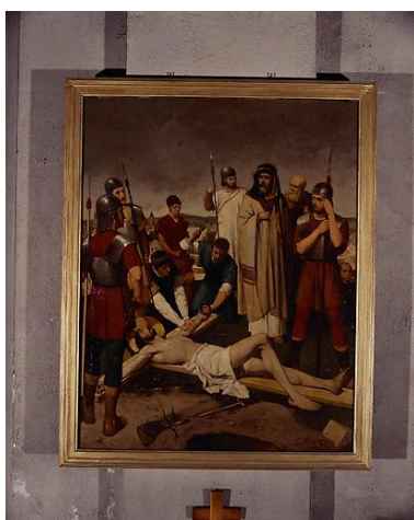
Station XI, Jésus cloué sur la croix. IVR31_19966200252XA