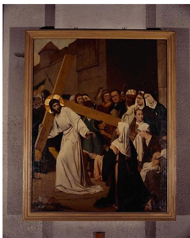
Station VIII, Jésus consolé par les filles de Jérusalem. IVR31_19966200249XA