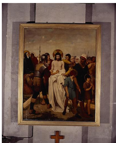
Station X, Jésus dépouillé de ses vêtements.