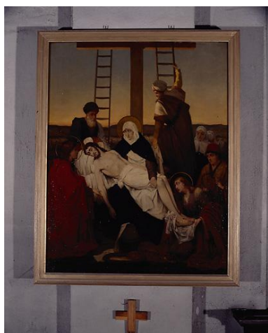
Station XIII, Jésus descendu de la croix. IVR31_19966200254XA