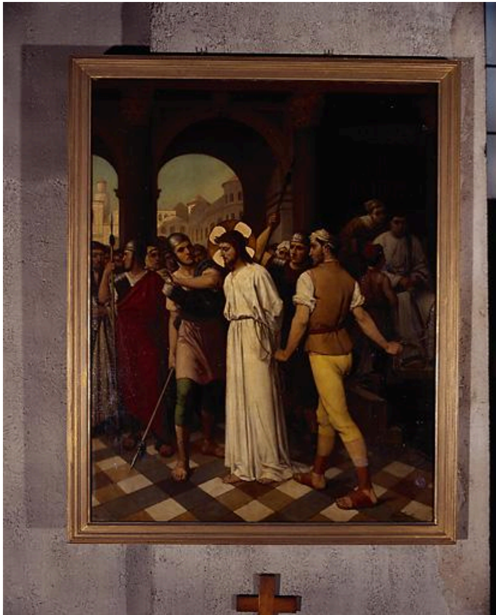
Station I, Jésus est condamné à mort.