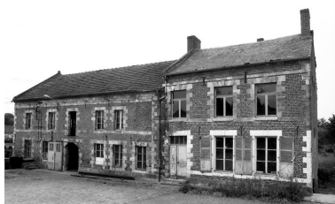
Vue de la façade du bâtiment principal. IVR22_19920201211Z