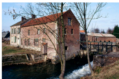
Vue d'ensemble, depuis le sud. IVR22_19920200408ZA