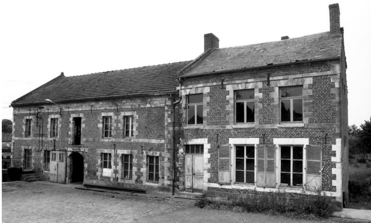
Vue de la façade du bâtiment principal.