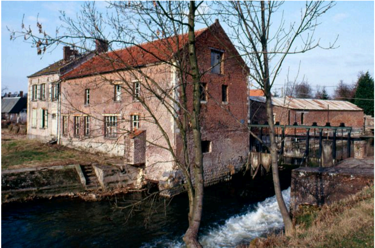
Vue d'ensemble, depuis le sud.