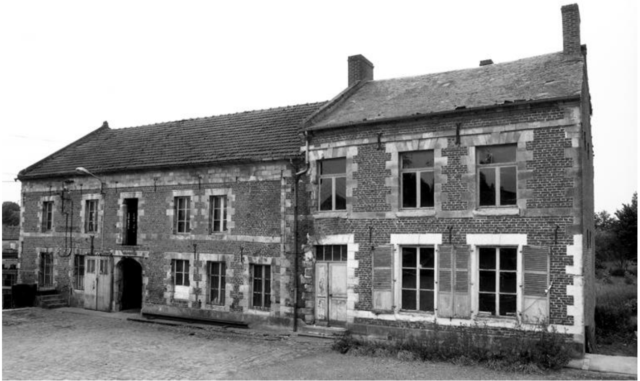
Vue de la façade du bâtiment principal.