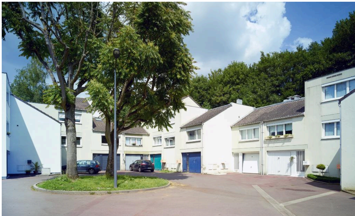
Ilot 2. Le blanc estompe la variété donnée aux façades, mais la végétation conserve son caractère à la placette.