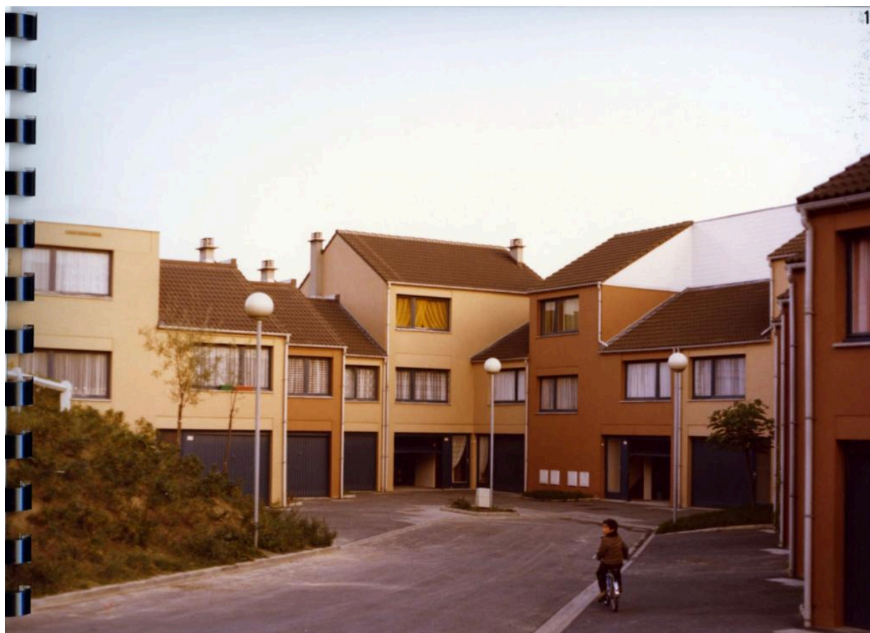
ilot 2, 1978. Le béton arbore des ocres qui tranchent avec le bleu foncé des menuiseries (AC Villeneuve d'Ascq, 16W3).