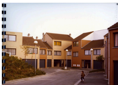
îlot 2, 1978. Le béton arbore des ocres qui tranchent avec le bleu foncé des menuiseries (AC Villeneuve d'Ascq, 16W3). Repro. Pierre Thibaut