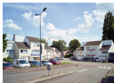
L'accès de l'îlot, en léger contrebas de l'avenue Champollion, accueillant commerces et stationnement.