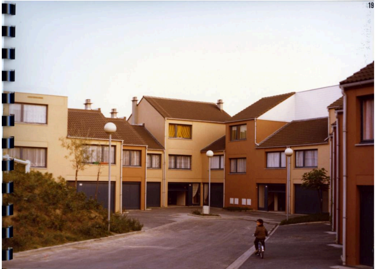
ilot 2, 1978. Le béton arbore des ocres qui tranchent avec le bleu foncé des menuiseries.