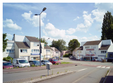
L'accès de l'îlot, en léger contrebas de l'avenue Champollion, accueillant commerces et stationnement.