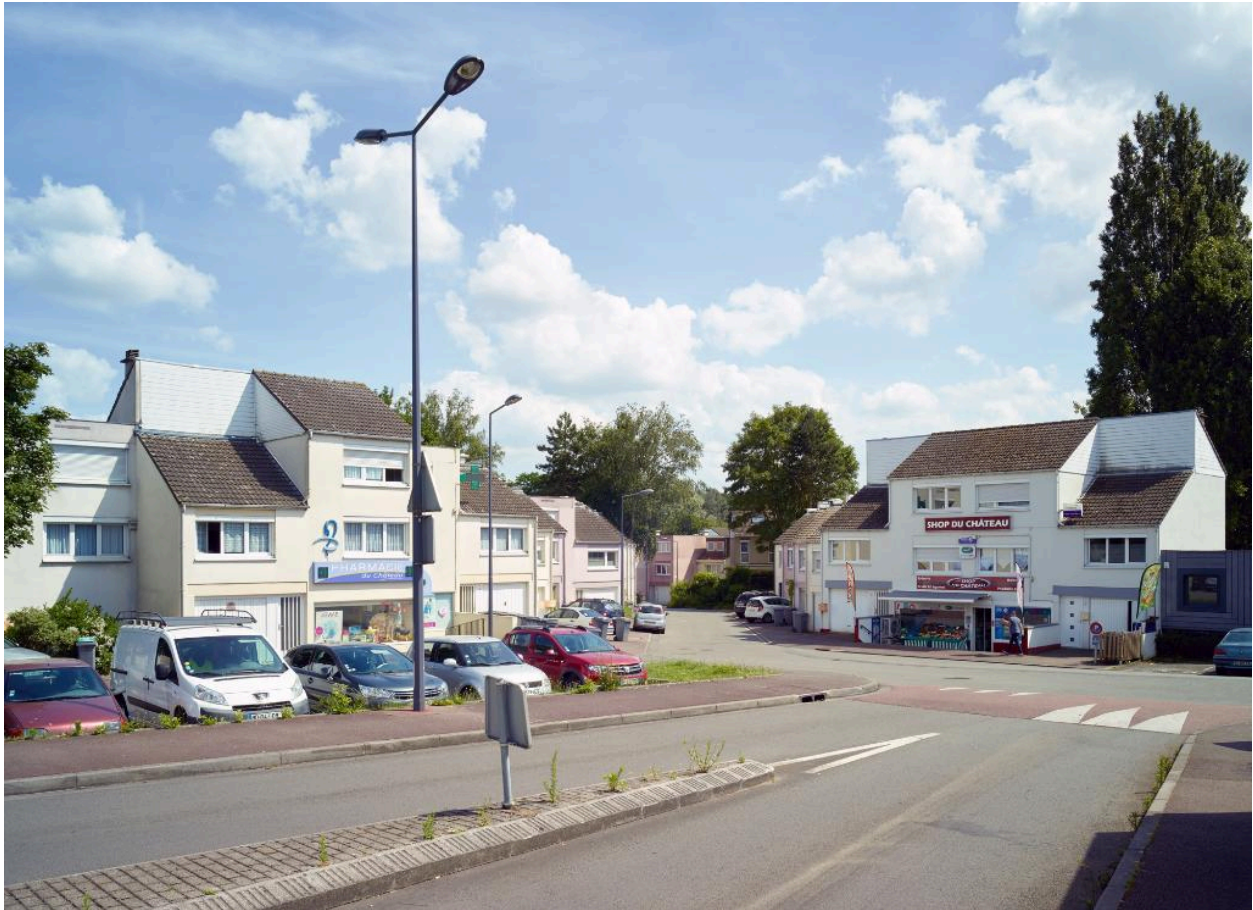
L'accès de l'îlot, en léger contrebas de l'avenue Champollion, accueillant commerces et stationnement.