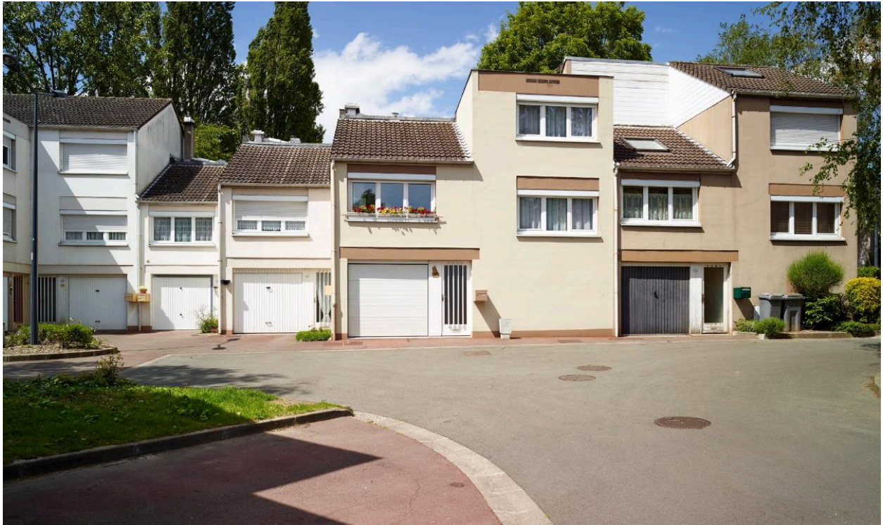
Placette au niveau du 169 allée Chardin.