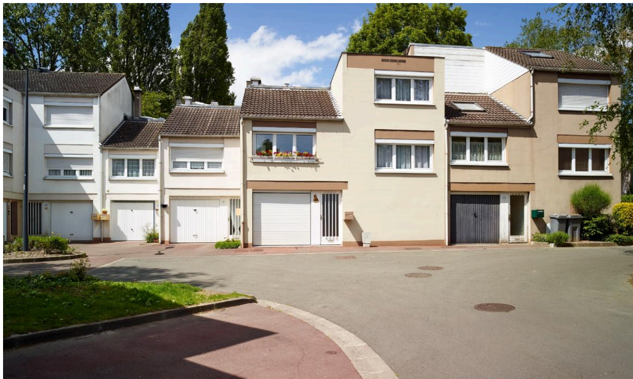
Placette au niveau du 169 allée Chardin.