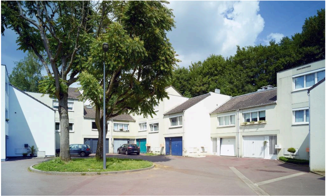
Ilot 2. Le blanc estompe la variété donnée aux façades, mais la végétation conserve son caractère à la placette.