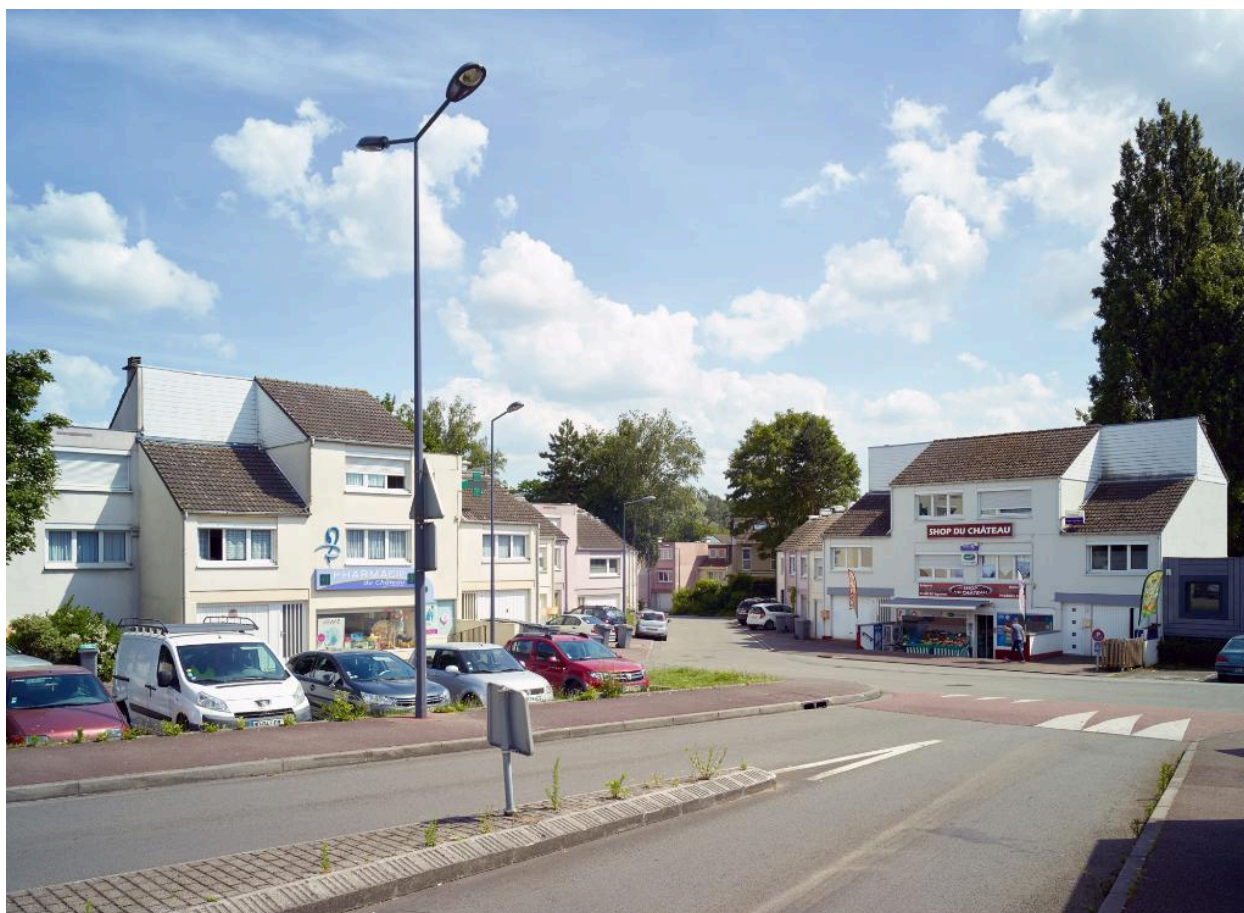
L'accès de l'îlot, en léger contrebas de l'avenue Champollion, accueillant commerces et stationnement.