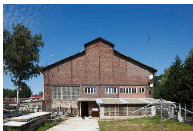
Seule halle de fabrication conservée de l'usine.