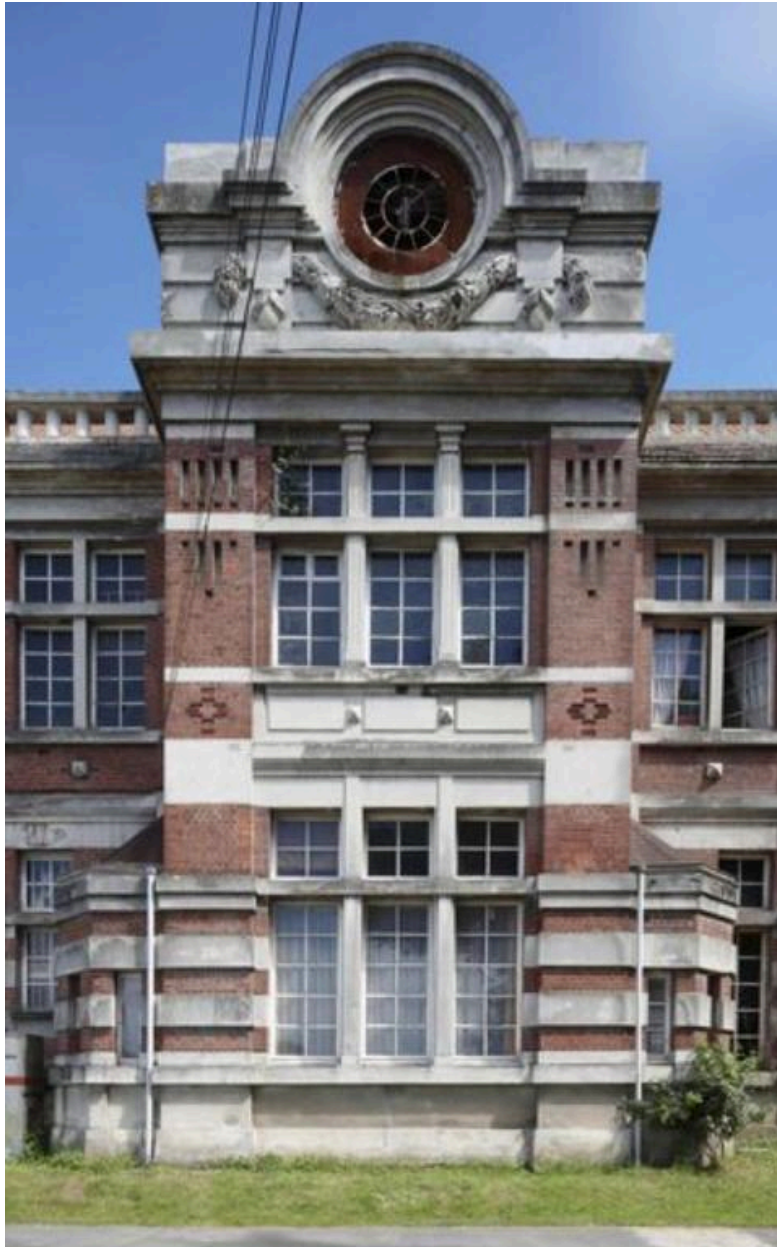
Vue générale de la travée centrale de l'élévation antérieure des bureaux.