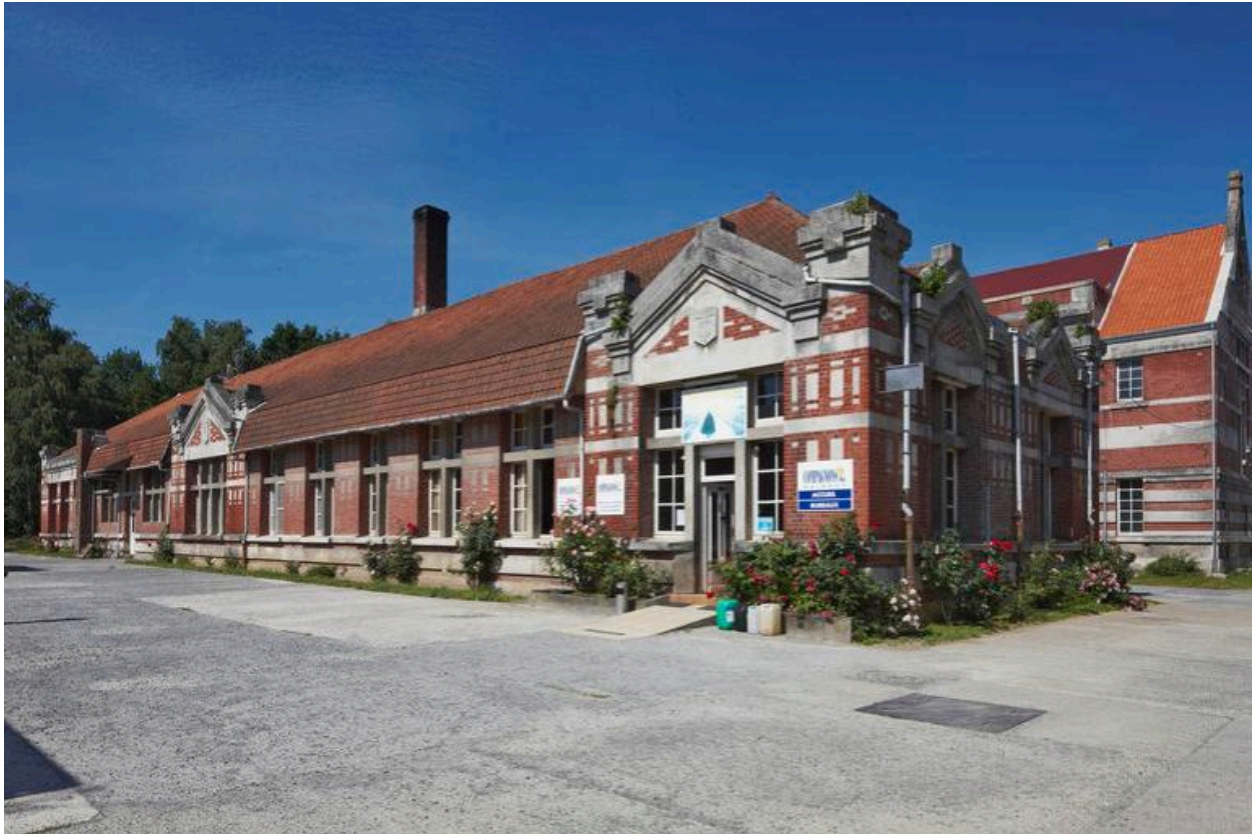
Vue générale des ateliers.