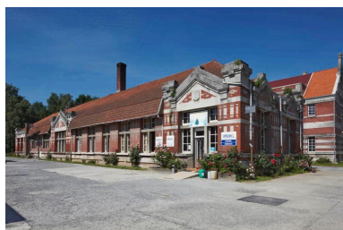
Vue générale des ateliers. IVR31_20105900340NUCA