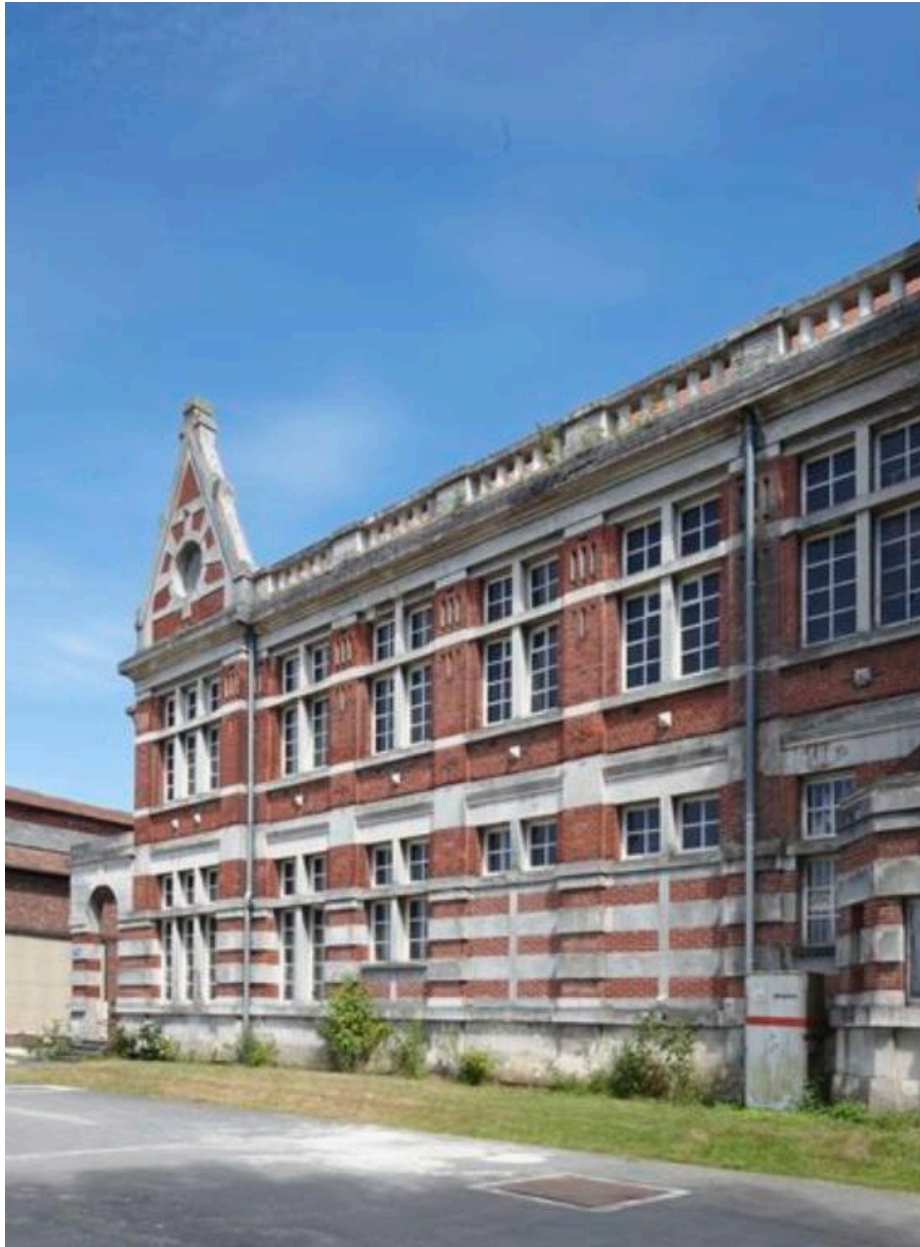
Vue partielle des bureaux, élévation antérieure.