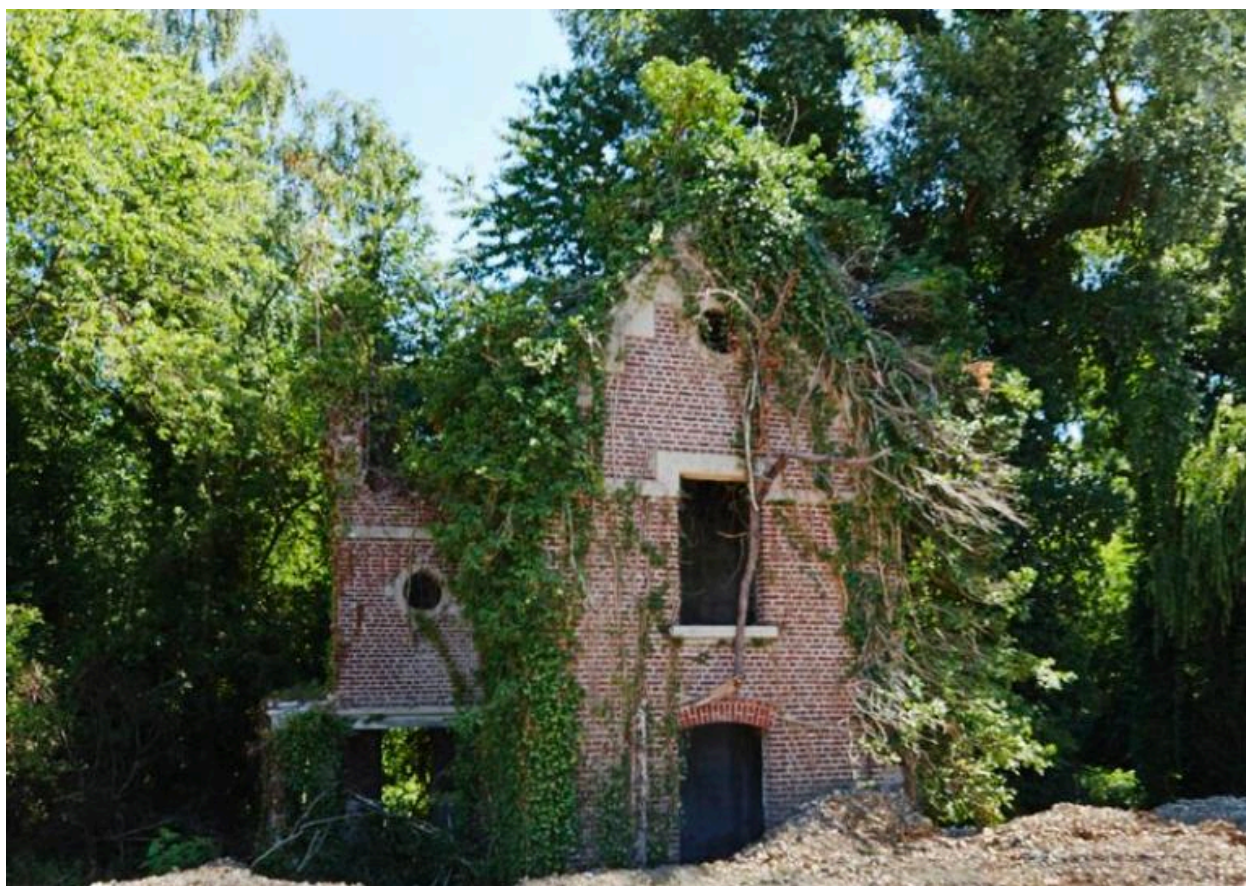
Ancienne maison de gardien de l'usine Kuhlmann.