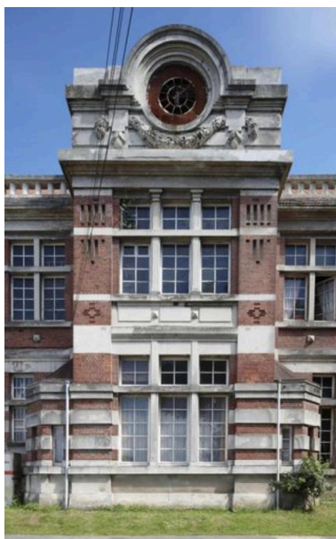
Vue générale de la travée centrale de l'élévation antérieure des bureaux.