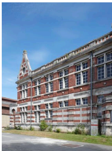
Vue partielle des bureaux, élévation antérieure.