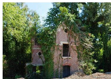
Ancienne maison de gardien de l'usine Kuhlmann.