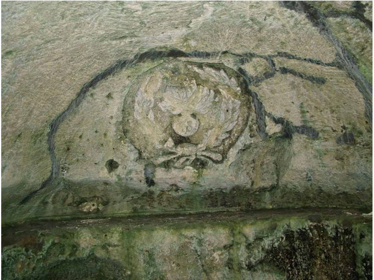
Ecusson sculpté d'une des maisons troglodytiques.