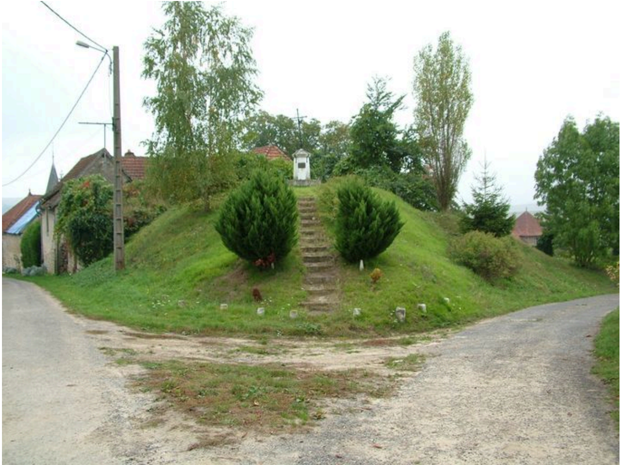
Vue de la croix de chemin située rue de la Fontaine.