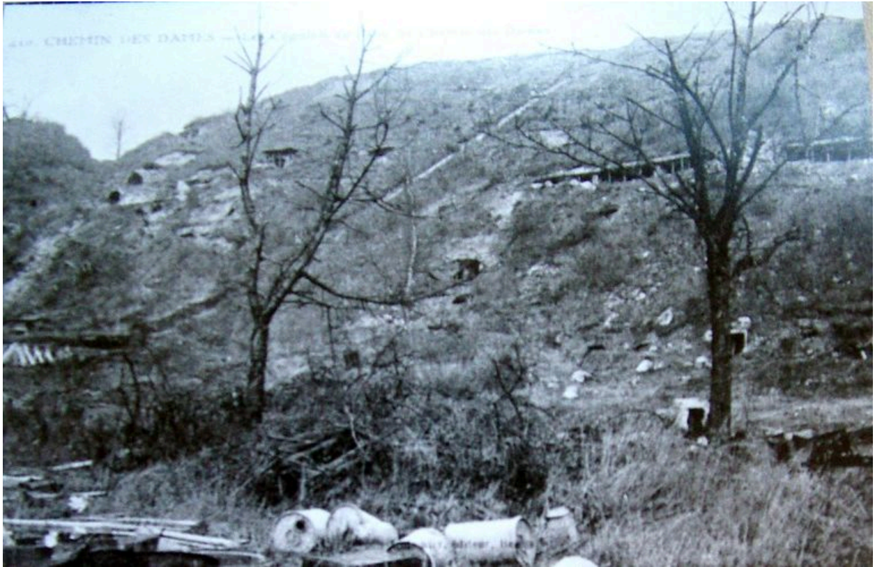
Vue des anciennes carrières transformées en abri par les soldats (coll. part).