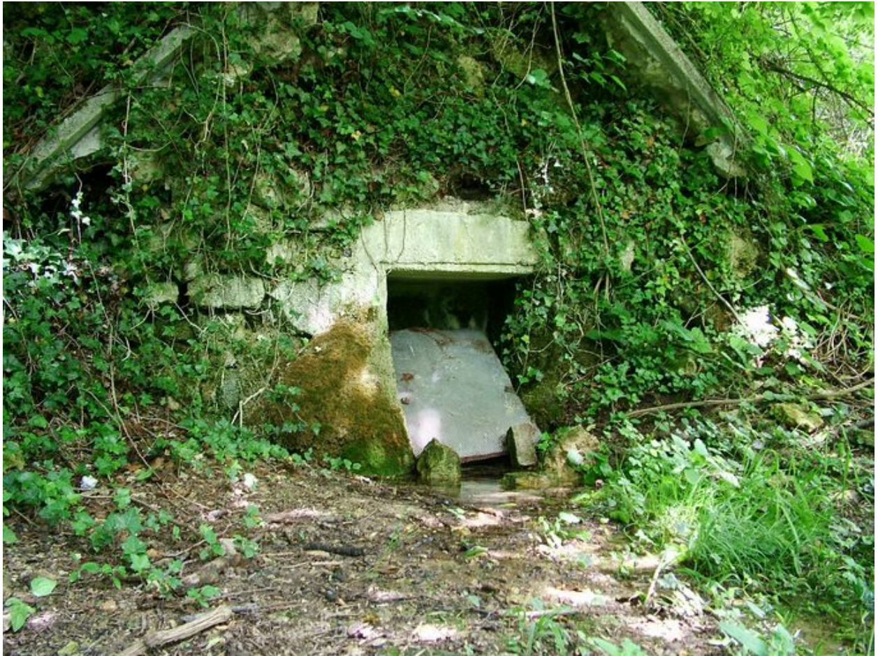
Vue de la fontaine Saint-Rémi.