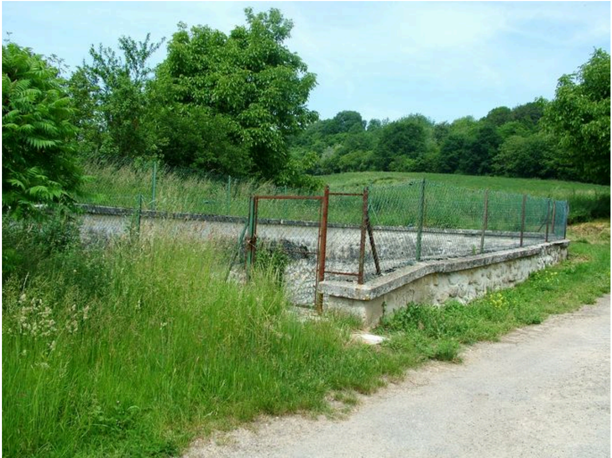
Vue du pédiluve dans la rue de la Fontaine.