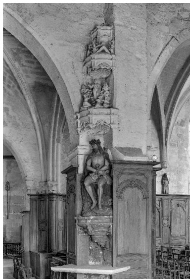
Vue de l'ensemble.