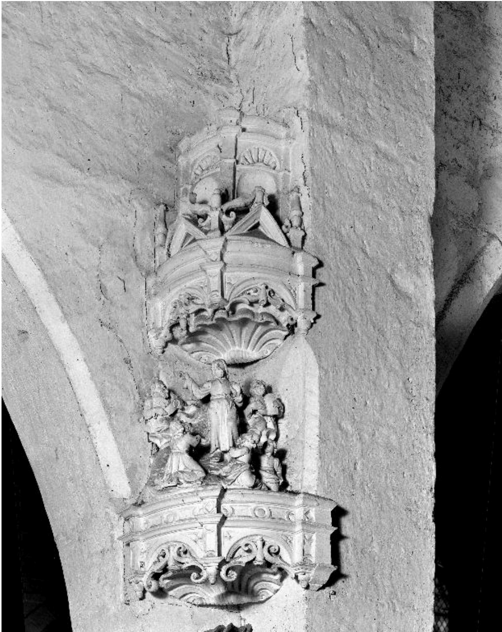
Vue des dais et du groupe de la Transfiguration qui surmontent le Christ de Pitié.