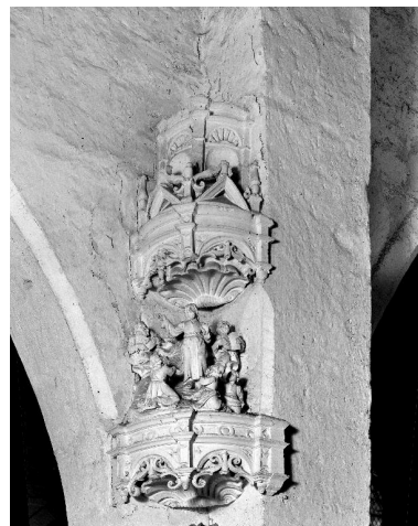
Vue des dais et du groupe de la Transfiguration qui surmontent le Christ de Pitié.