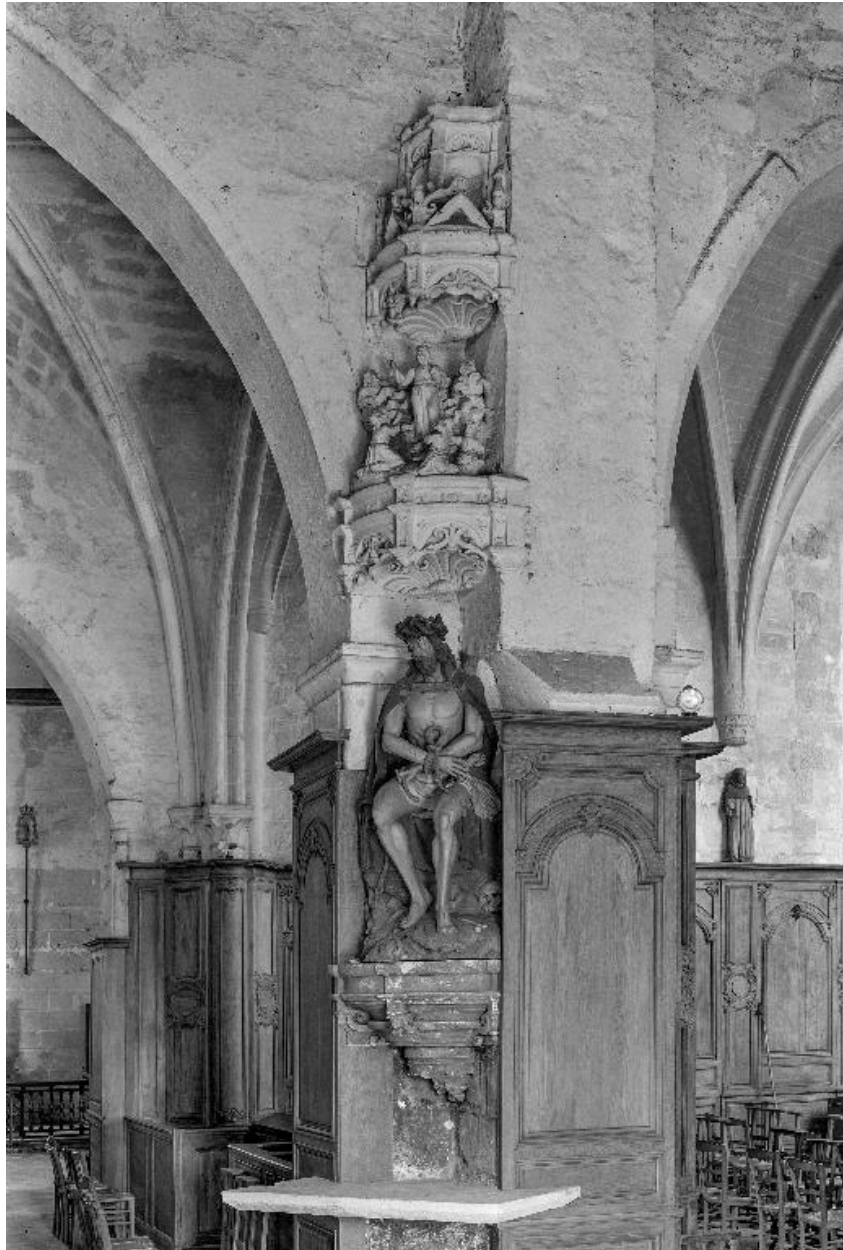
Vue de l'ensemble.