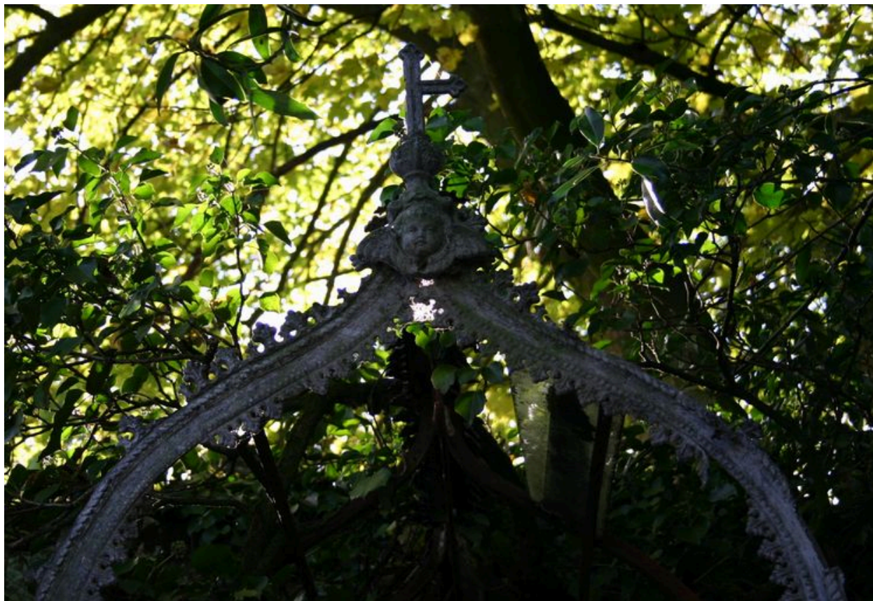
Détail de la partie supérieure du auvent-verrière (moultures en zinc et décor).