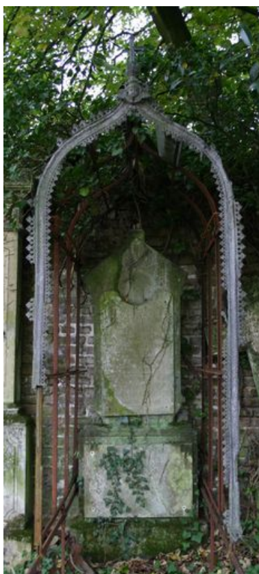
Stèle épaulée et auvent-verrière. IVR22_20068001603NUCA