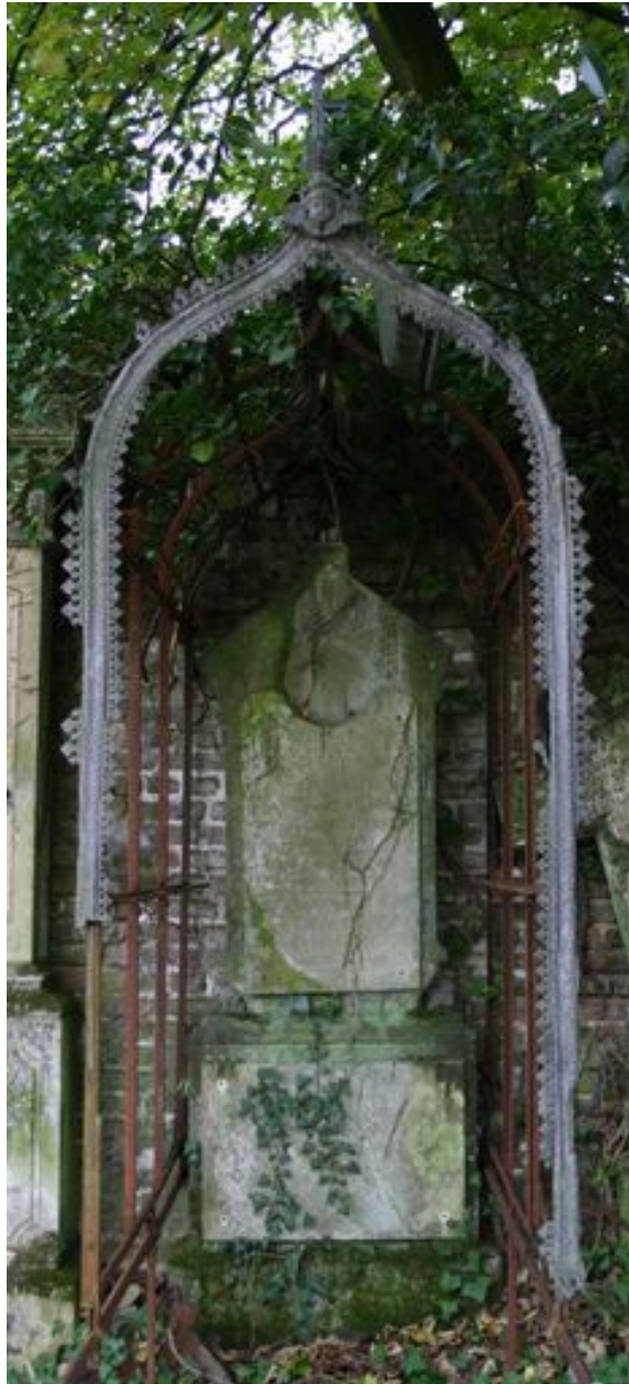
Stèle épaulée et auvent-verrière.