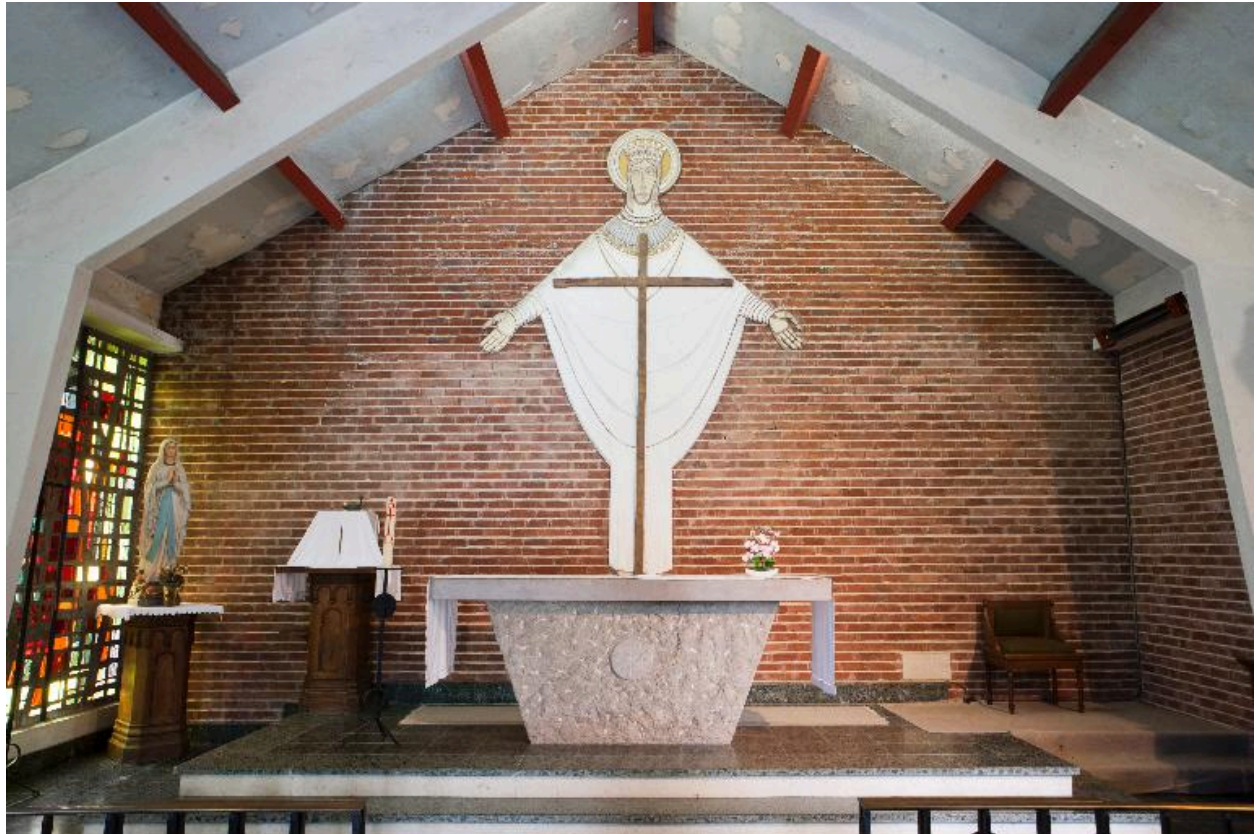
Vue générale du choeur et de l'autel.