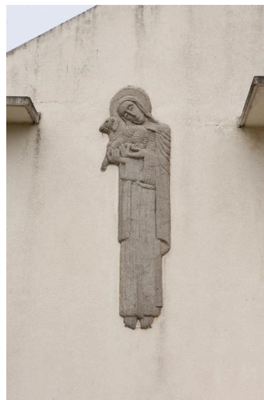
Bas relief de la façade représentant Saint-Jean-Baptiste. IVR31_20146203347NUC4A