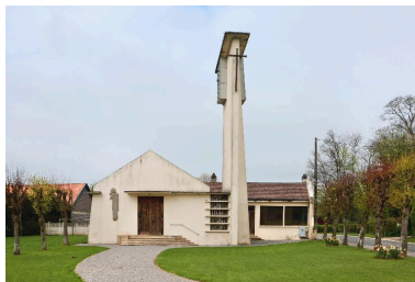
Vue générale de face. IVR31_20146203342NUC4A