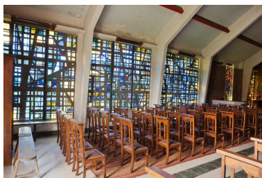
Vue générale des vitraux.