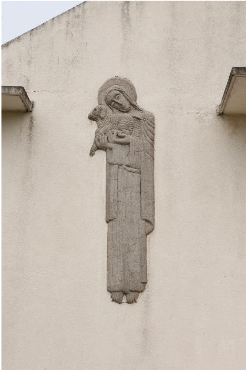
Bas relief de la façade représentant Saint-Jean-Baptiste.