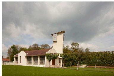
Vue générale latérale.