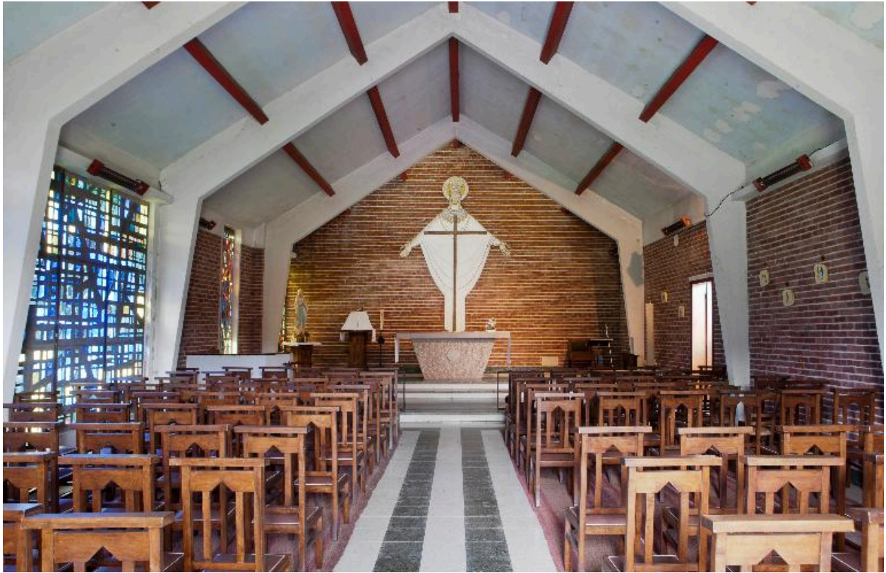
Vue générale de la nef.