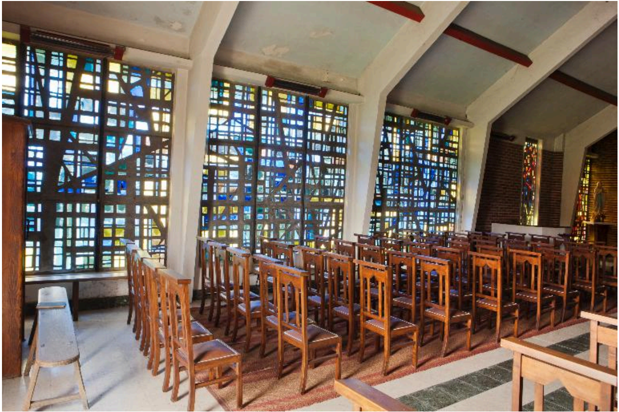
Vue générale des vitraux.