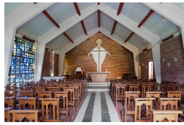
Vue générale de la nef. IVR31_20146203249NUC4A