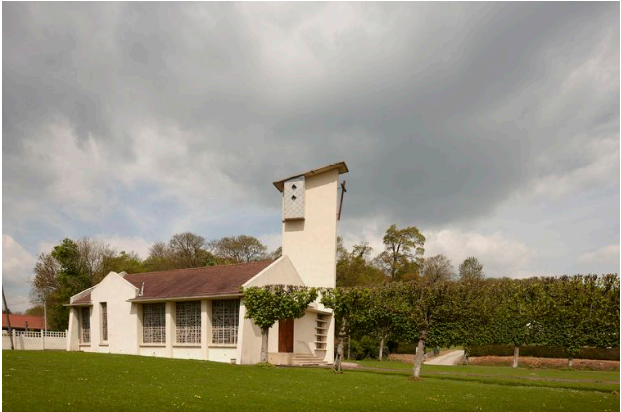
Vue générale latérale.