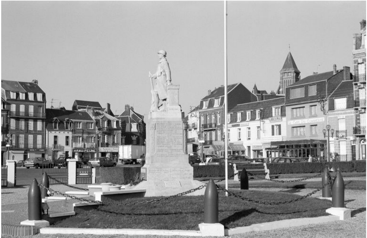
Vue de situation.