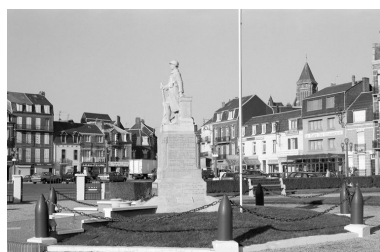
Vue de situation. IVR22_19968000142Z

Phot. Archives départementales de la Somme (reproduction) IVR22_20118005008NUCA