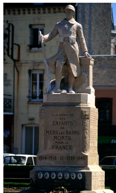
Vue générale. IVR22_19948000486ZA