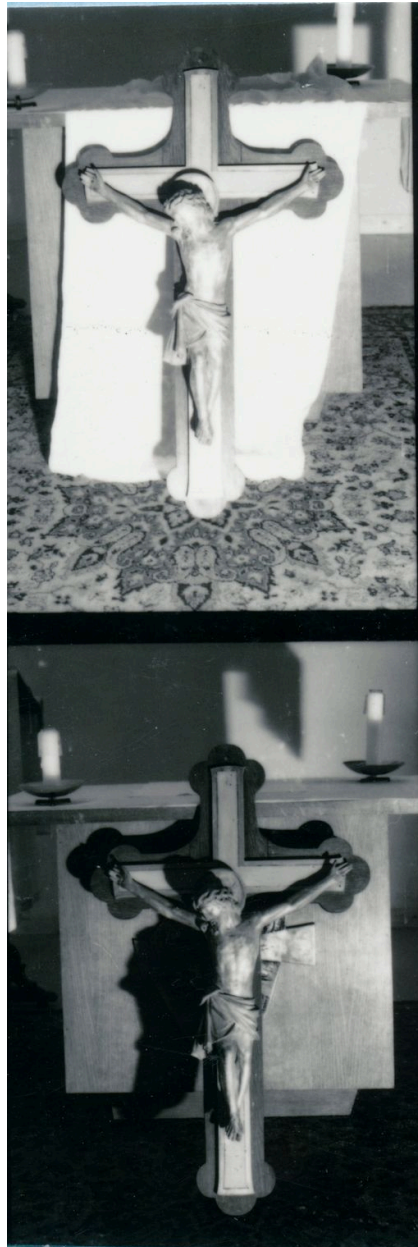
Vue générale (phot. Wintrebert, 1978, fonds AOA62)