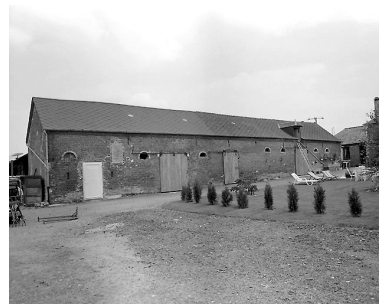
Etables à chevaux et à vaches.