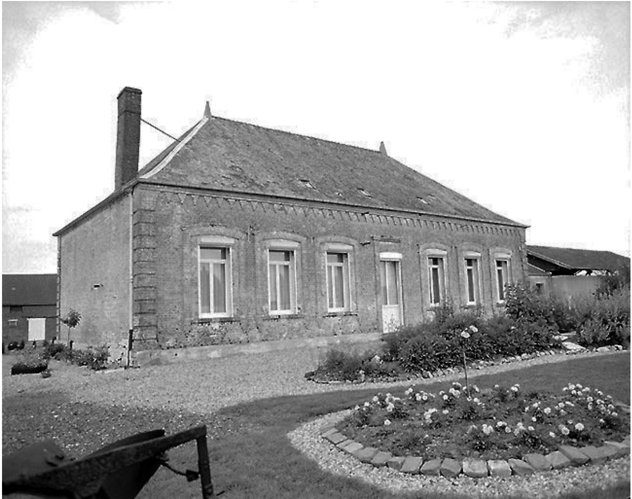
Vue générale de l'élévation postérieure du logis.