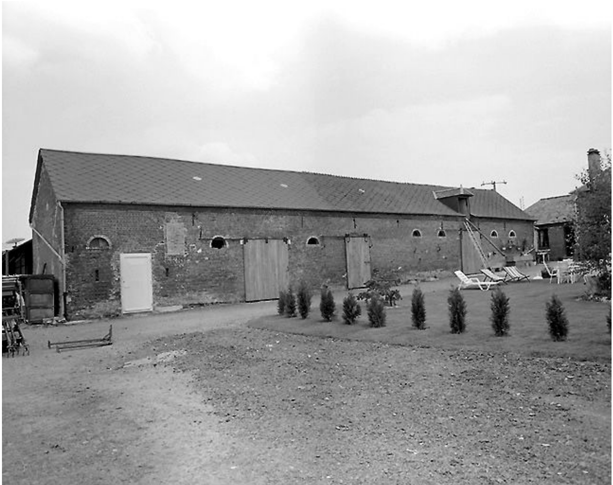
Etables à chevaux et à vaches.