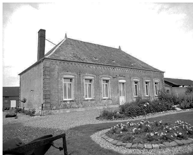
Vue générale de l'élévation postérieure du logis. IVR22_19980201767X