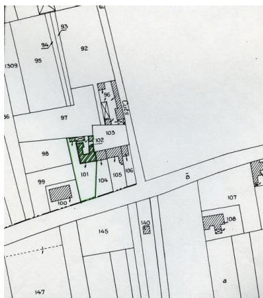
Plan de situation. Extrait du plan cadastral de 1962, section B1 101.