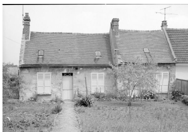
Elévation antérieure.