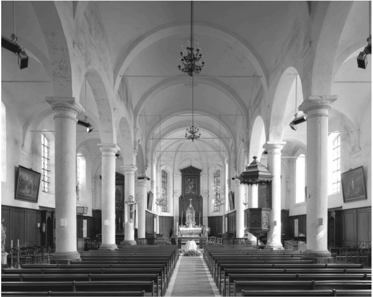
Vue générale intérieure vers le chœur.