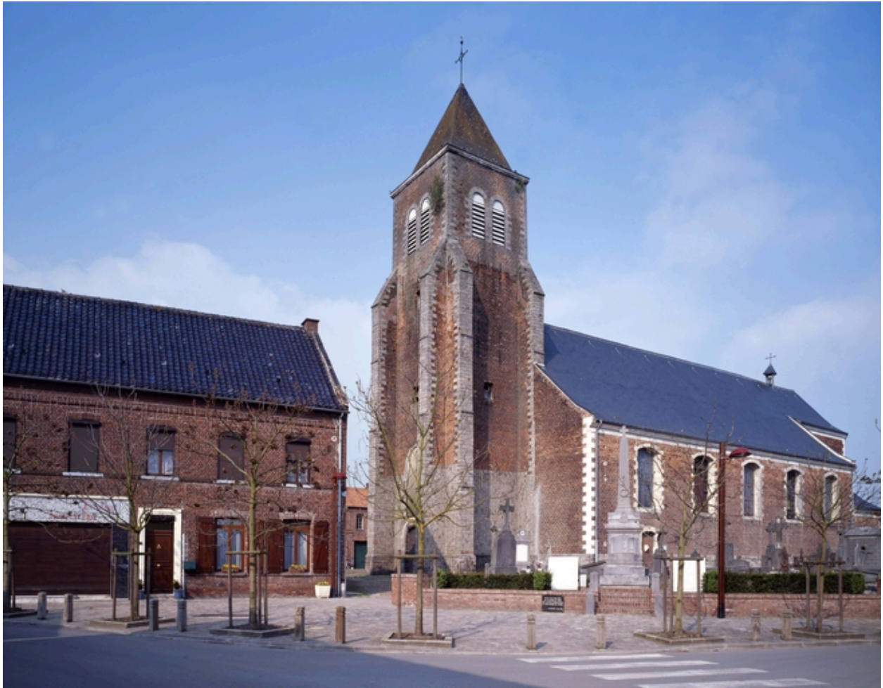
Vue générale depuis la rue de l'Eglise.