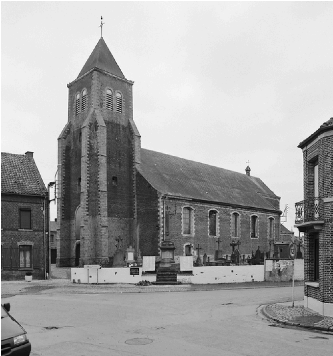
Vue générale de trois quarts, depuis la rue de la Place.