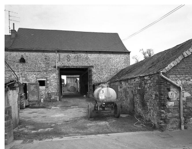
Vue de la grange et de la porcherie.