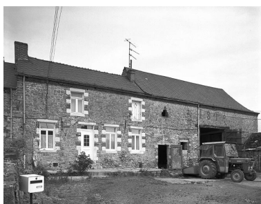
Vue générale. IVR31_20055904312V