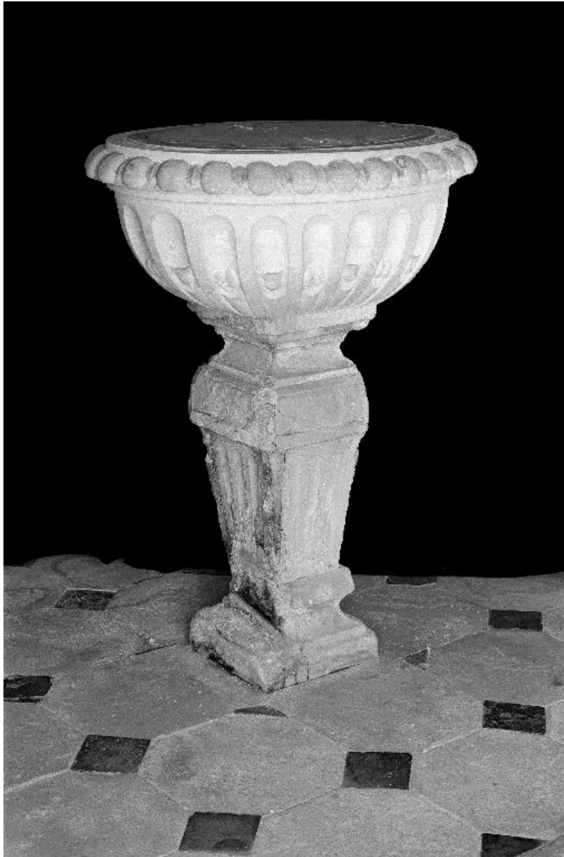
Vue générale des fonts.