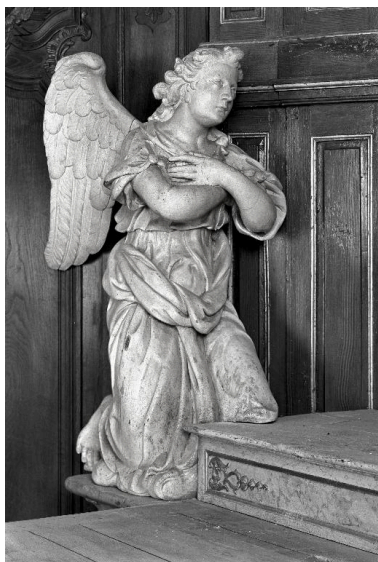
Vue de l'ange de gauche. IVR22_19920202159X