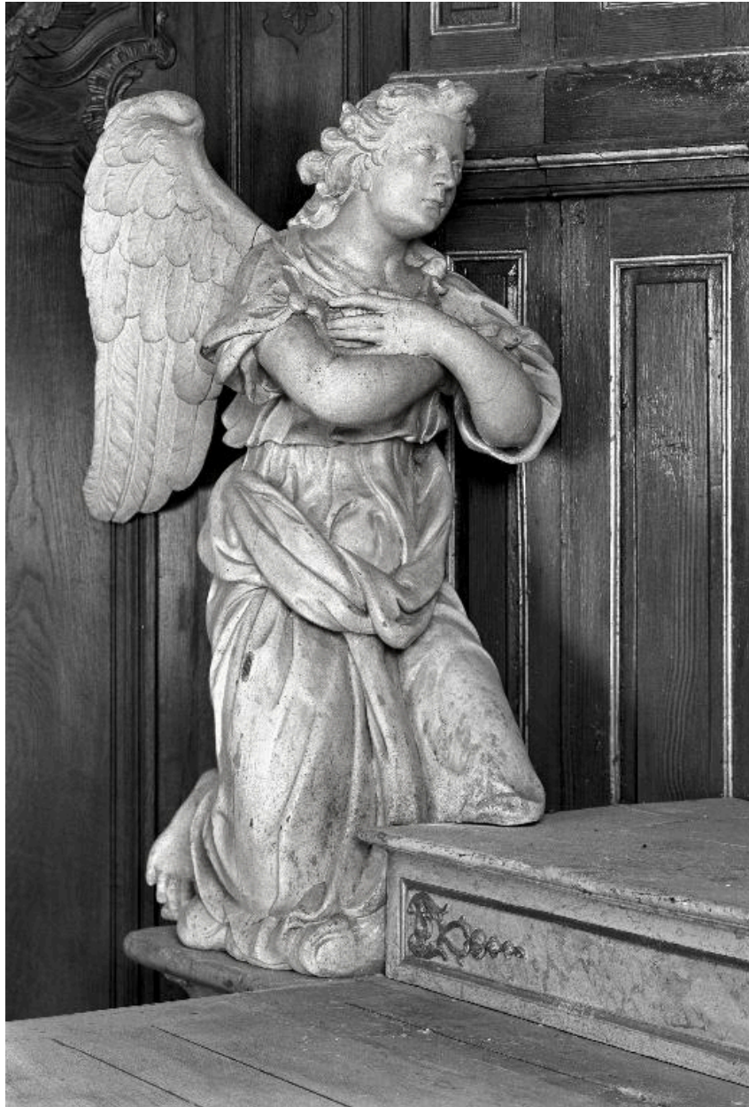
Vue de l'ange de gauche.