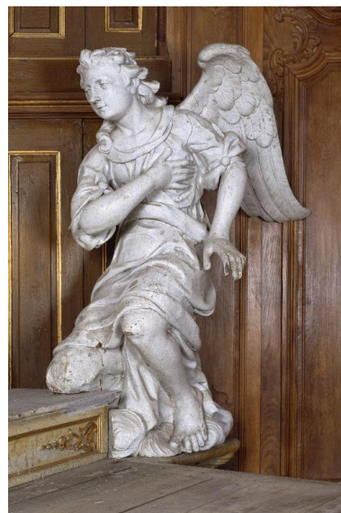
Vue de l'ange de droite.