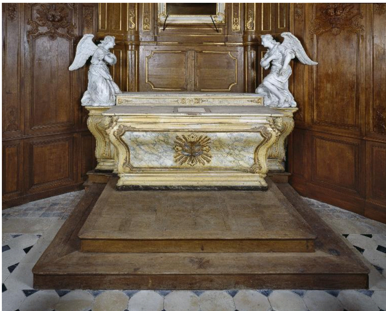
Vue générale du maître-autel et des deux anges adorateurs.