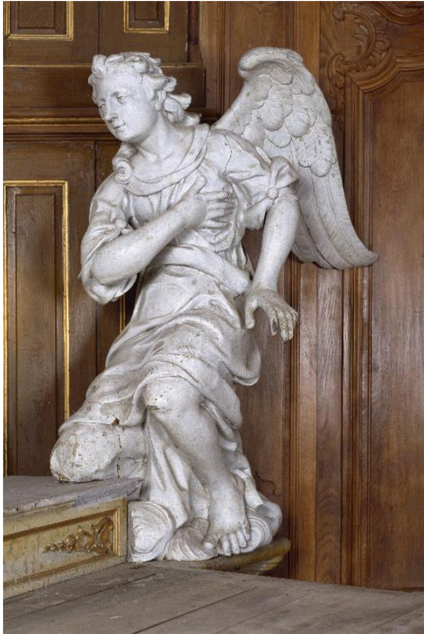
Vue de l'ange de droite.