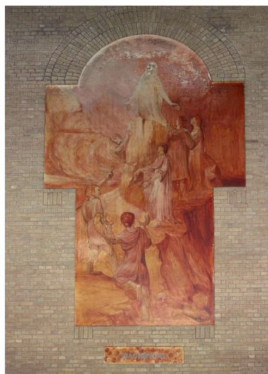
Vue de la peinture ouest : Magnificat. IVR32_20215900371NUCA