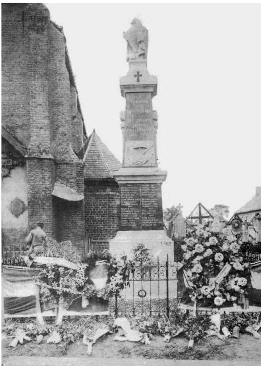
Monument aux morts de Buysseure, carte postale, après 1923 (coll. Comité flamand de France).