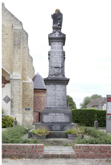
Face principale. IVR32_20245902930NUCA