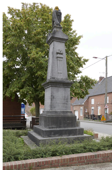
Profil gauche et arrière.