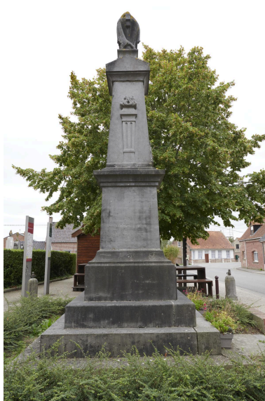
Profil gauche. IVR32_20245902932NUCA