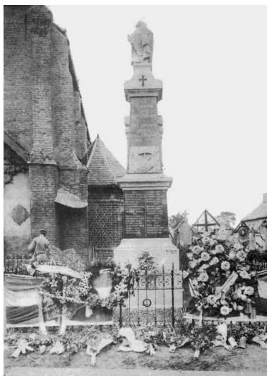
Monument aux morts de Buysseure, carte postale, après 1923 (coll. Comité flamand de France). IVR32_20255900110NUCAB