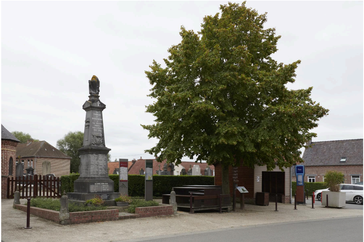
Monument dans son environnement direct.