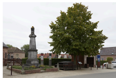
Monument dans son environnement direct. IVR32_20245902931NUCA