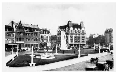
Arras. La place de la Gare. Carte postale, vers 1930-1940 (AD Pas-de-Calais ; 38 FI 560). IVR31_20096200084XB