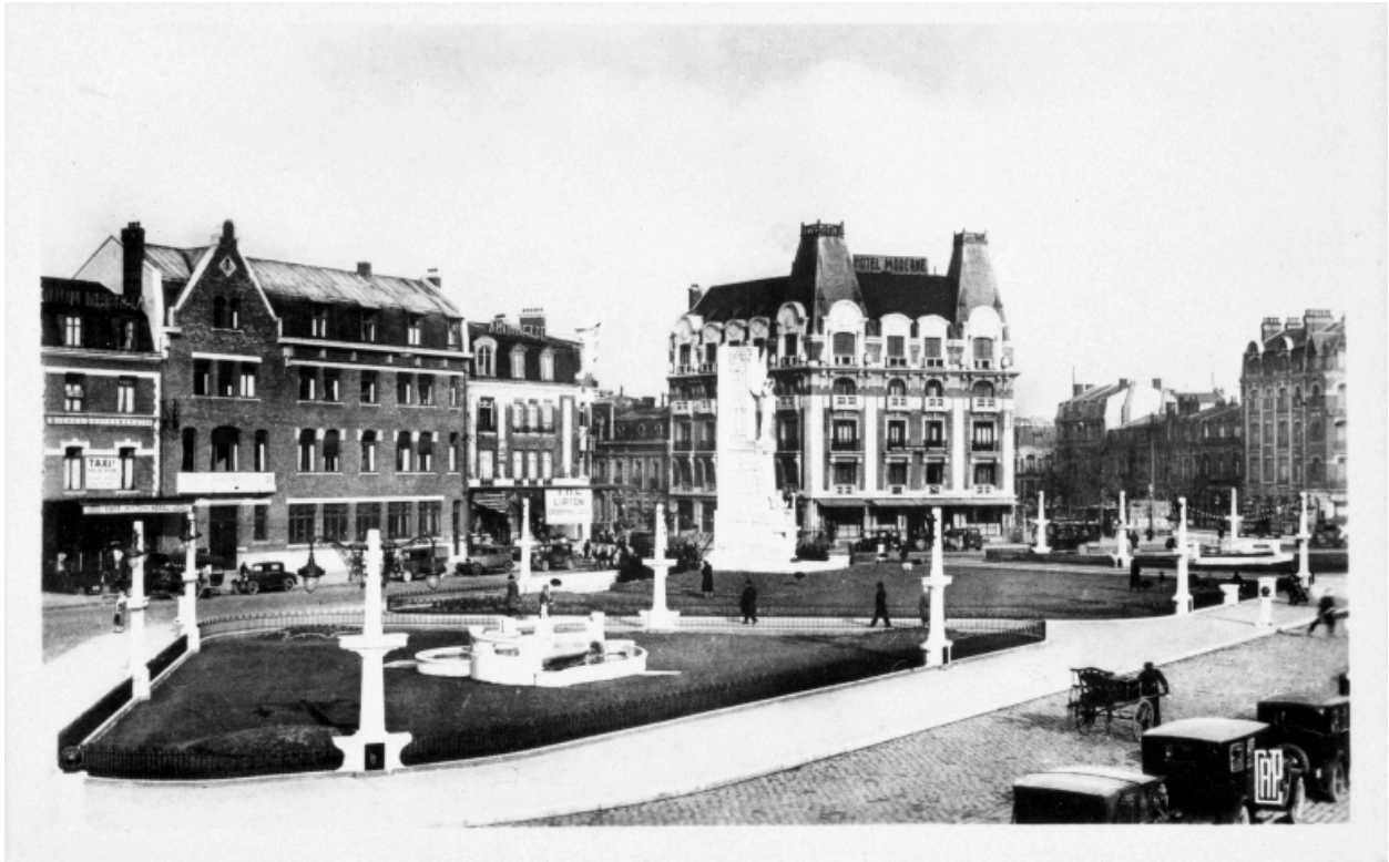
Arras. La place de la Gare. Carte postale, vers 1930-1940.