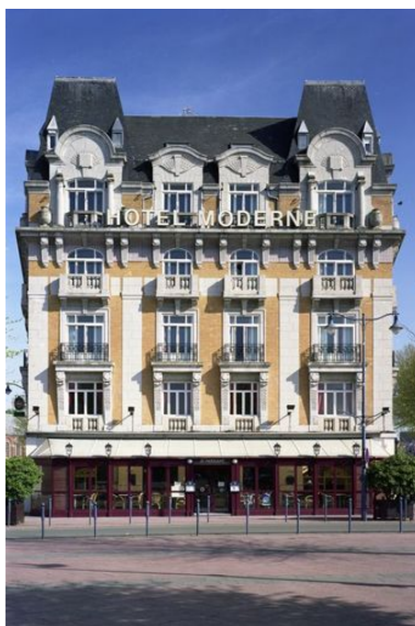
Vue générale. IVR31_20086200214XE