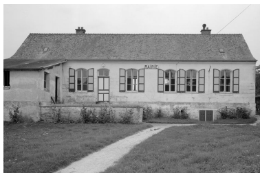
Elévation antérieure. IVR22_19846001060X