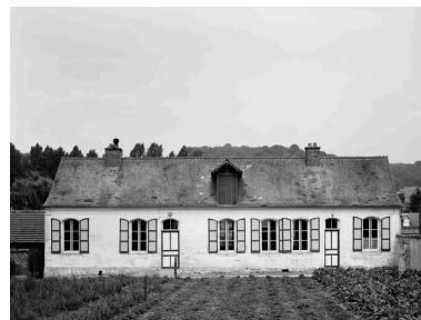
Elévation postérieure. IVR22_19846001112V