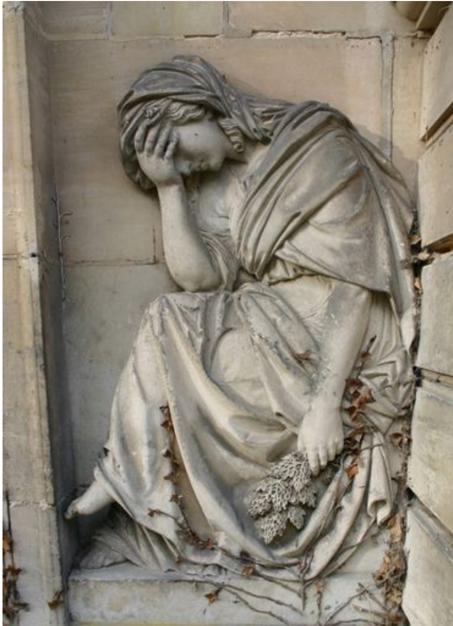
Vue rapprochée de la pleureuse droite.