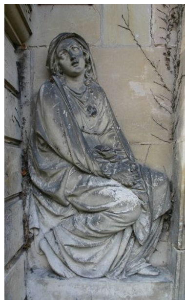
Vue rapprochée de la pleureuse gauche.