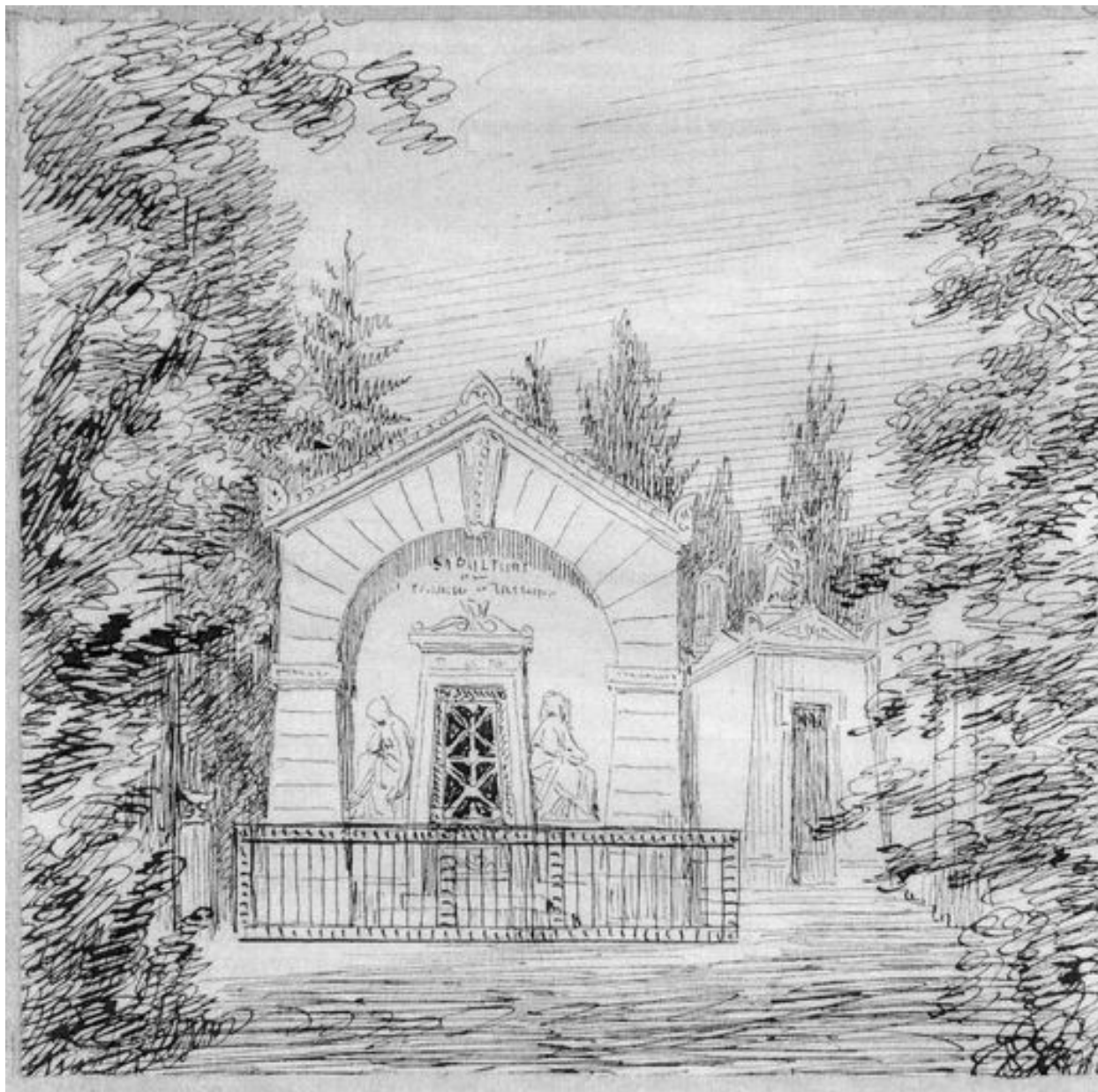
Le tombeau Tattegrain-Delabarthe au cimetière de la Madeleine, dessin des frères Duthoit, vers 1850 (Musée de Picardie, Amiens ; MP Duthoit).