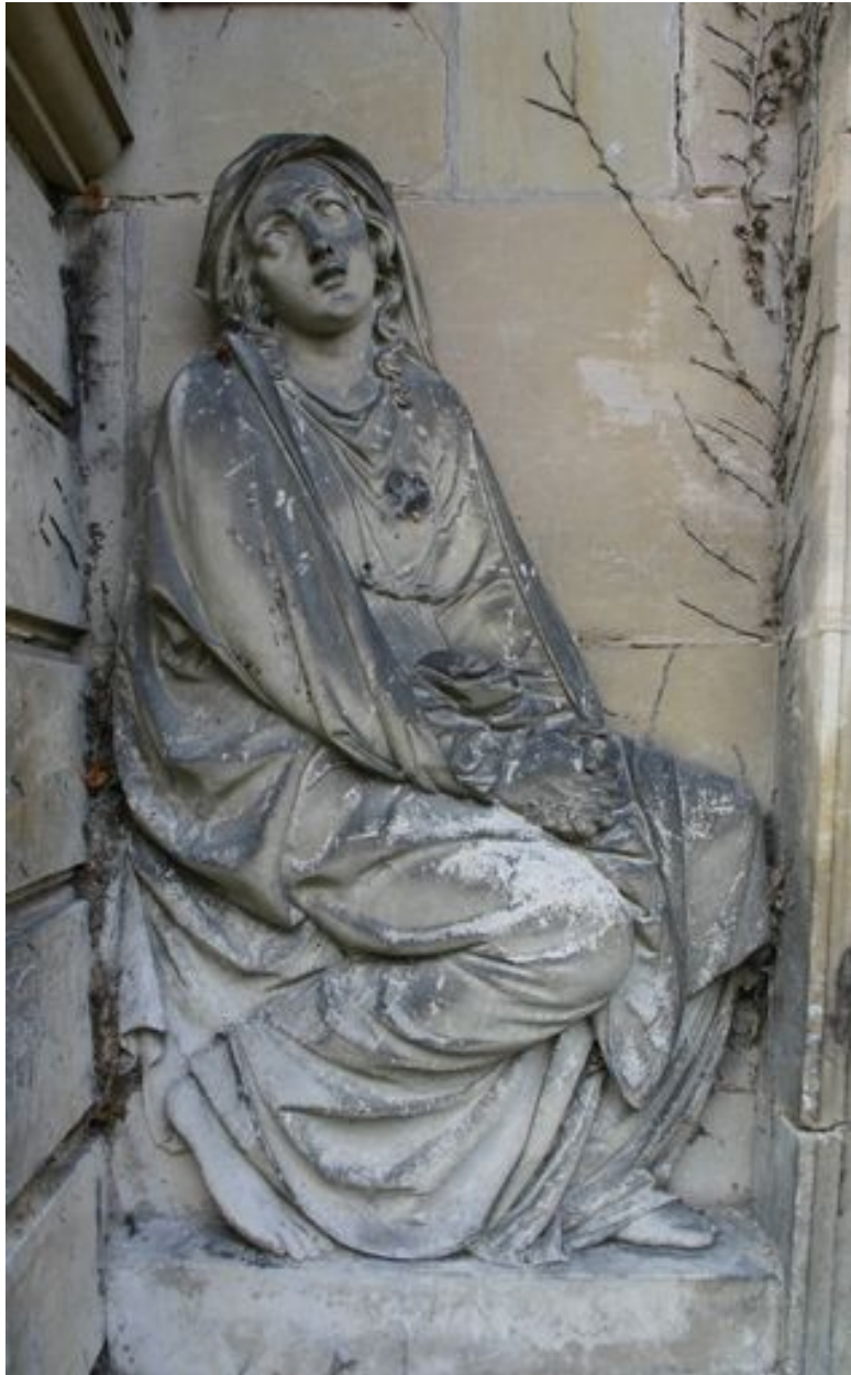
Vue rapprochée de la pleureuse gauche.