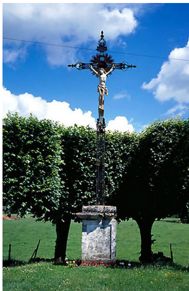
Vue générale. IVR22_19980201263XA