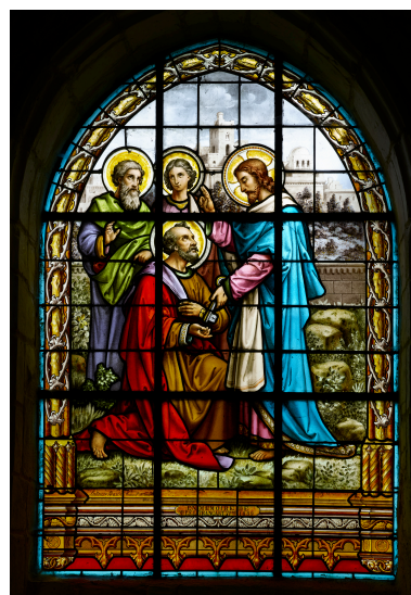
Verrière du chœur, Jésus remettant les clés du Paradis à saint Pierre. IVR32_20258000072NUCA