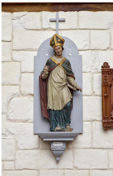
Statue, évêque ou abbé tenant un livre. IVR32_20258000097NUCA