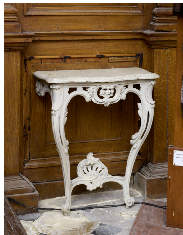
Console, style rocaille. IVR32_20258000067NUCA