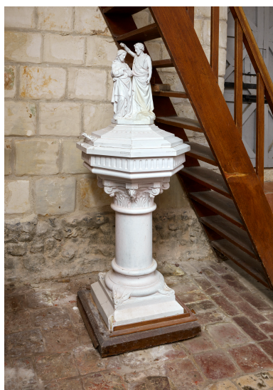
Fonts baptismaux. IVR32_20258000094NUCA