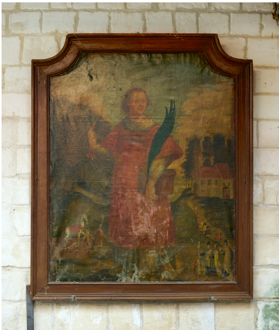
Tableau, saint Nazaire.