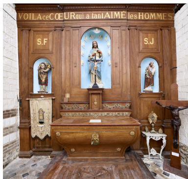
Maître-autel et retable. IVR32_20258000061NUCA