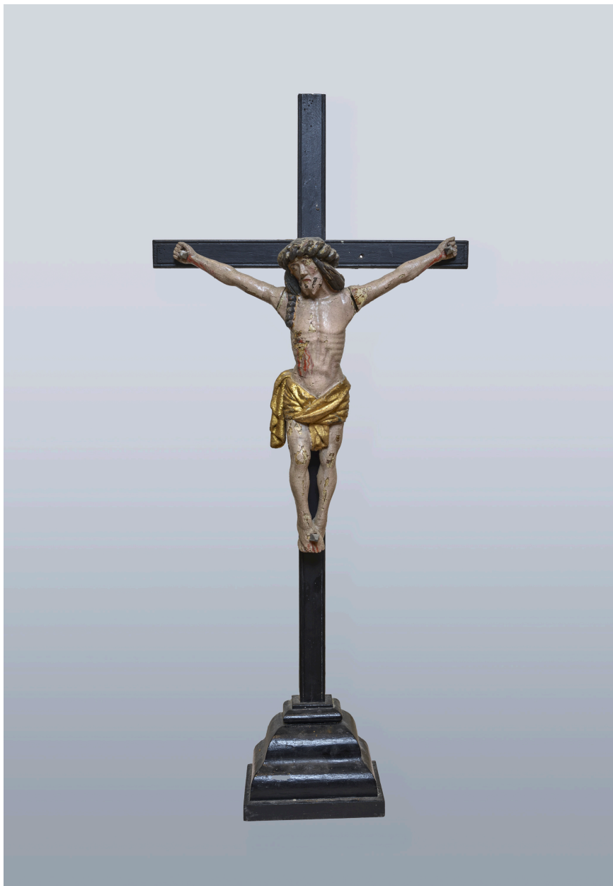
Statuette, Christ en croix.