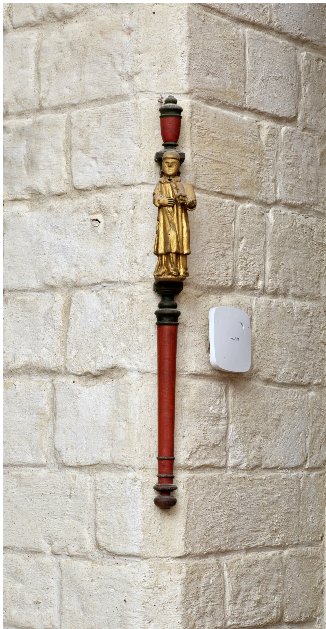
Bâton de chantre.