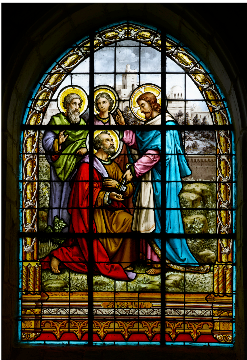
Verrière du chœur, Jésus remettant les clés du Paradis à saint Pierre.