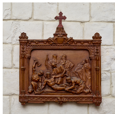
Exemple d'une station du chemin de croix.