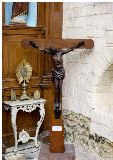
Christ en croix, ancien calvaire de Petit-Laviers. IVR32_20258000065NUCA