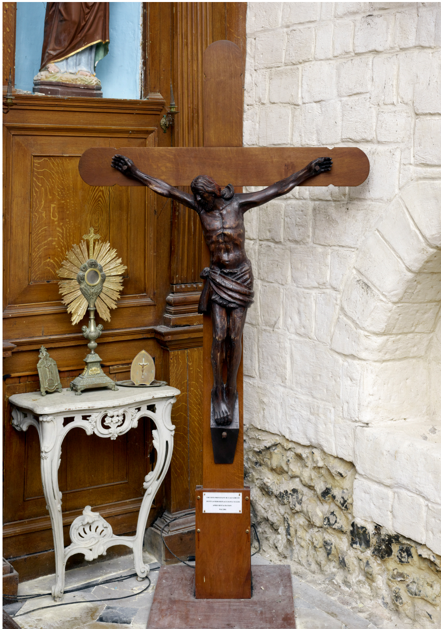
Christ en croix, ancien calvaire de Petit-Laviers.