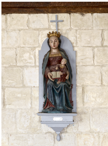
Statue, Vierge à l'Enfant. IVR32_20258000088NUCA