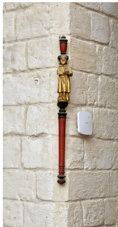
Bâton de chantre. IVR32_20258000080NUCA