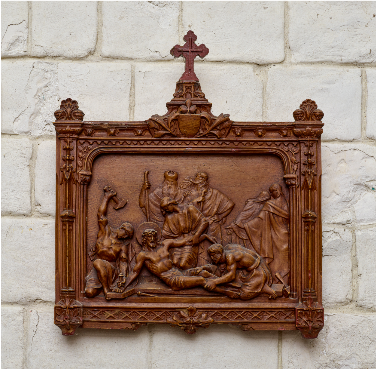
Exemple d'une station du chemin de croix.