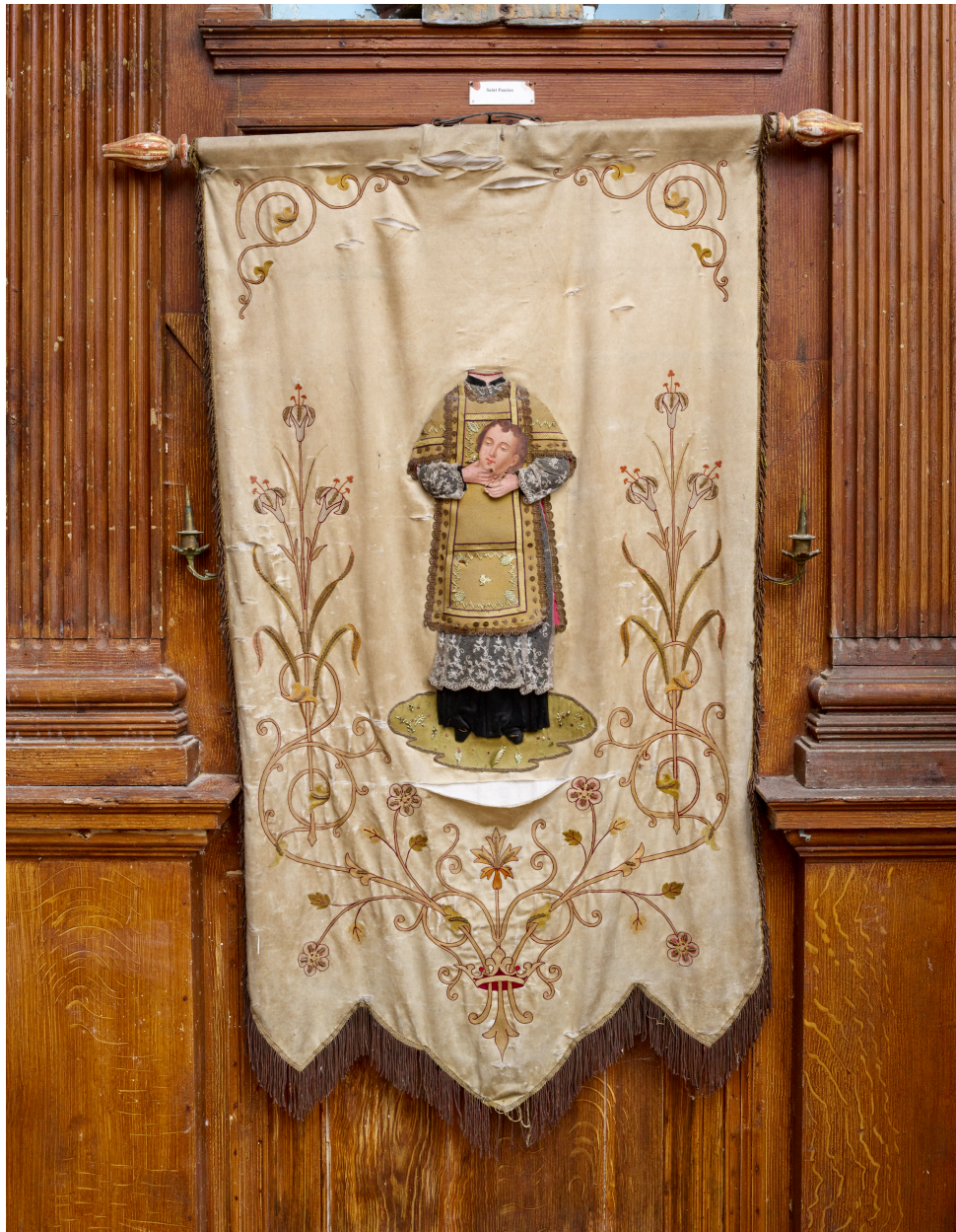
Bannière, saint Fuscien.