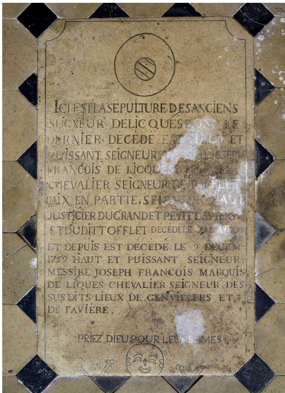
Dalle funéraire, ancien seigneur de Grand-Laviers.