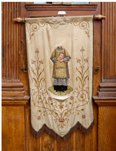
Bannière, saint Fuscien. IVR32_20258000062NUCA