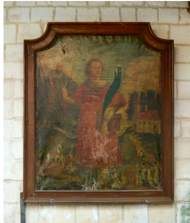
Tableau, saint Nazaire. IVR32_20258000092NUCA