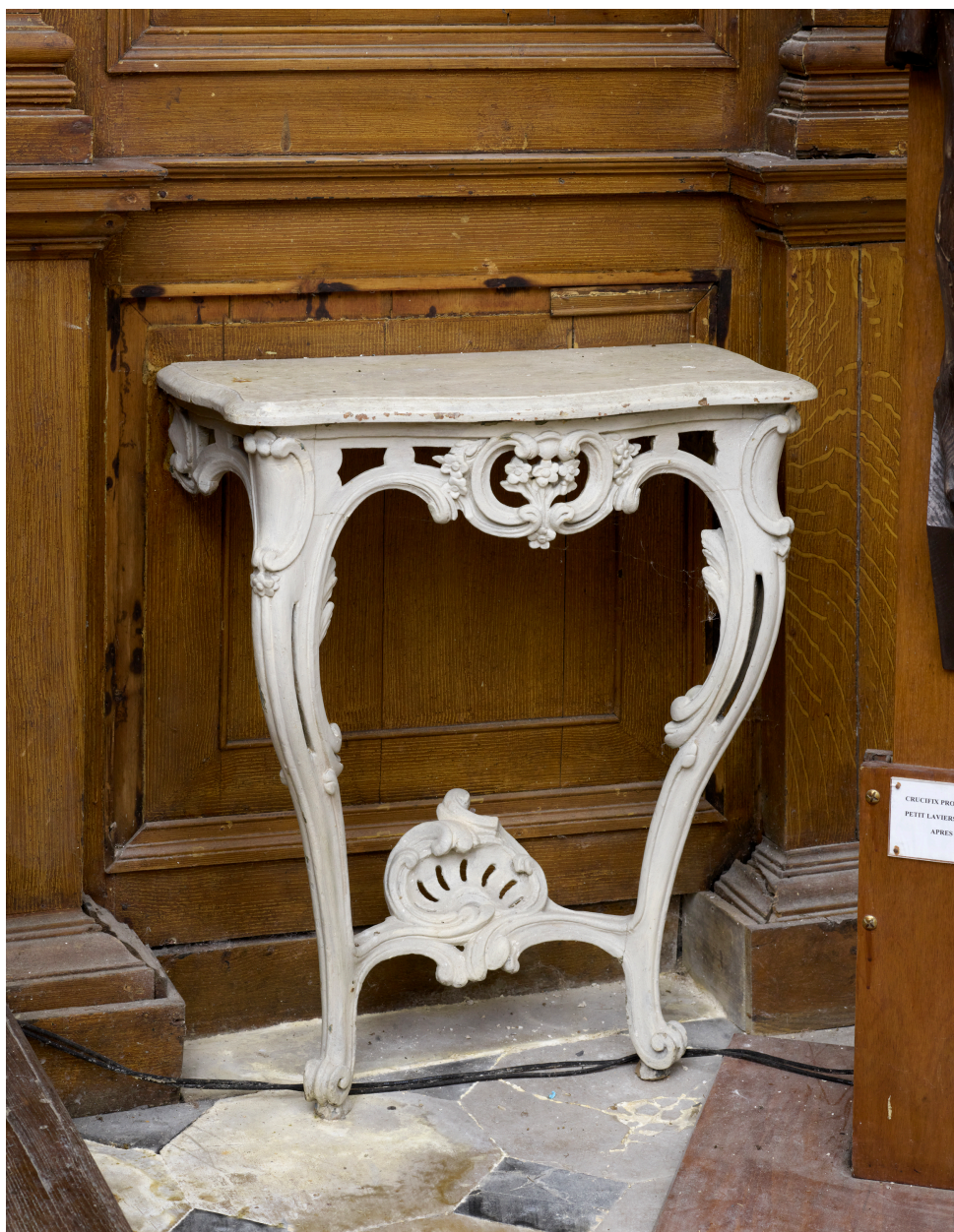
Console, style rocaille.