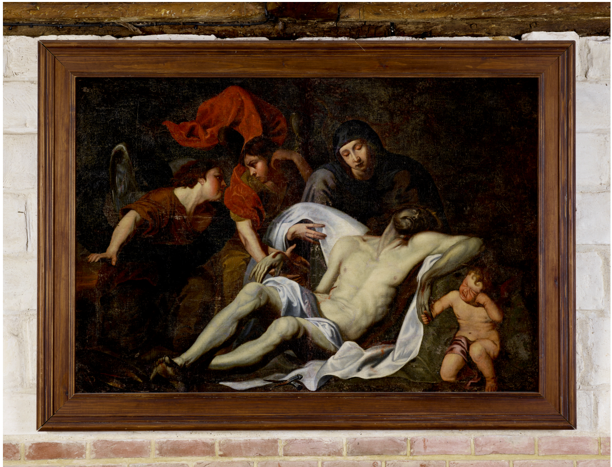
Tableau, la Lamentation du Christ.