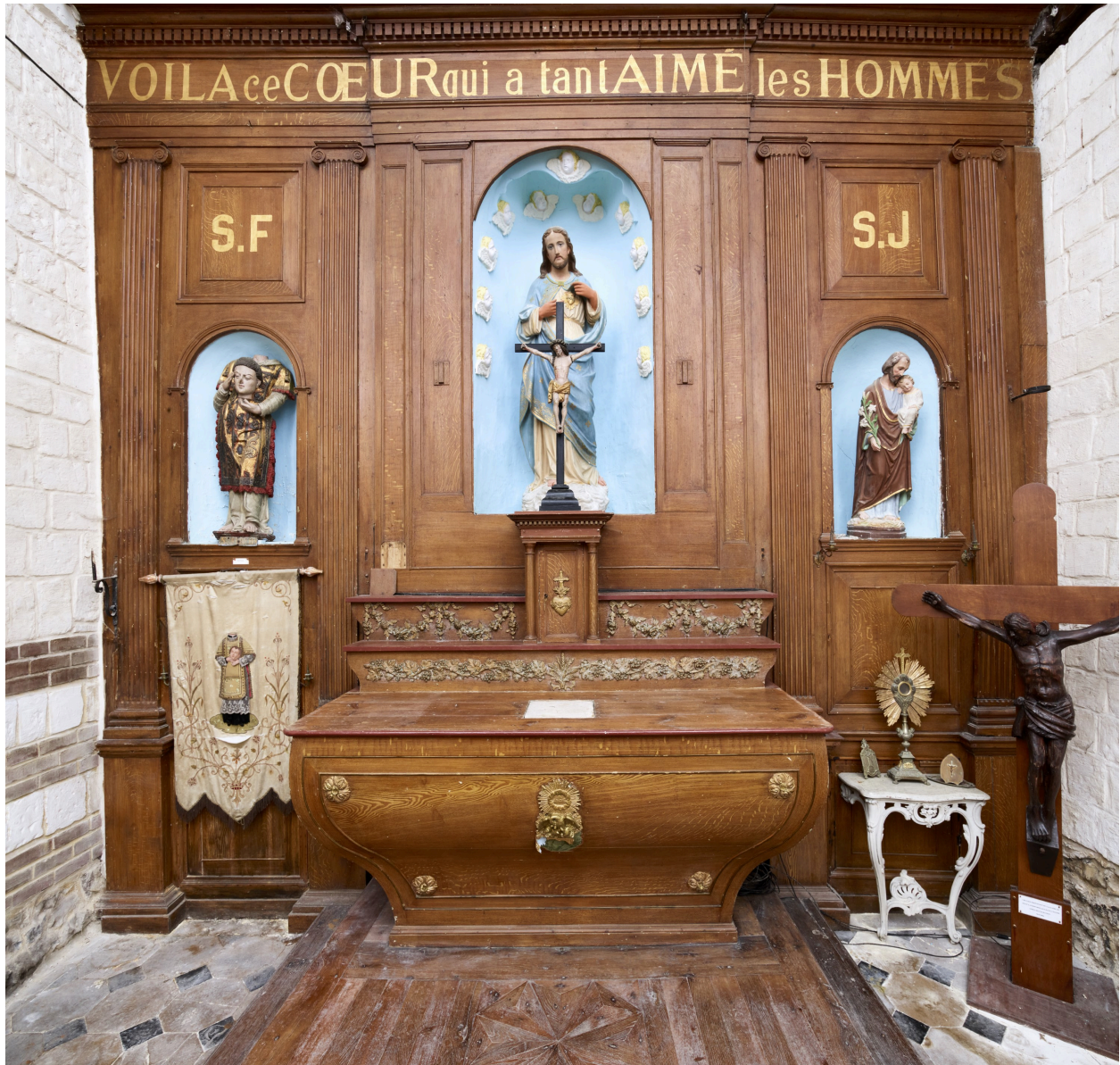
Maître-autel et retable.