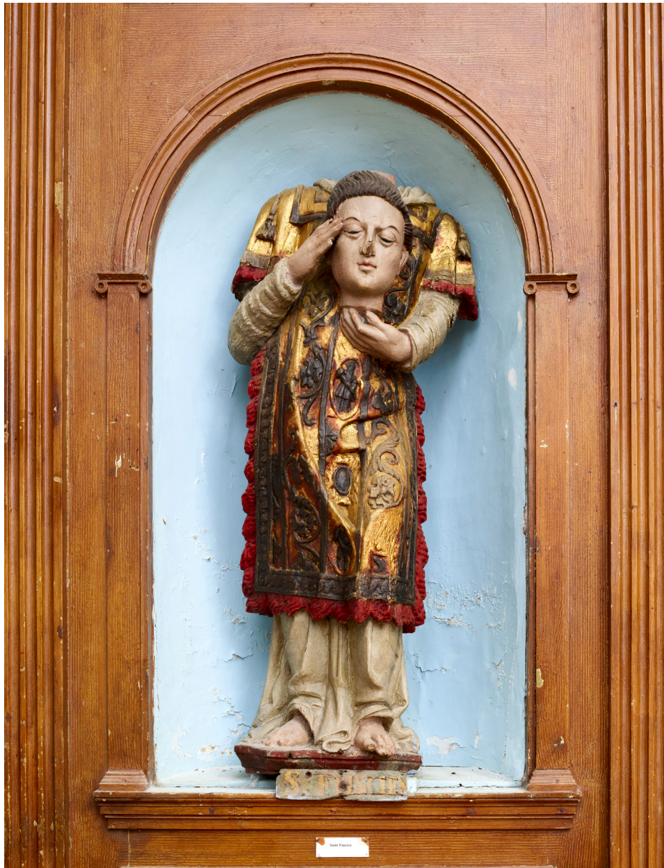
Statue, saint Fuscien.