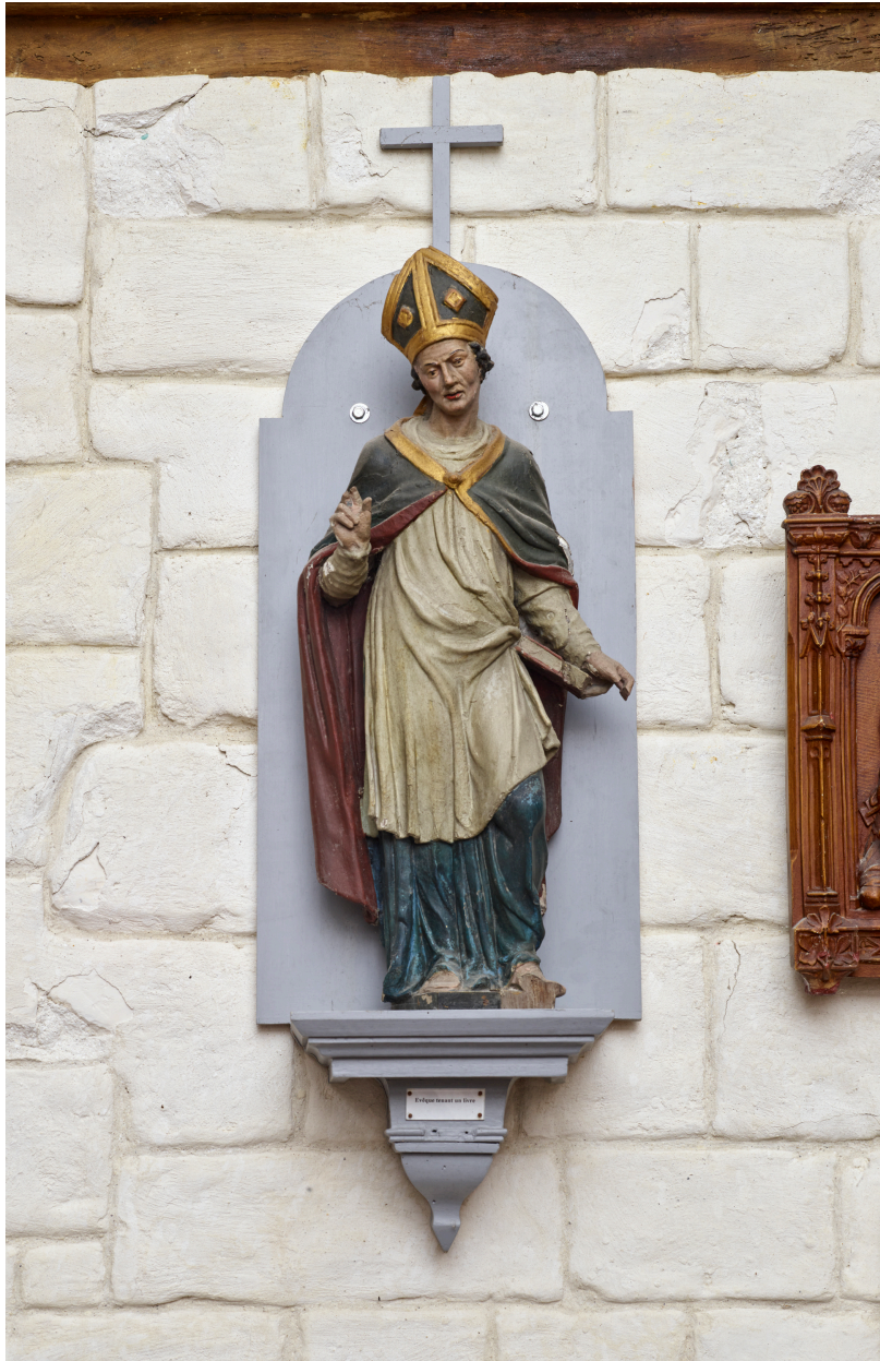
Statue, évêque ou abbé tenant un livre.