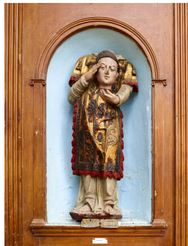
Statue, saint Fuscien.