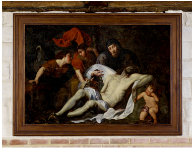
Tableau, la Lamentation du Christ. IVR32_20258000091NUCA