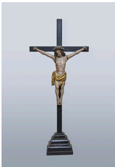
Statuette, Christ en croix. IVR32_20258000068NUCA