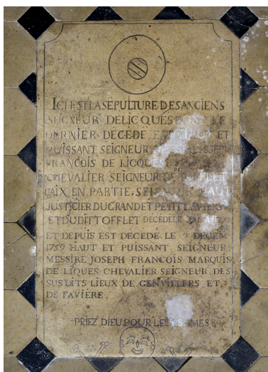
Dalle funéraire, ancien seigneur de Grand-Laviers. IVR32_20258000071NUCA