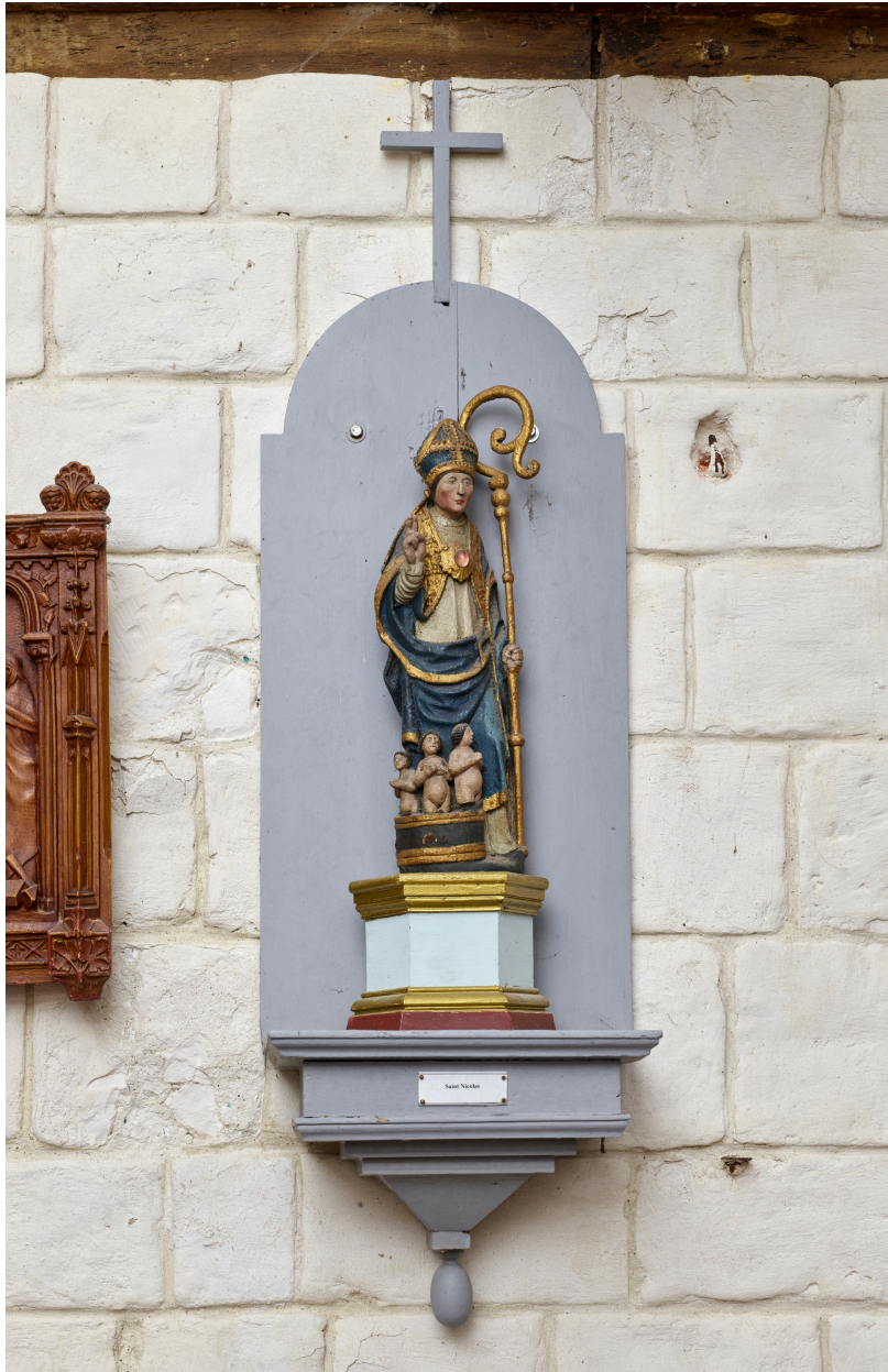
Statue, saint Nicolas.