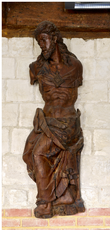
Statue, le Christ assis ?