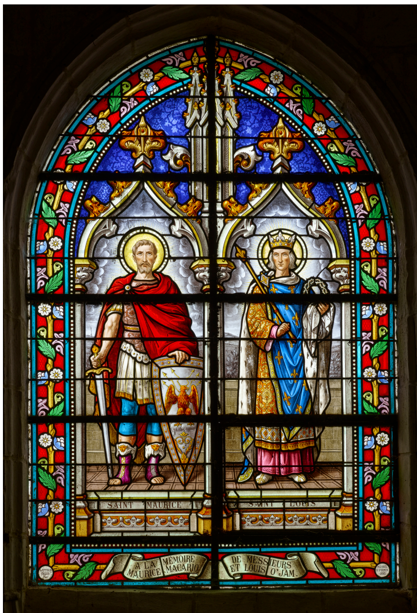
Verrière du chœur, saint Maurice et saint Louis.