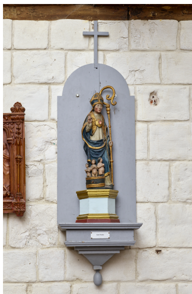
Statue, saint Nicolas. IVR32_20258000096NUCA