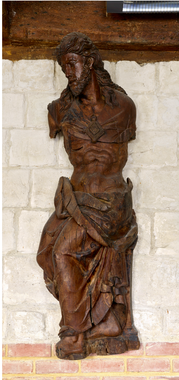
Statue, le Christ assis ?