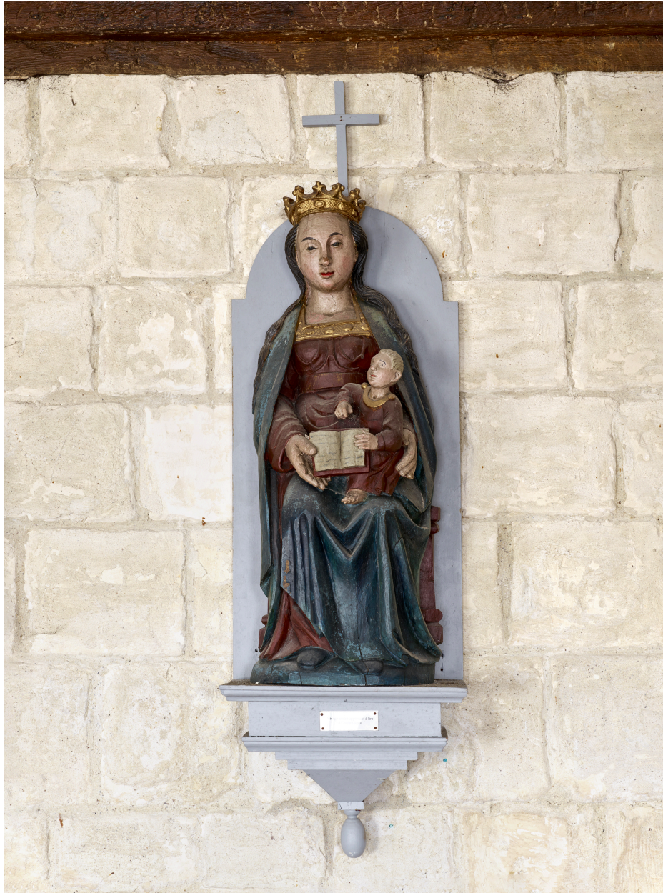
Statue, Vierge à l'Enfant.