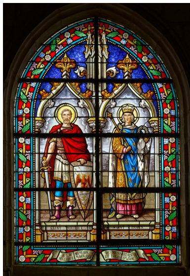
Verrière du chœur, saint Maurice et saint Louis.