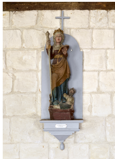
Statue, sainte Catherine. IVR32_20258000089NUCA