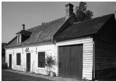
Elévation antérieure.