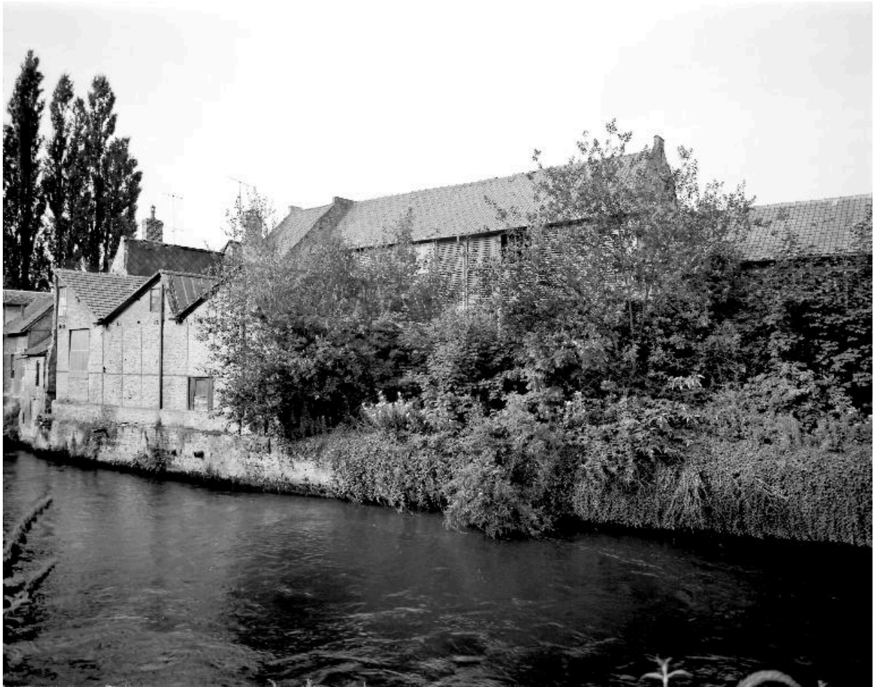
Vue générale, flanc est.