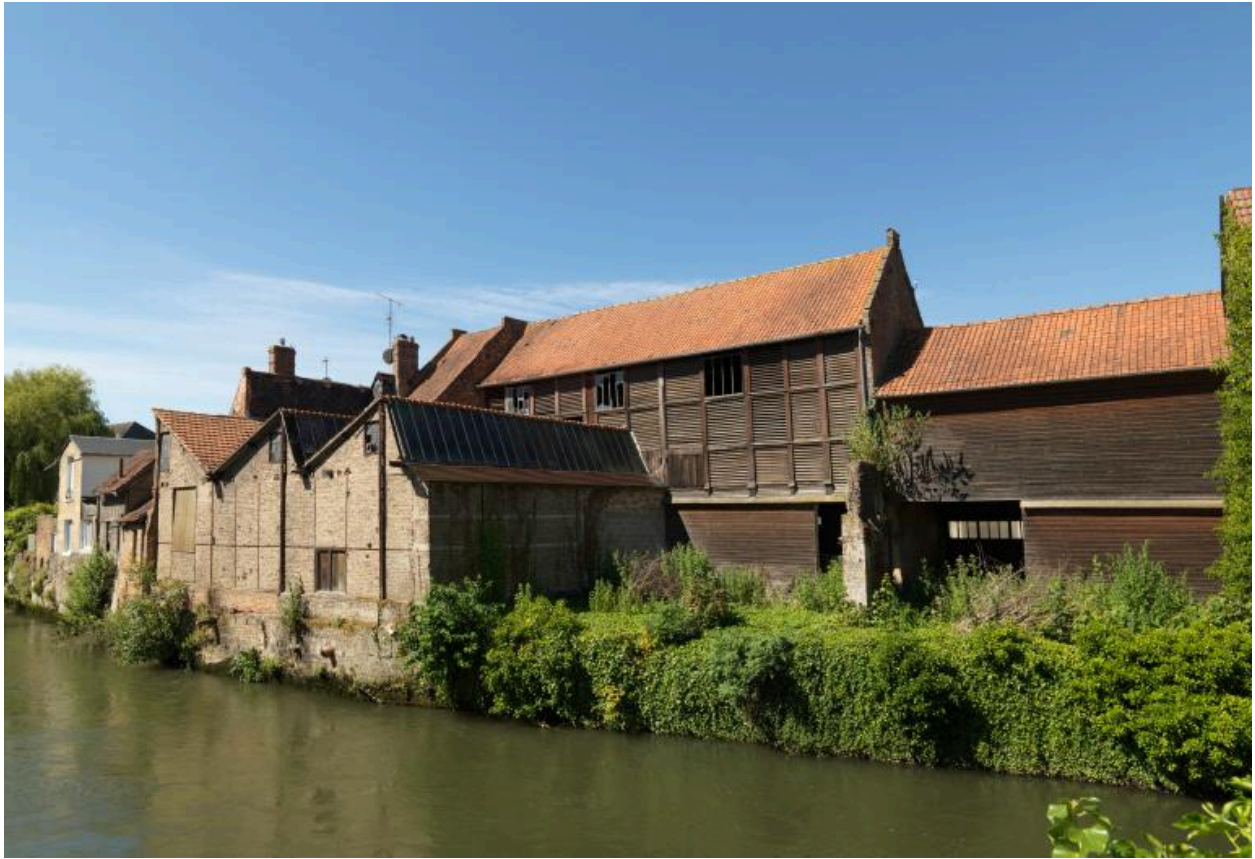
Vue générale depuis la rive droite de la Somme.