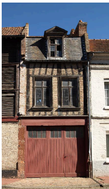
Façade du bâtiment abritant des magasins au sud. IVR22_20168000561NUC2A