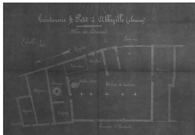
Plan de la teinturerie Petit, vers 1901 (AD Somme).