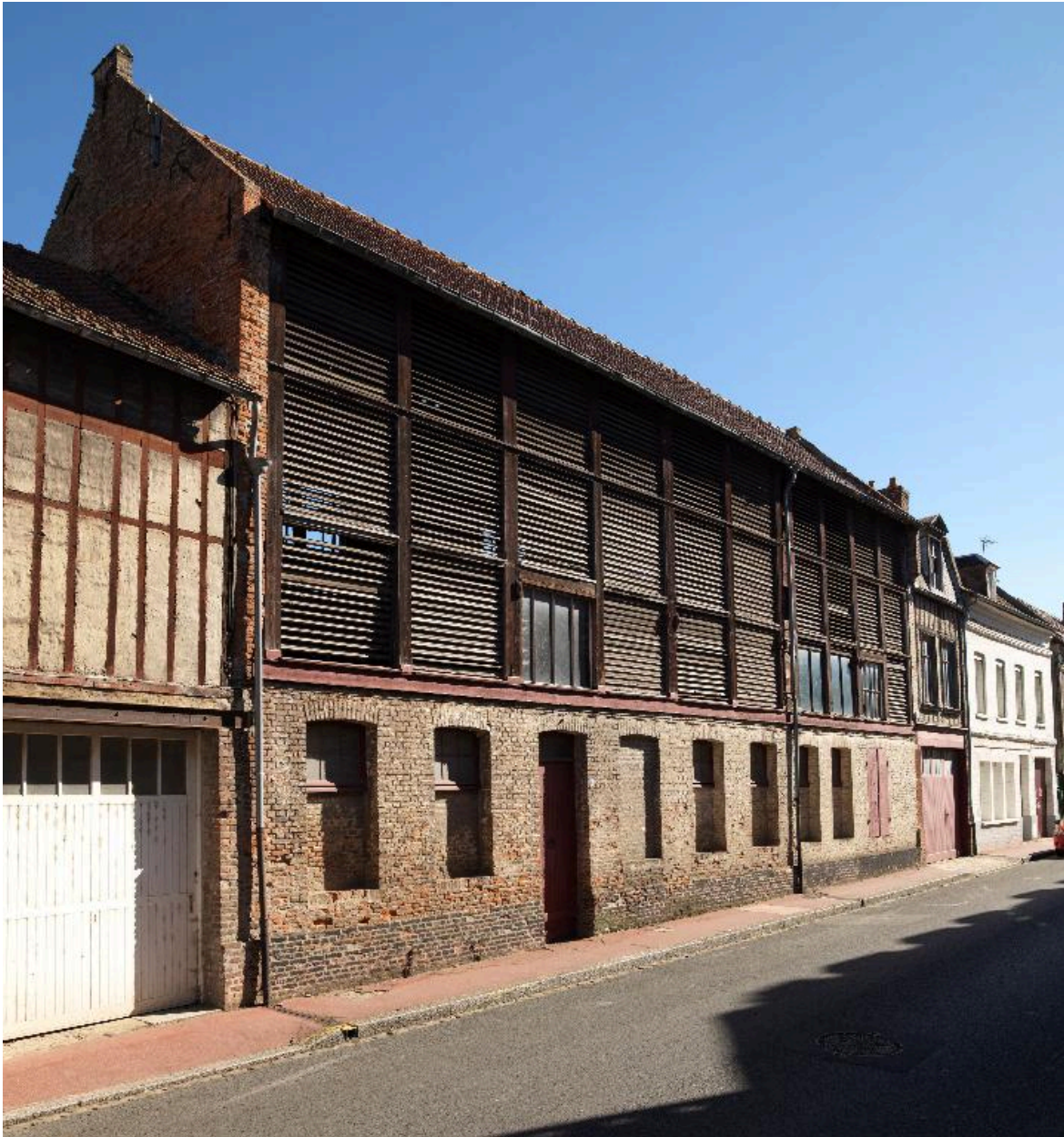
Façades donnant sur la chaussée d'Hoquet.