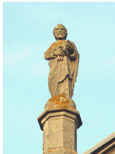
Saint Pierre : vue d'ensemble de face IVR31_20106202639NUCA