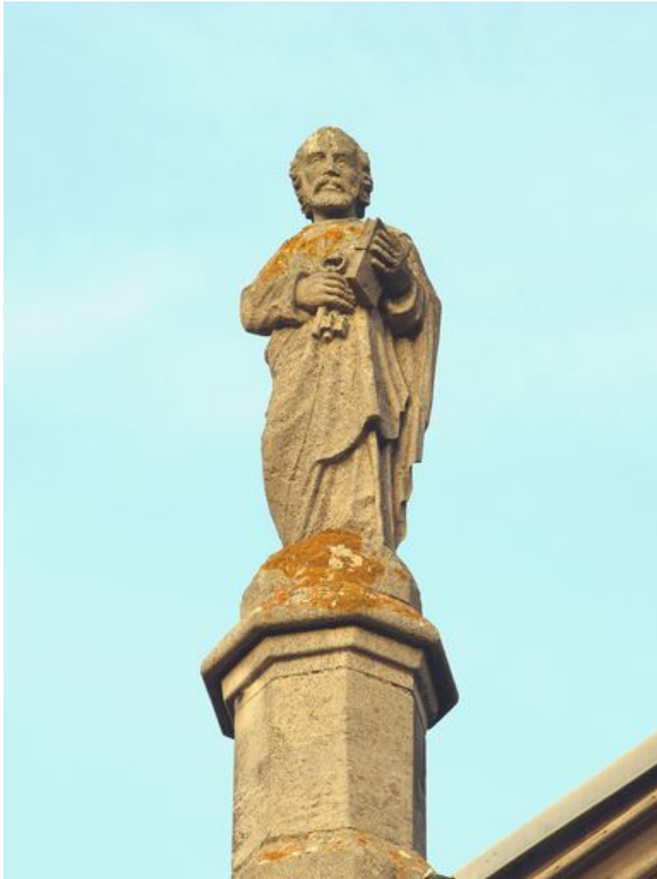
Saint Pierre : vue d'ensemble de face