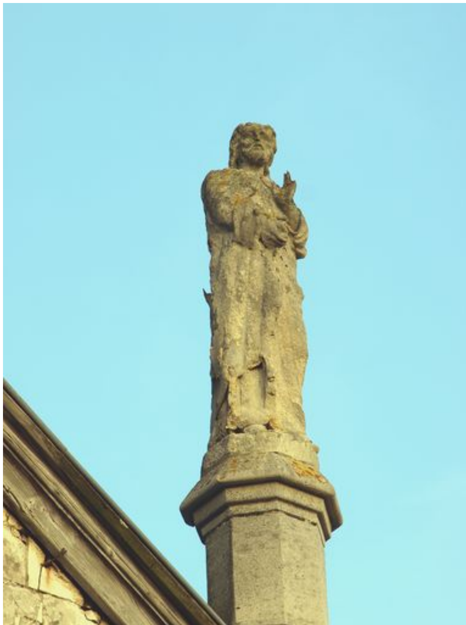
Saint Paul : vue d'ensemble de trois-quart