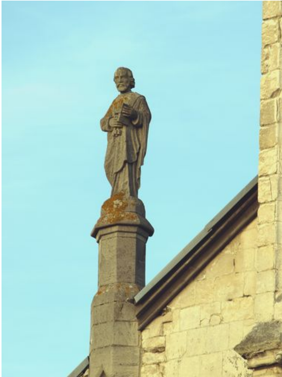
Saint Pierre : vue d'ensemble de trois-quarts