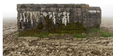
Elévation nord-est IVR31_20145905456NUCA