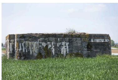
Elévation nord-est IVR31_20145905460NUCA