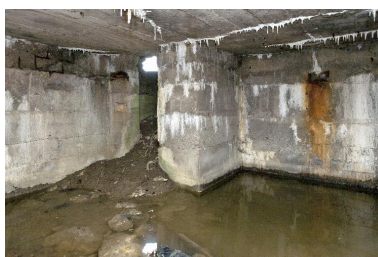
Vue intérieure. A gauche l'accès au poste d'observation.