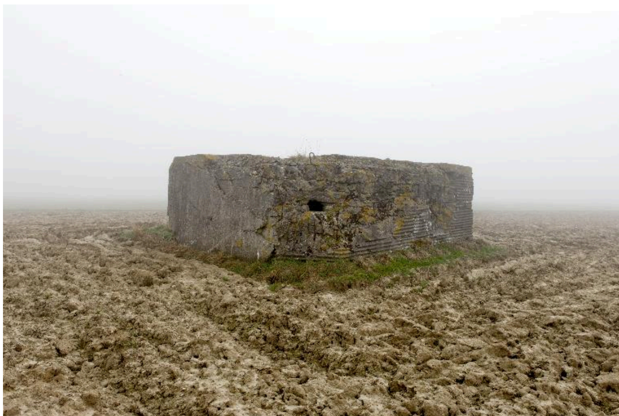
Vue de trois-quarts vers le nord-est