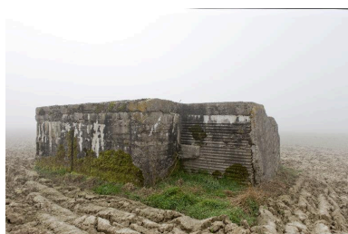
Vue de trois-quarts vers le sud-est