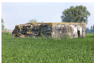
Vue de trois-quarts vers le nord IVR31_20145905461NUCA