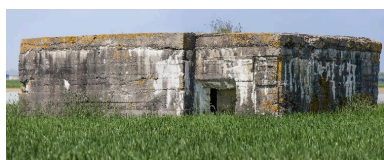
Vue de trois-quarts vers l'ouest IVR31_20145905459NUCA