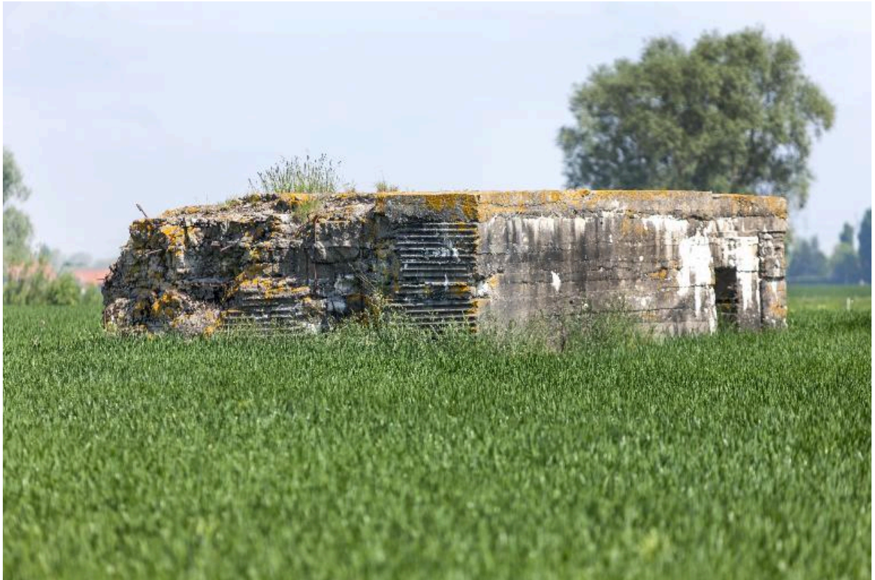
Vue de trois-quarts vers le nord