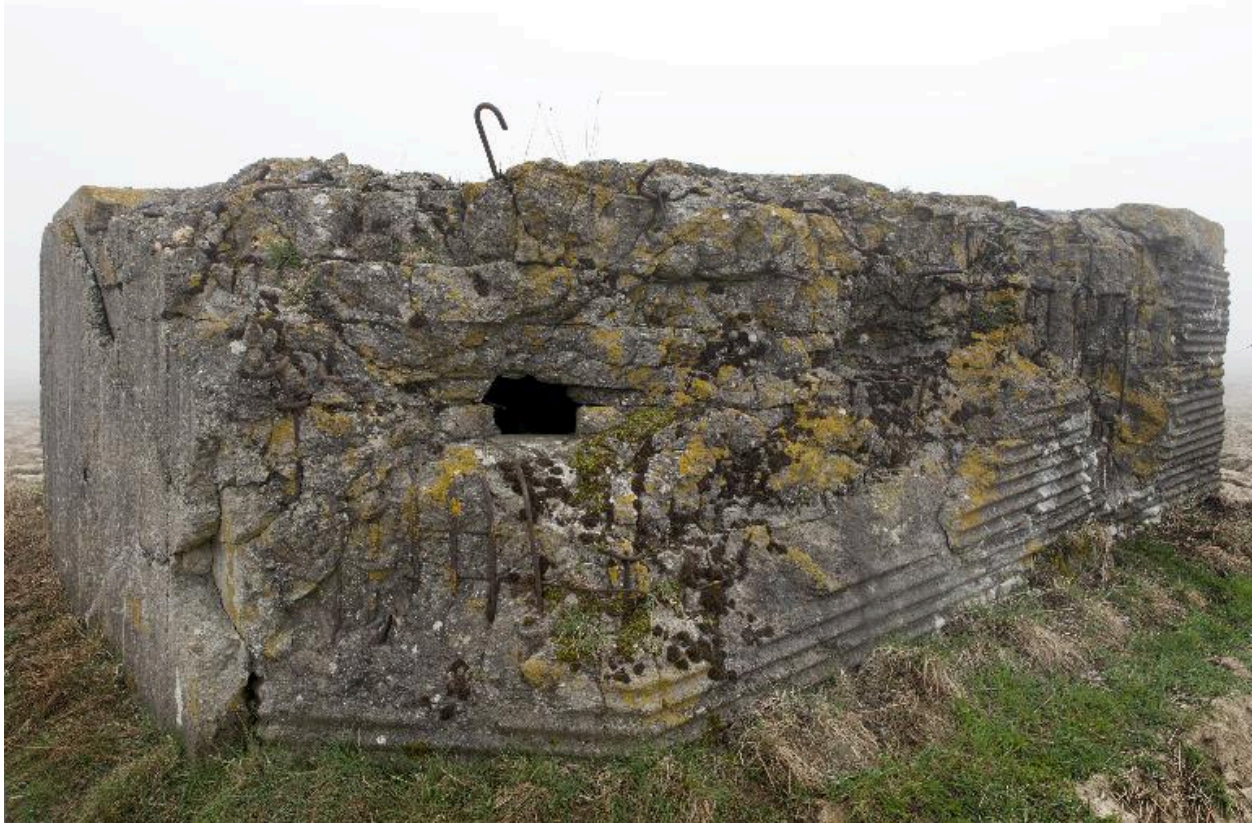
Poste d'observation, vers le nord-est