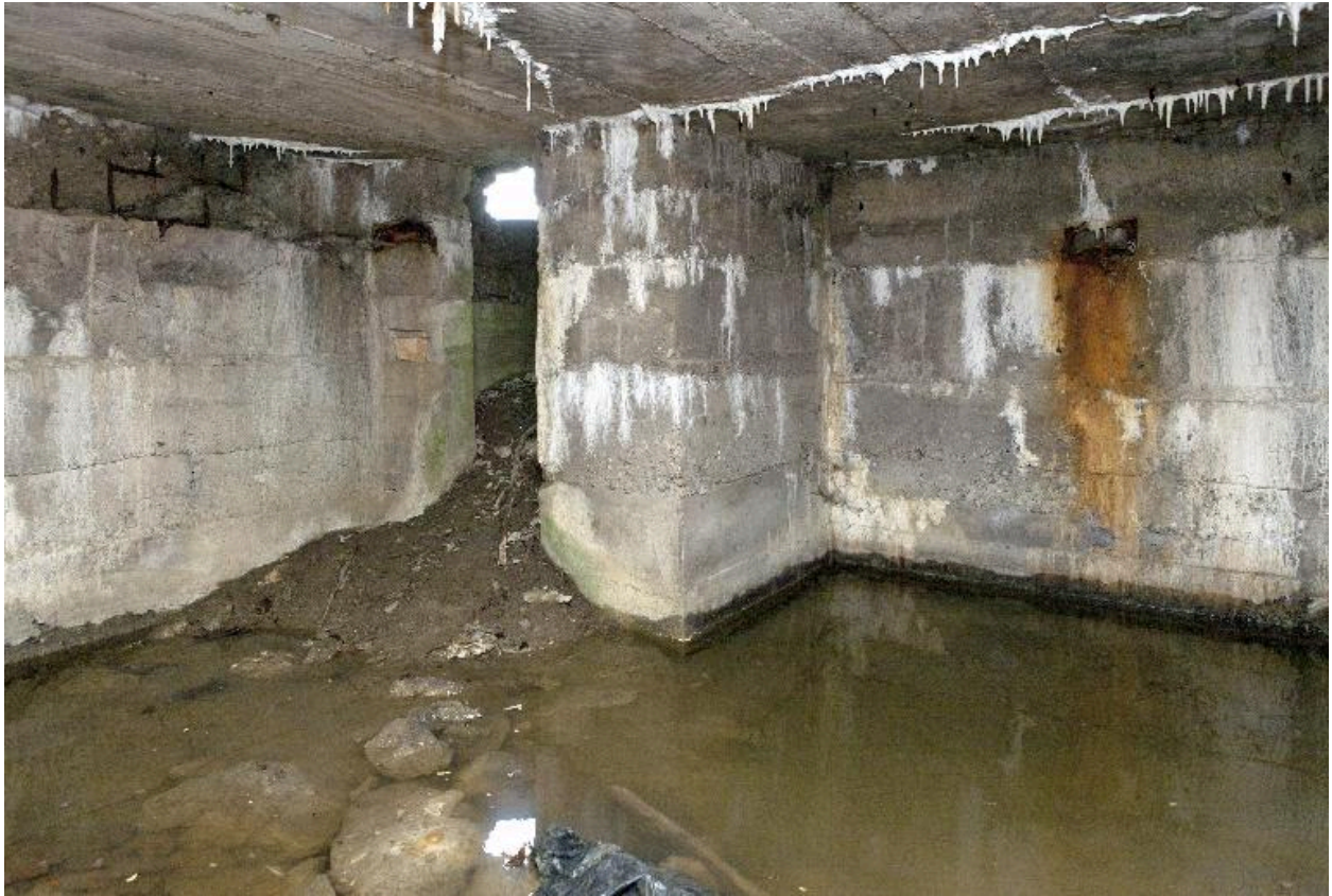
Vue intérieure. A gauche l'accès au poste d'observation.