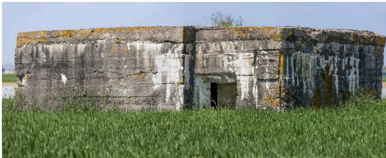
Vue de trois-quarts vers l'ouest