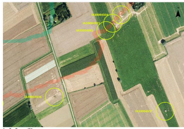
Situation de l'édifice (en bas à gauche) sur une photographie aérienne de 2015. Ont été rappelées, en rouge, la première ligne allemande, en vert la première ligne britannique. IVR32_20175900910NUCA