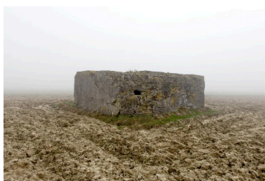
Vue de trois-quarts vers le nord-est