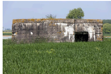
Entrée sur l'élévation nord-est IVR31_20145905457NUCA