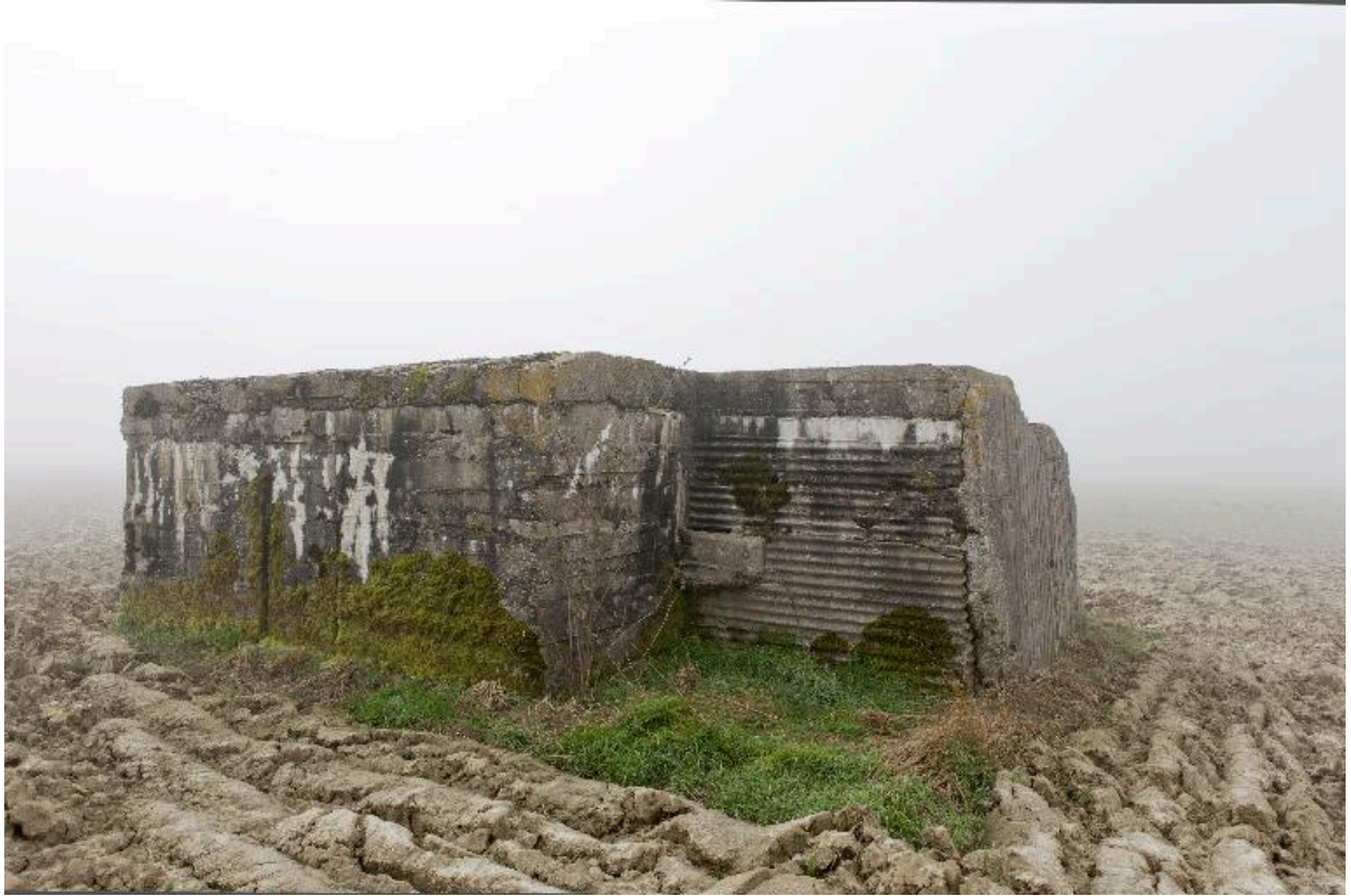
Vue de trois-quarts versle sud-est