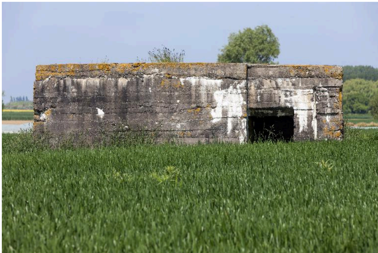
Entrée sur l'élévation nord-est