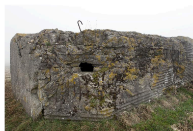
Poste d'observation, vers le nord-est IVR31_20145905462NUCA