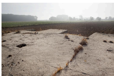
Depuis le toit de l'abri, vers le sud-est. IVR31_20145904083NUCA