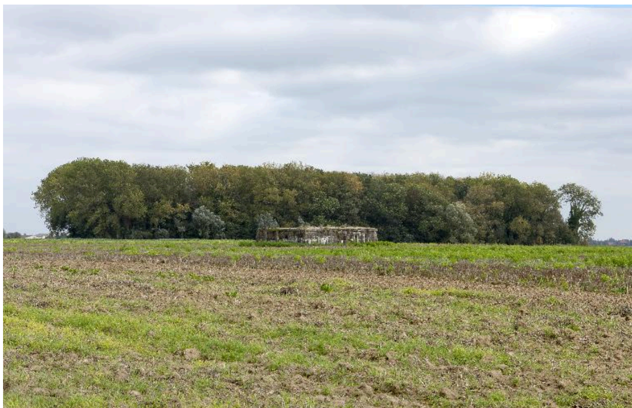
Vue générale vers le sud-est