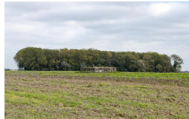
Vue générale vers le sud-est IVR31_20145904085NUCA