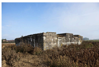
Elévation sud IVR31_20145904081NUCA