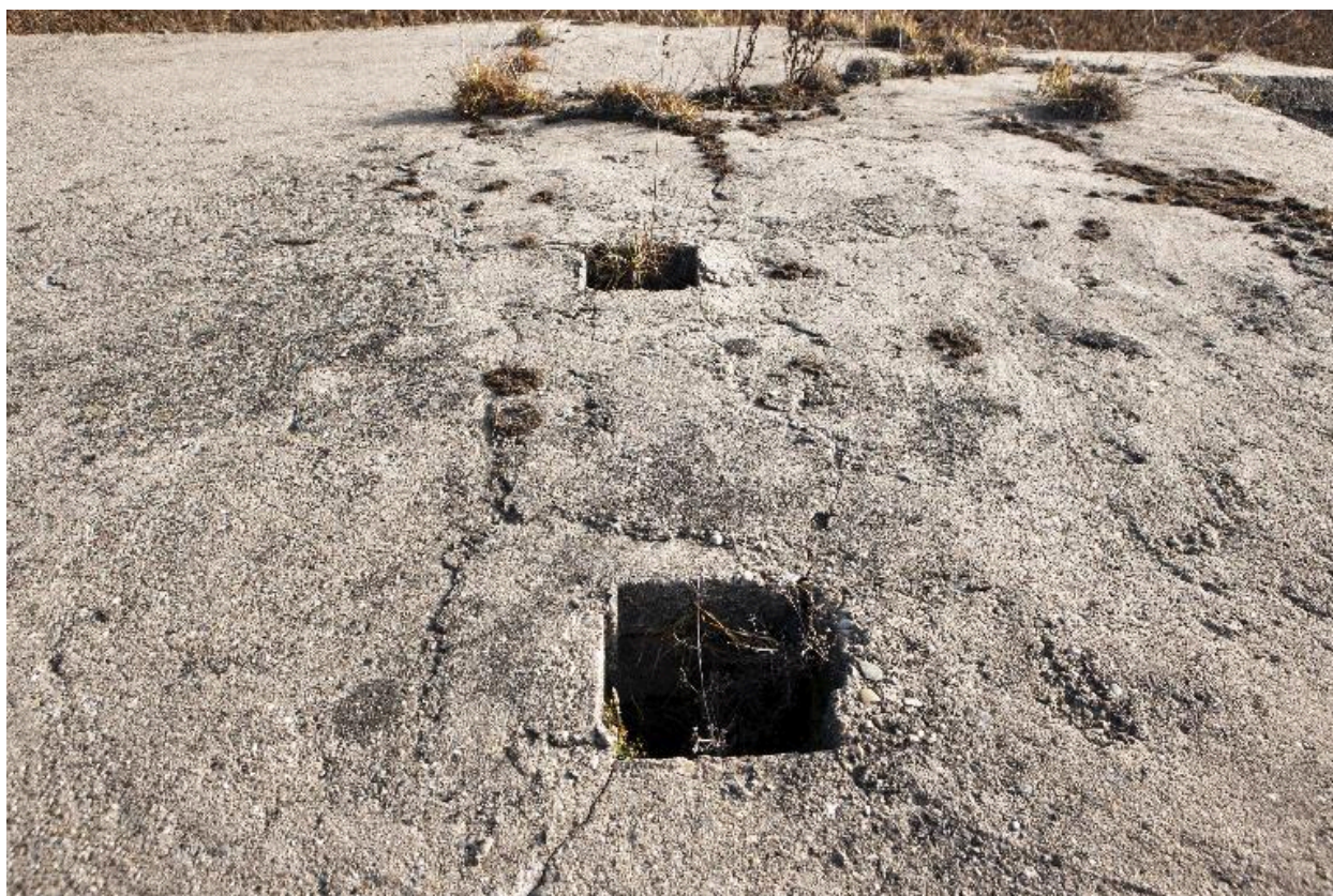
Toit de l'édifice. Les deux cheminée à périscope