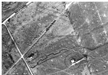
Situation de l'édifice sur une photographie aérienne du 16/02/1918.