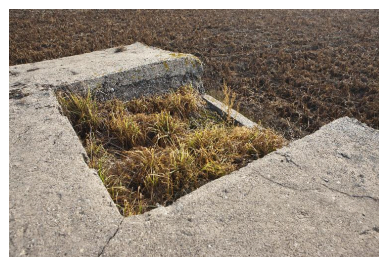
Un des deux emplacements pour armes IVR31_20145904082NUCA