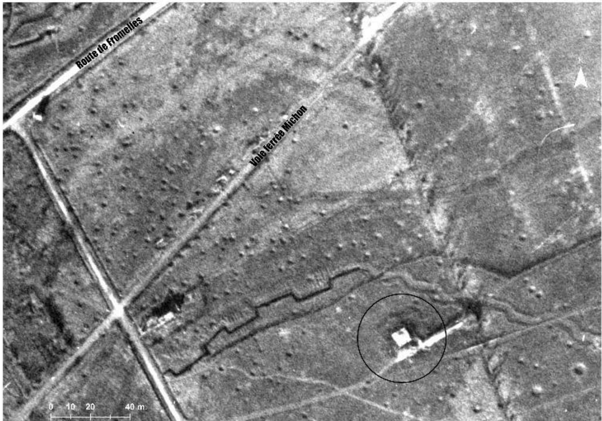
Situation de l'édifice sur une photographie aérienne du 16/02/1918.