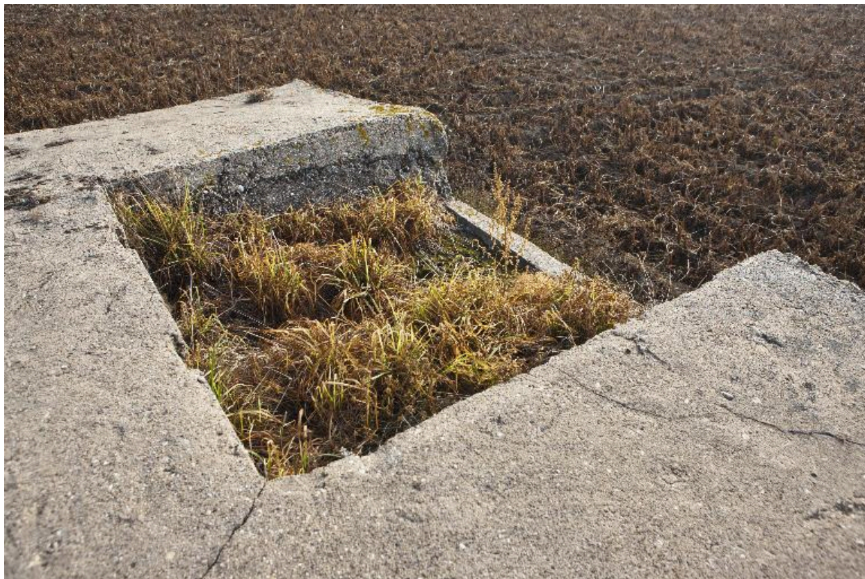
Un des deux emplacements pour armes