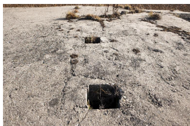
Toit de l'édifice. Les deux cheminée à périscopes IVR31_20145904084NUCA