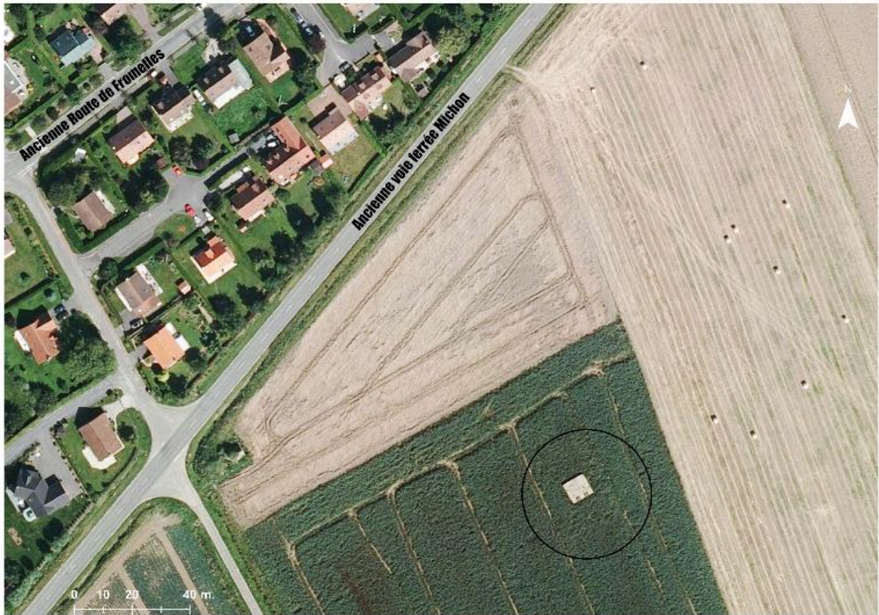
Situation de l'édifice sur une photographie aérienne de 2014