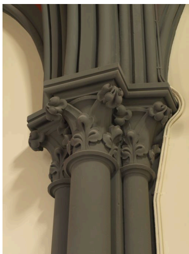
Chapelle, intérieur : chapiteau IVR31_20106208354NUCA