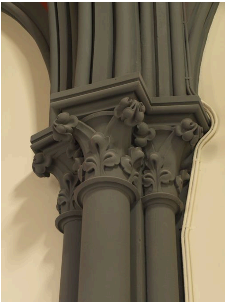
Chapelle, intérieur : chapiteau