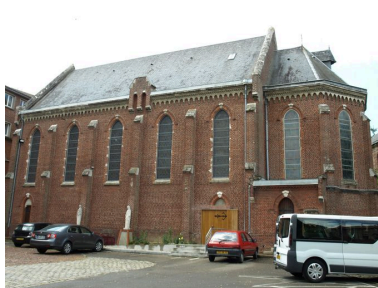
Chapelle : vue générale