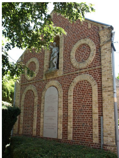
Bâtiment à l'entrée IVR31_20106208350NUCA