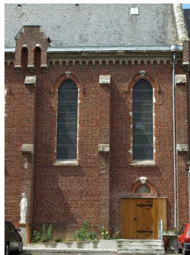
Chapelle : vue de détail IVR31_20106208352NUCA