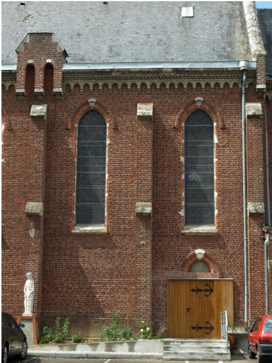
Chapelle : vue de détail