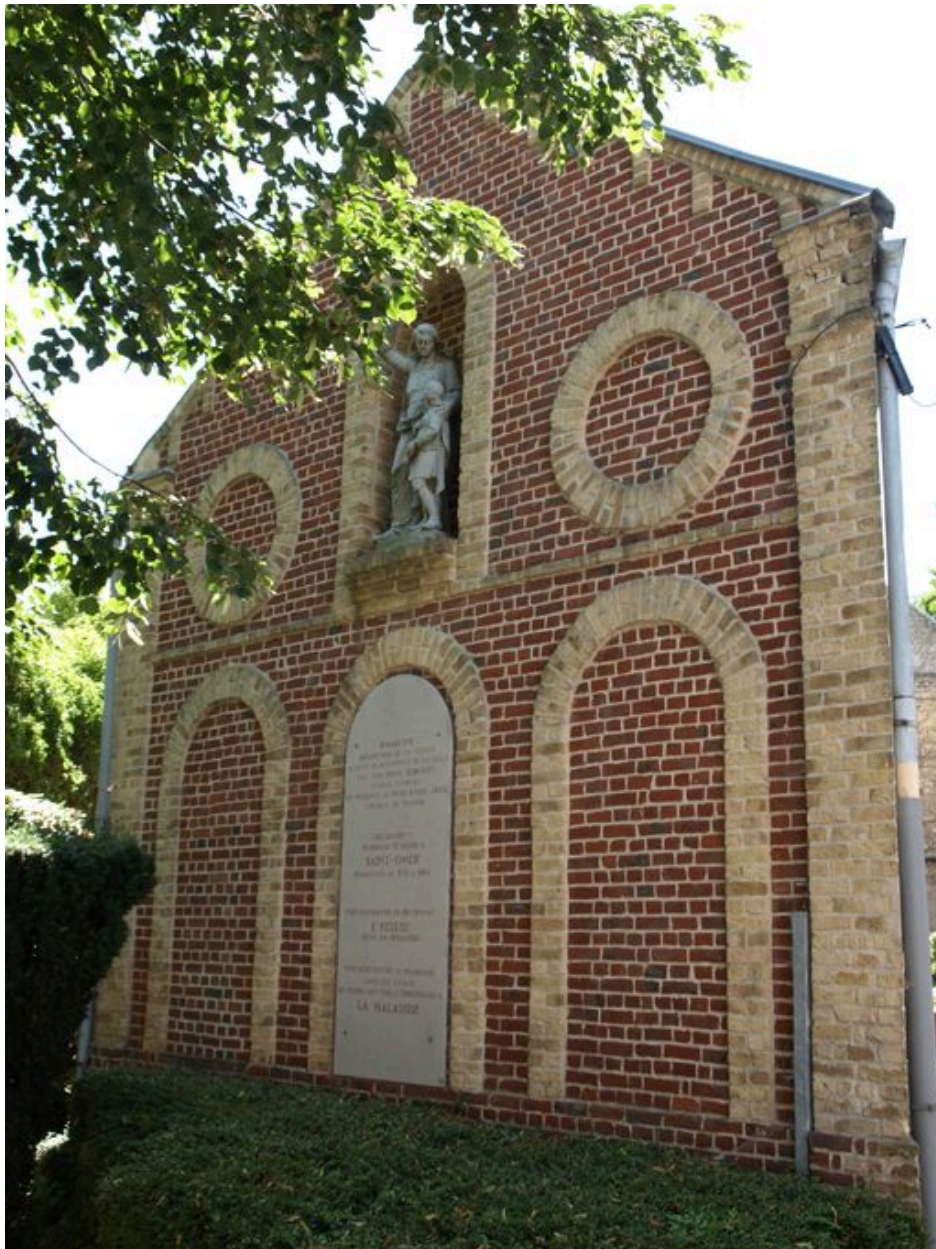
Bâtiment à l'entrée