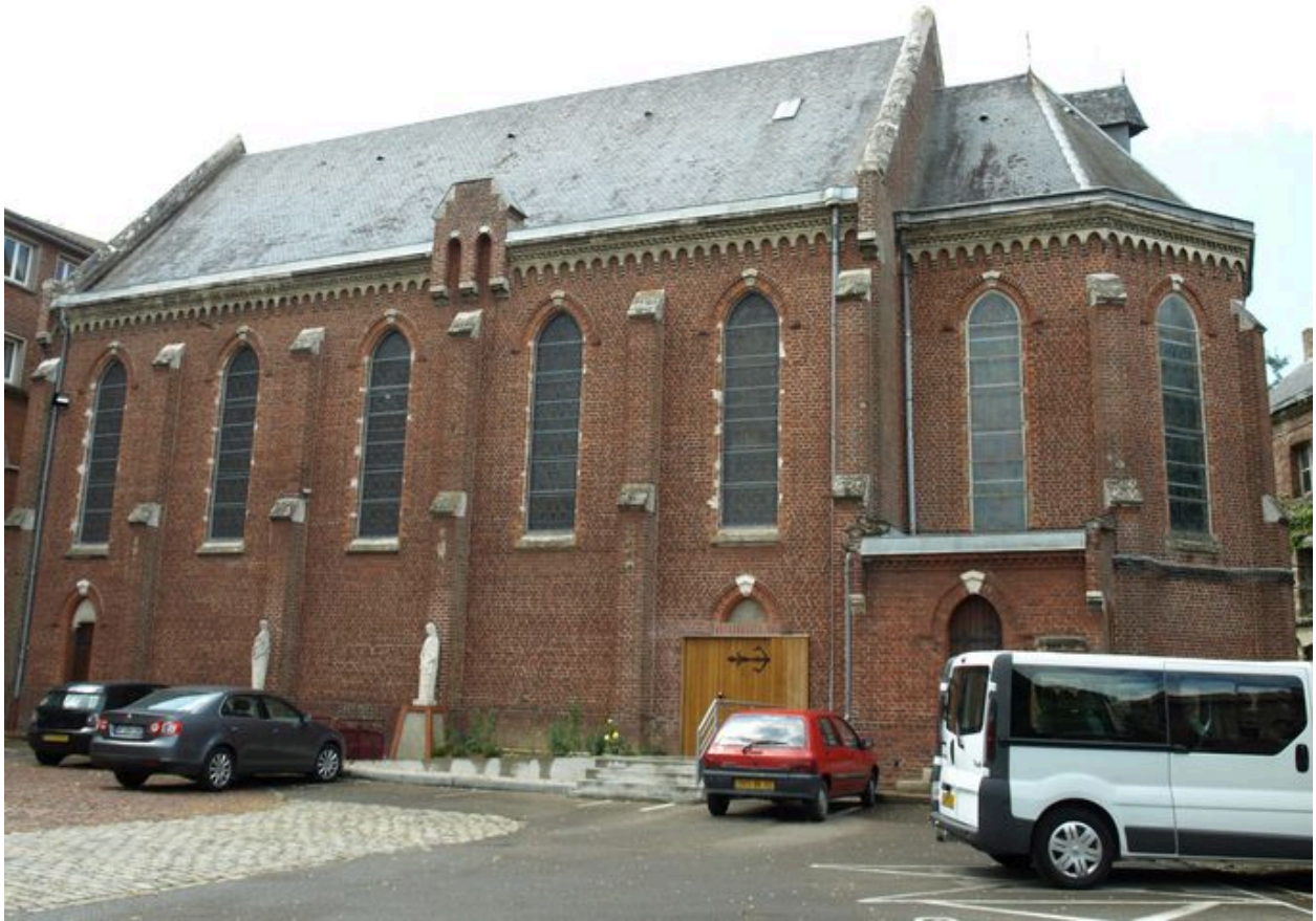
Chapelle : vue générale