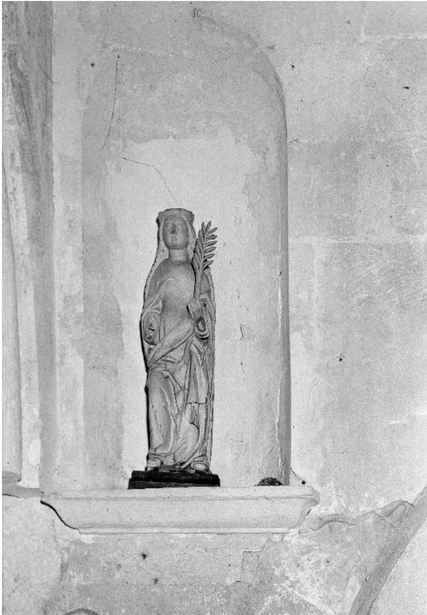
La statue, vue de face.