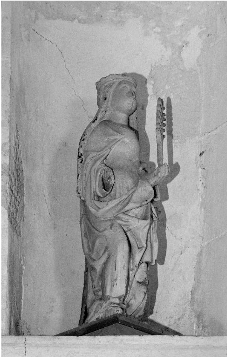
La statue, vue de trois-quarts.