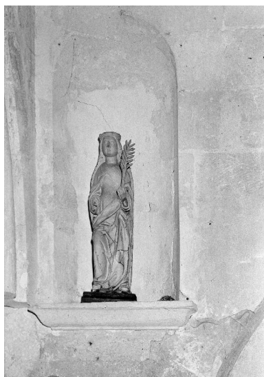
La statue, vue de face.