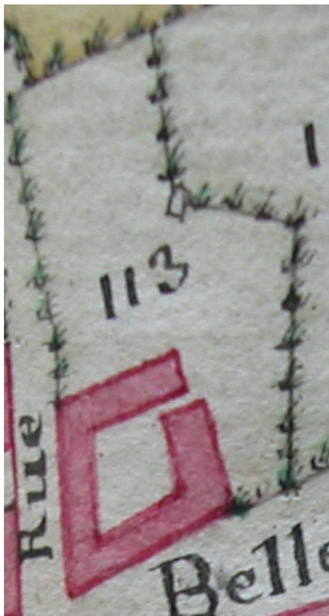
Détail de l'atlas terrier, première carte, 4e quart du 18e siècle (AD Somme ; 3G 79).