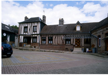
Logis et logement.

IVR22_20098005047NUCA