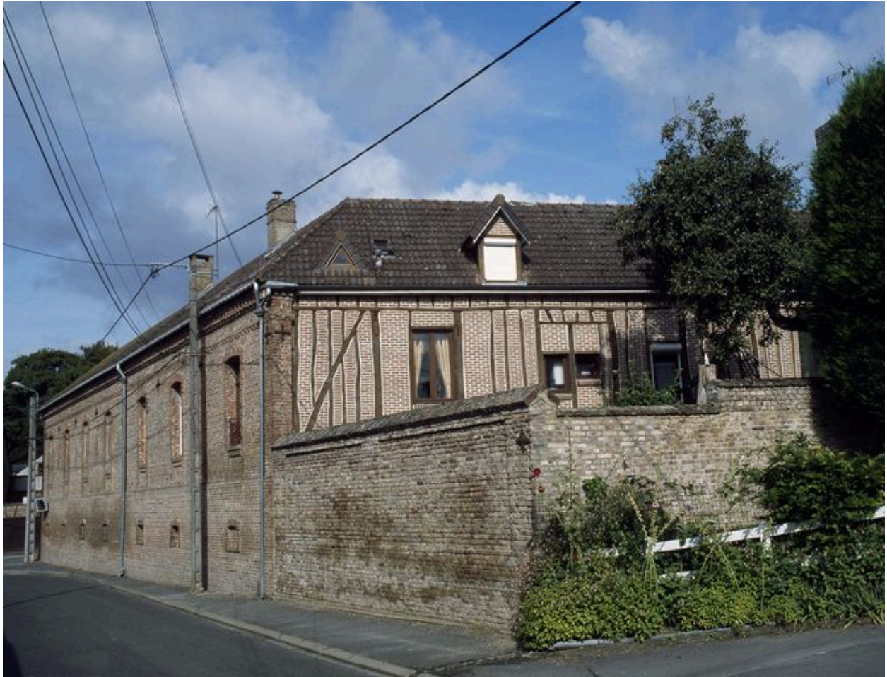
Vue arrière du logis.