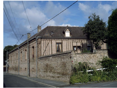
Vue arrière du logis.

Phot. Marie-Laure Monnehay-Vulliet IVR22_20098000355XA