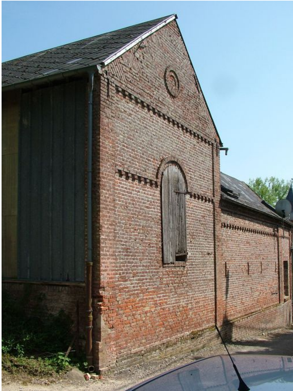
Mur-pignon de la grange.