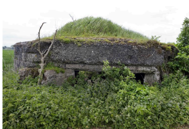
La soute à munition explosée