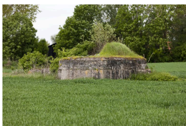
Vue latérale, vers l'ouest IVR31_20145904329NUCA