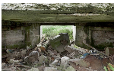
Chambre de tir, vers le front IVR31_20145904334NUCA