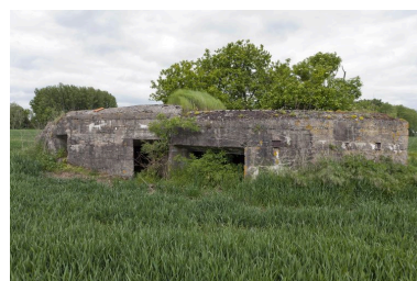
Entrées postérieures IVR31_20145904331NUCA