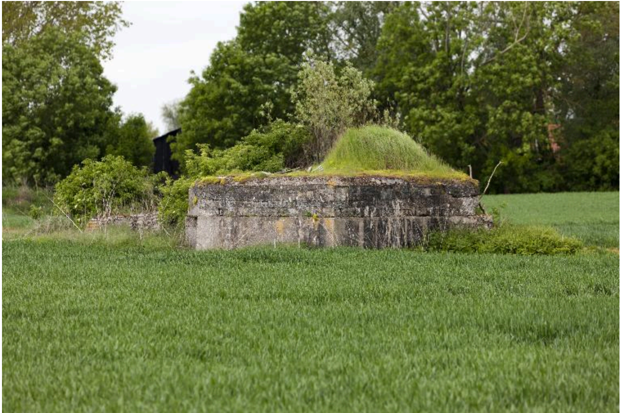
Vue latérale, vers l'ouest