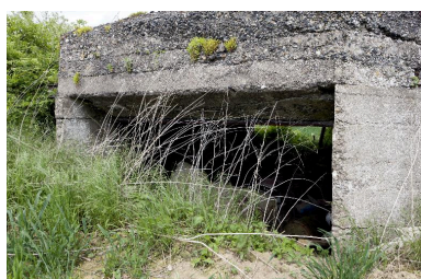
Entrée de la chambre de tir IVR31_20145904335NUCA