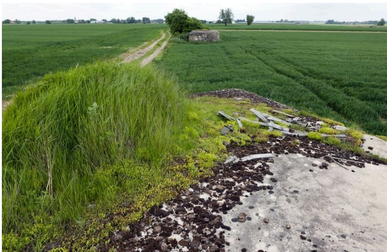
Depuis le couvrement, vue vers le blockhaus 205