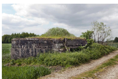
Vue latérale, vers sud-ouest