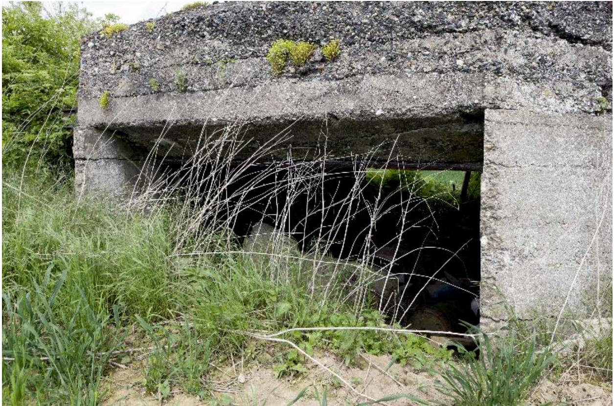
Entrée de la chambre de tir