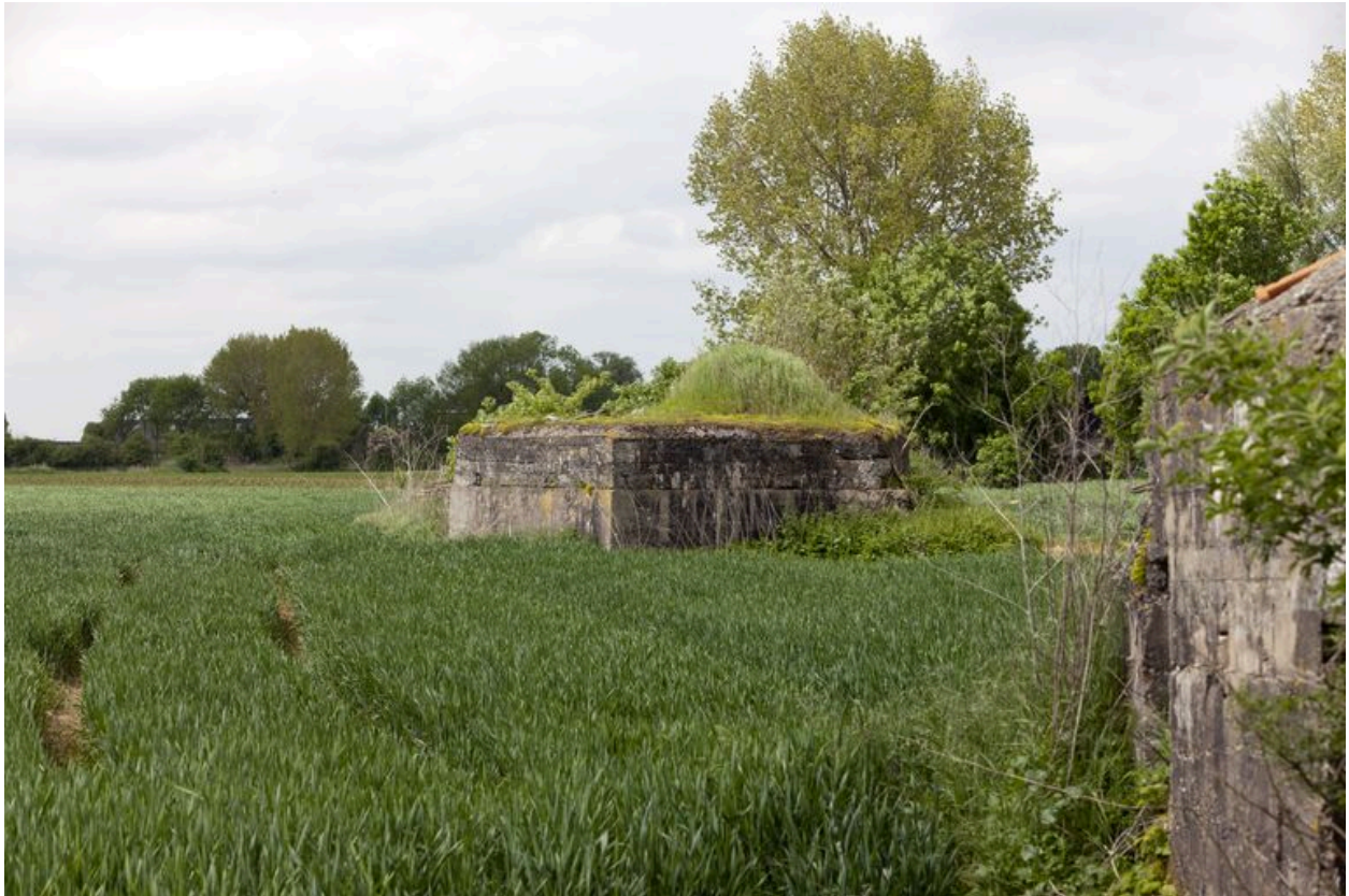
Vue latérale, vers le sud-ouest depuis le blockhaus 205