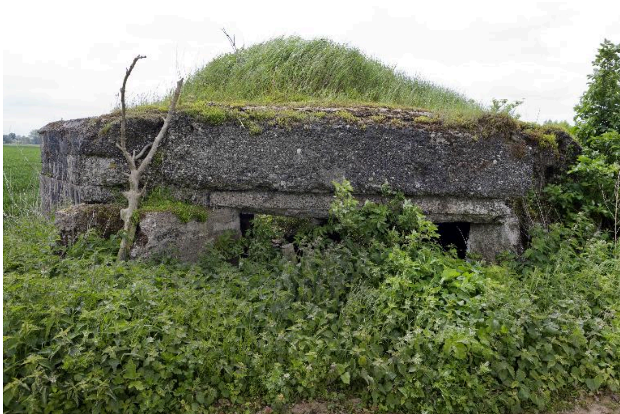
Vue vers le sud-est : sortie de chambre de tir