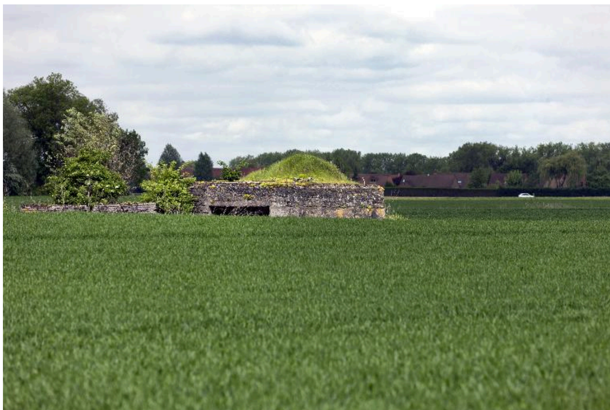
Vue vers le nord-ouest