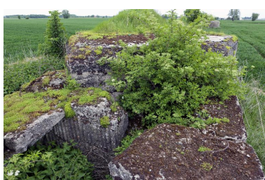
La soute à munitions explosée