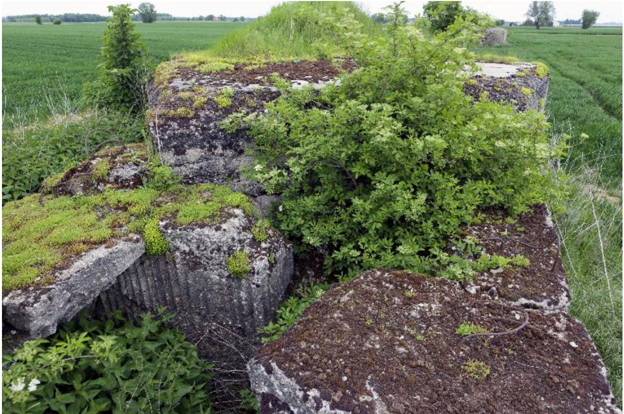
La soute à munitions explosée