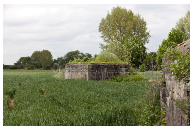
Vue latérale, vers le sud-ouest depuis le blockhaus 205 IVR31_20145904330NUCA