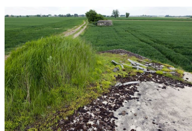
Depuis le couverture, vue vers le blockhaus 205 IVR31_20145904340NUCA