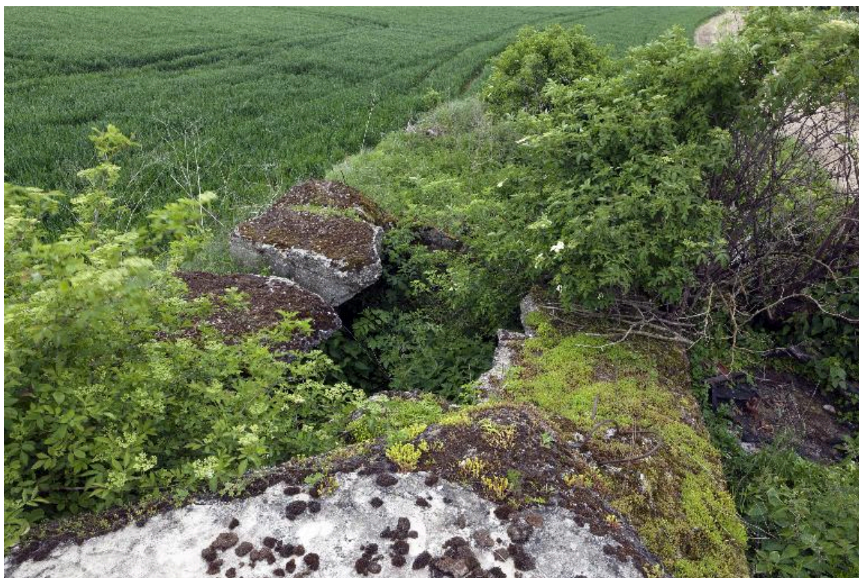
La soute à munition explosée