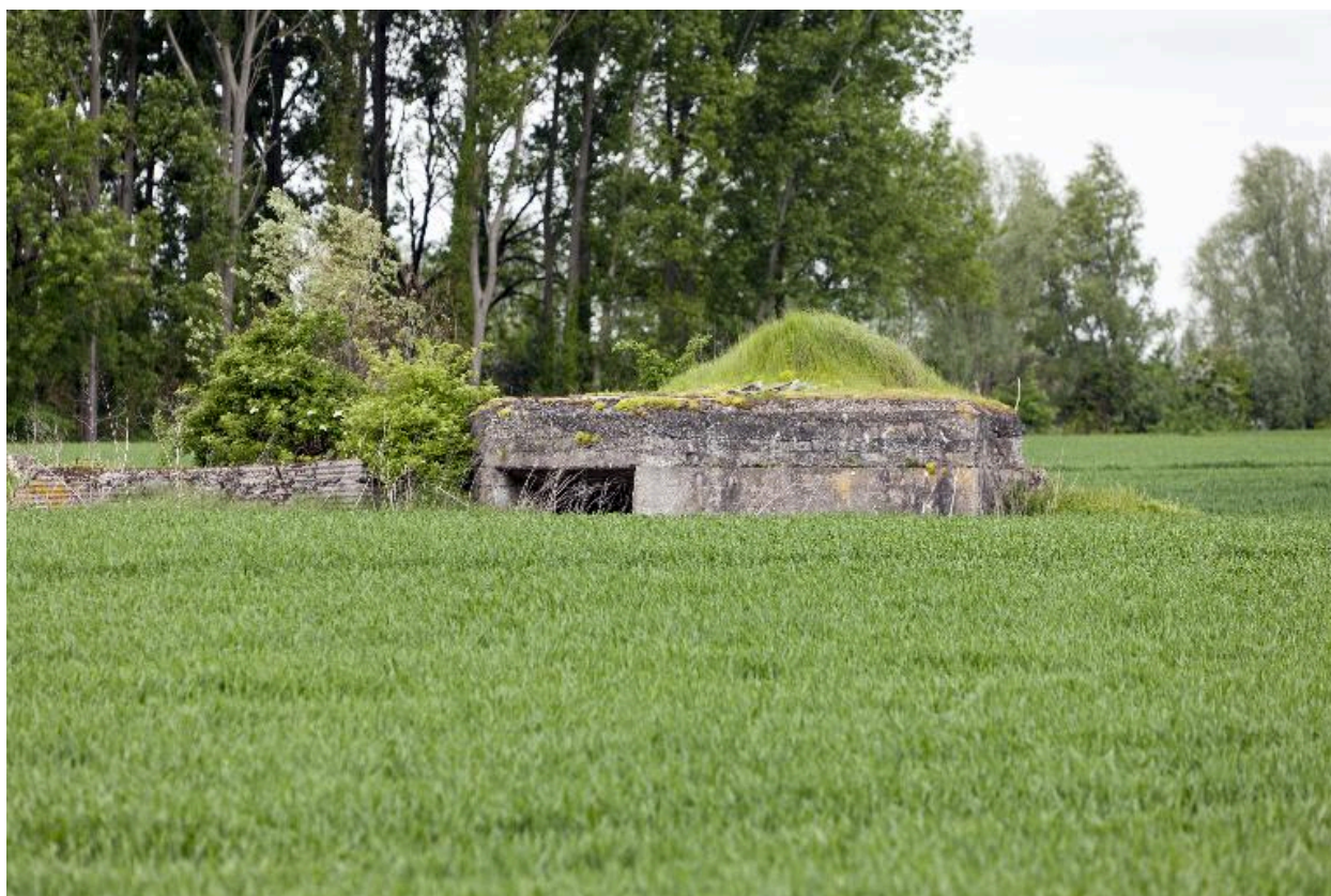
Vue générale vers le nord-ouest