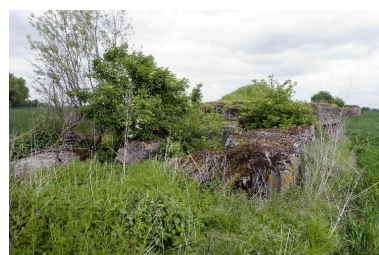
Vue latérale vers l'est. Soute à munitions IVR31_20145904336NUCA