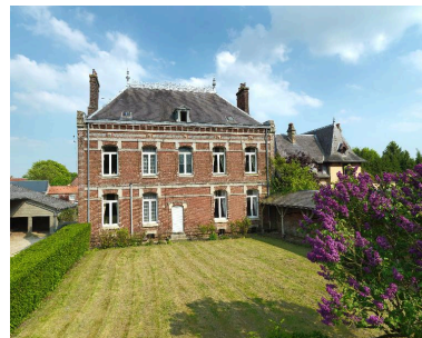
Façade postérieure, vue d'ensemble. IVR22_20138000227NUC2A