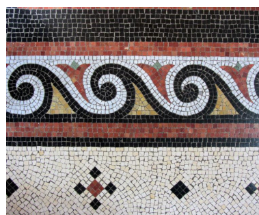
Détail du pavement du vestibule.