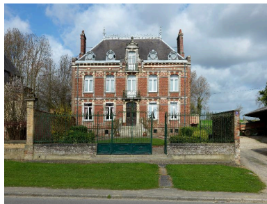
Vue d'ensemble sur rue. IVR22_20138000089NUC2A