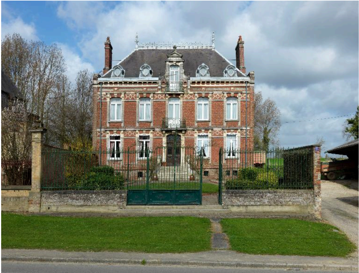
Vue d'ensemble sur rue.