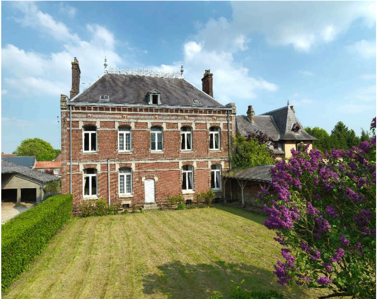
Façade postérieure, vue d'ensemble.