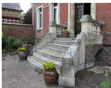
Détail de l'escalier.