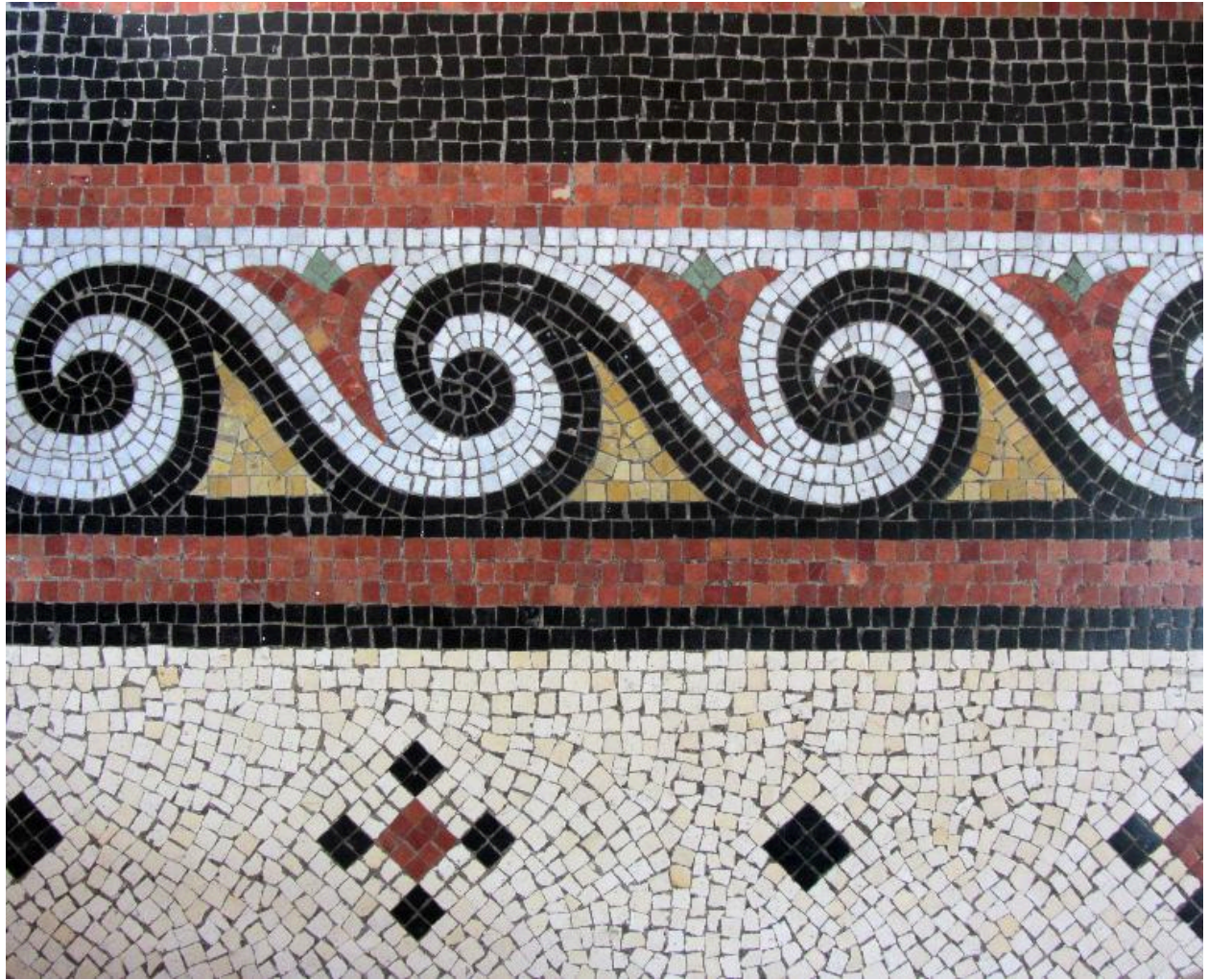
Détail du pavement du vestibule.