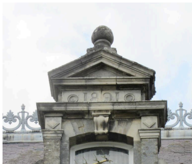
Détail du chronogramme au sommet de la lucarne.