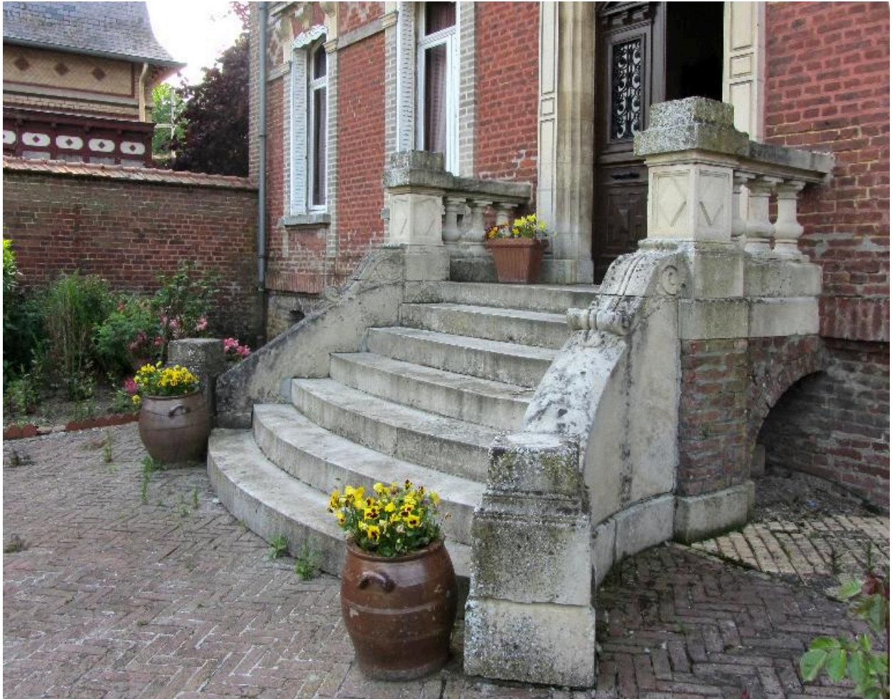
Détail de l'escalier.