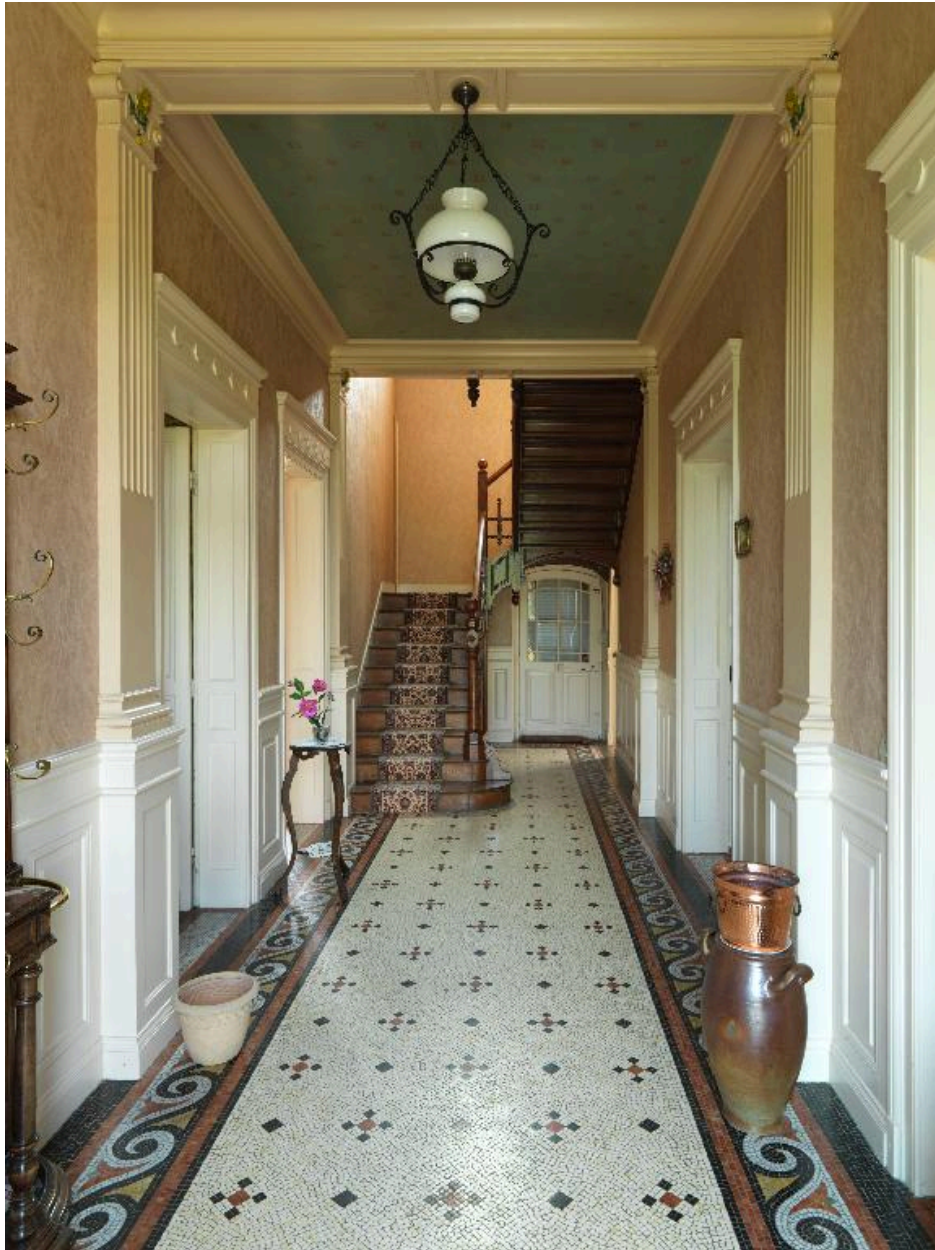
Le vestibule, vue intérieure.