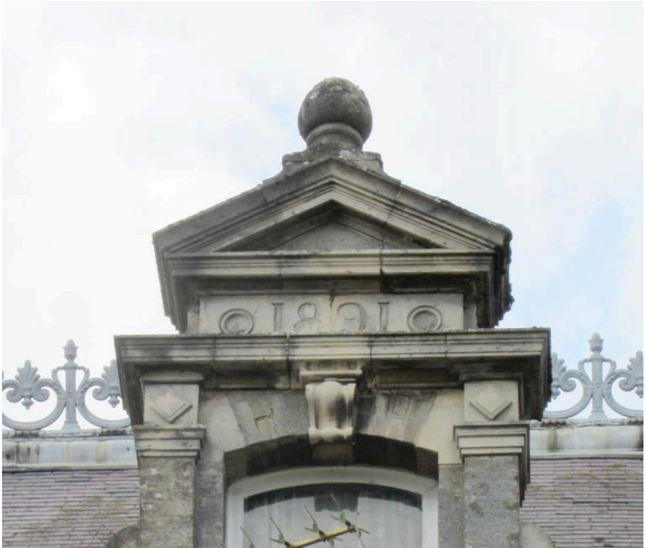
Détail du chronogramme au sommet de la lucarne.