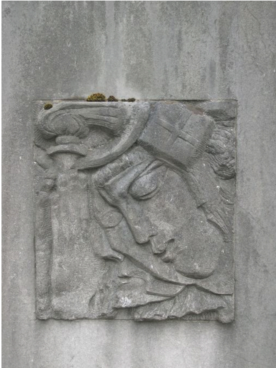
Vue de détail sur le décor figuré.