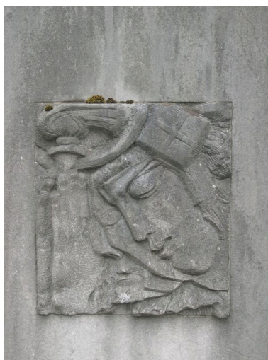
Vue de détail sur le décor figuré. IVR22_20058010342NUCA