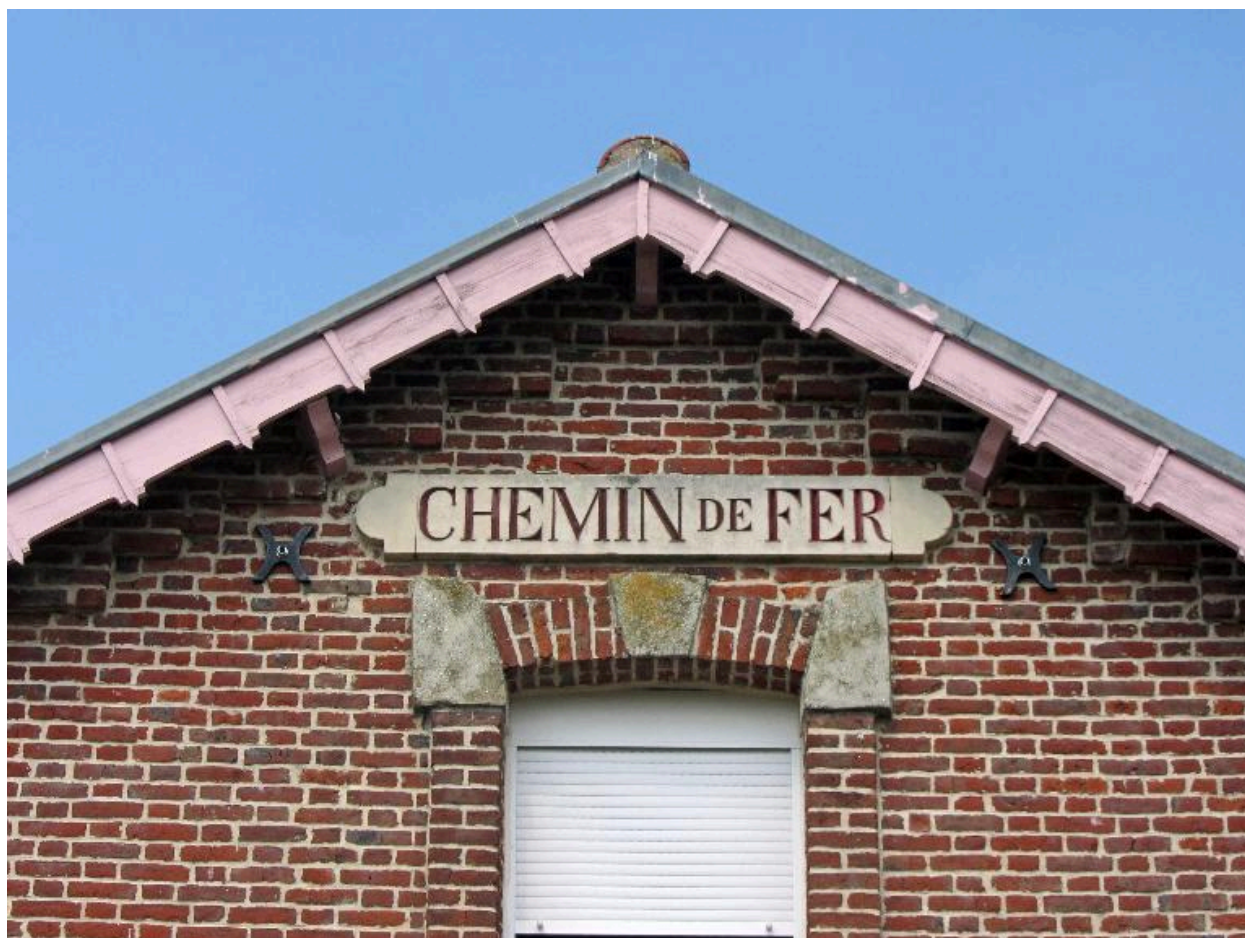
Détail de l'inscription "chemin de fer".