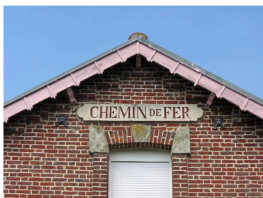
Détail de l'inscription "chemin de fer". IVR22_20138015810NUC2A