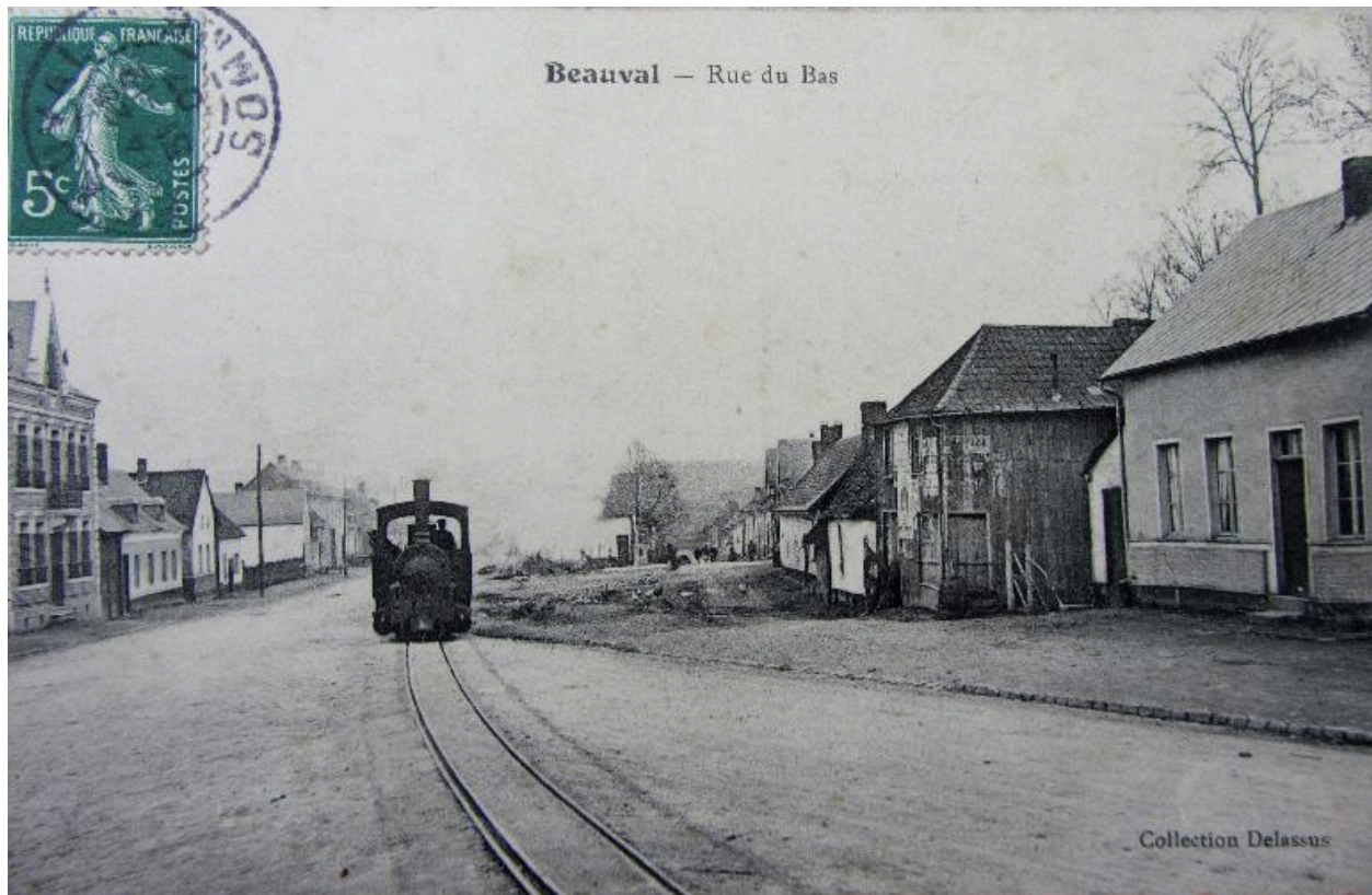
Locomotive sortant de la gare de Beauval pour rejoindre la carrière de phosphates, début 20e siècle.