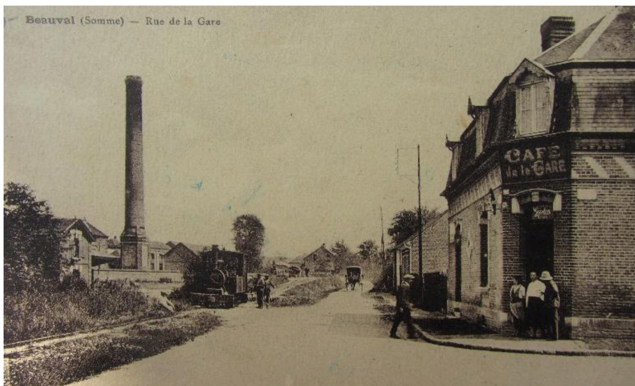
La rue de la gare a début du 20e siècle.