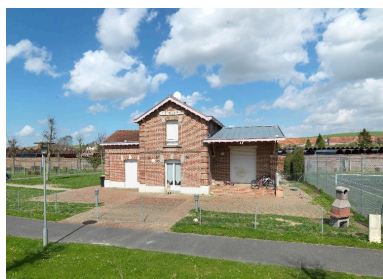
Vue d'ensemble. IVR22_20138000074NUC2A