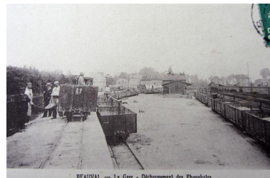
Déchargement des phosphates en gare de Beauval, début 20e siècle.