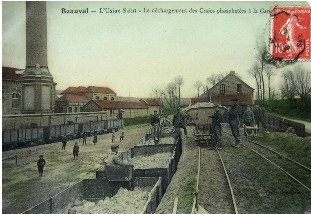
Scène de déchargement des craies phosphatées à la gare de Beauval, début 20e siècle.