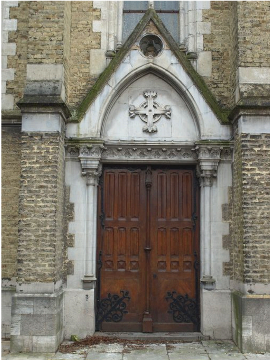
Chapelle : portail latéral