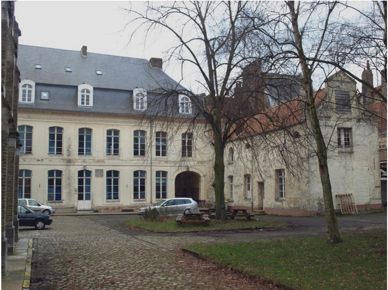
Façade arrière, et bâtiment annexe en retour d'angle