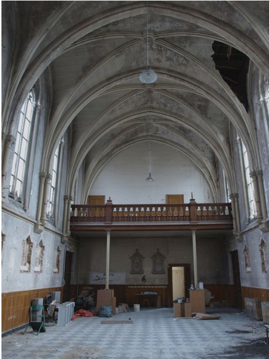
Chapelle, intérieur : nef, vue vers le mur ouest, plaques de consécration sous la tribune.