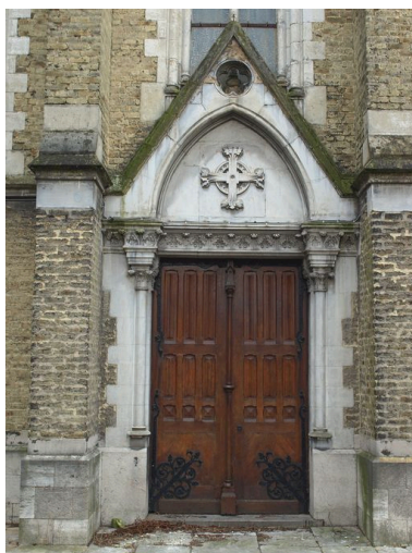
Chapelle : portail latéral IVR31_20106202973NUCA