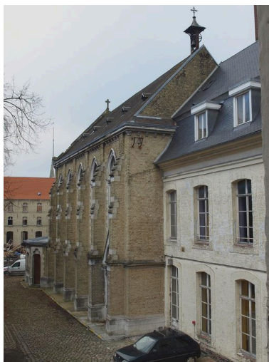
Bâtiment administratif et chapelle