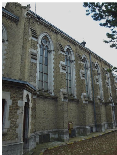
Chapelle : murs latéraux IVR31_20106202972NUCA