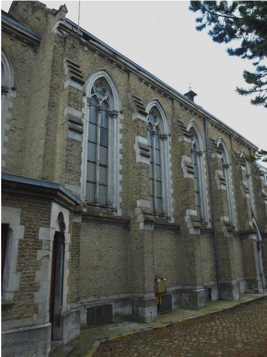
Chapelle : murs latéraux