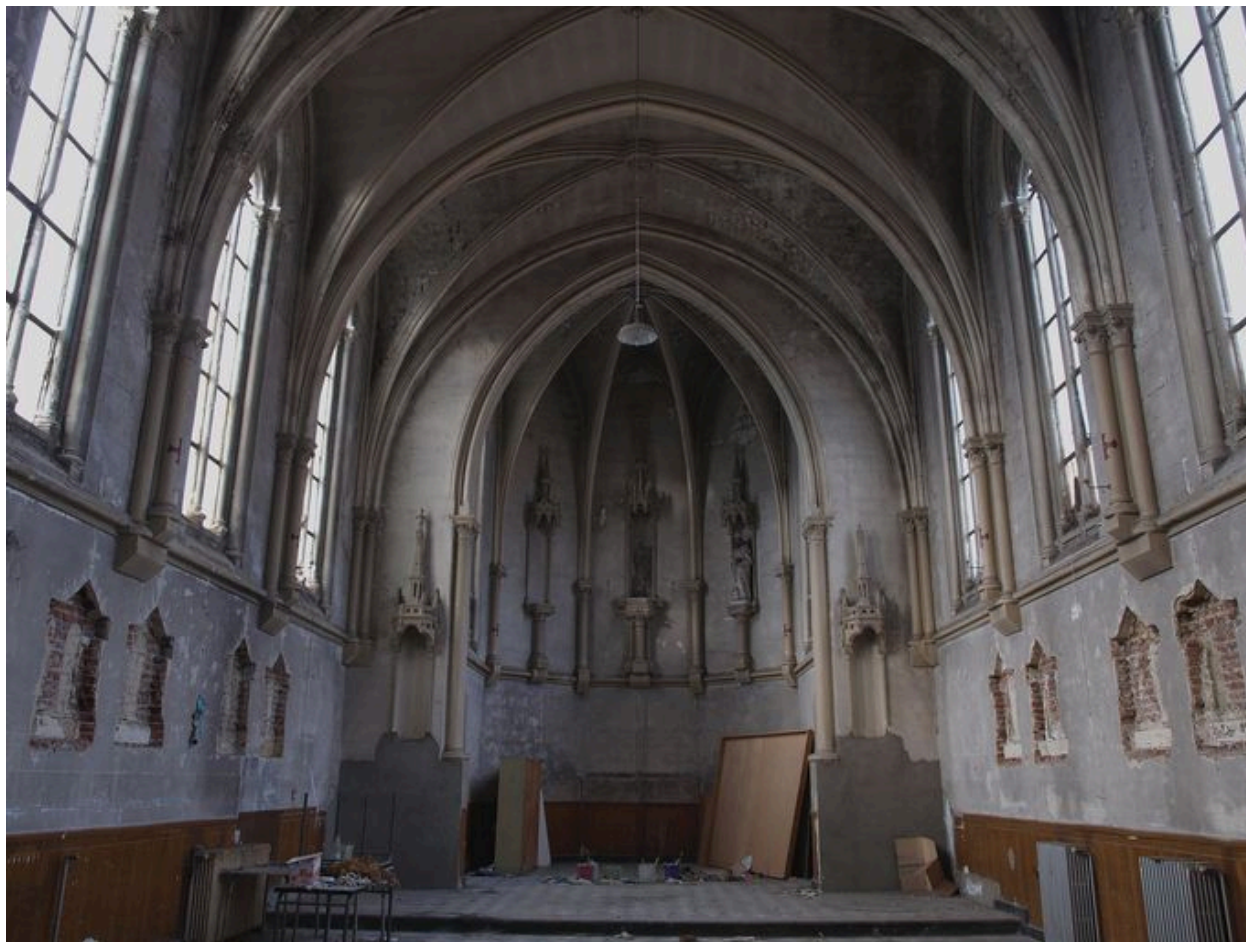
Chapelle, intérieur : vue d'ensemble du chœur (intérieur)