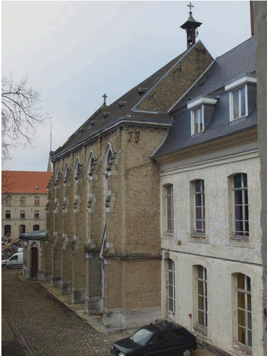
Bâtiment administratif et chapelle