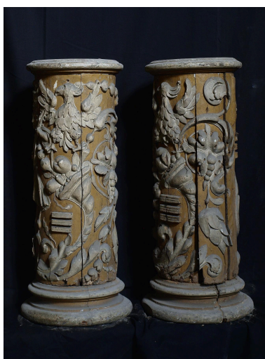
Vue générale. IVR31_20106207311NUCA