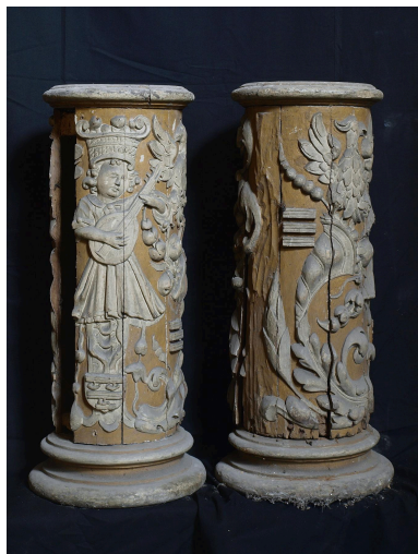
Vue générale. IVR31_20106207310NUCA