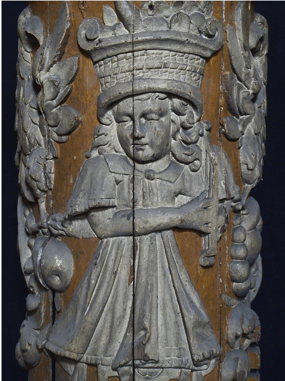
Vue de détail.