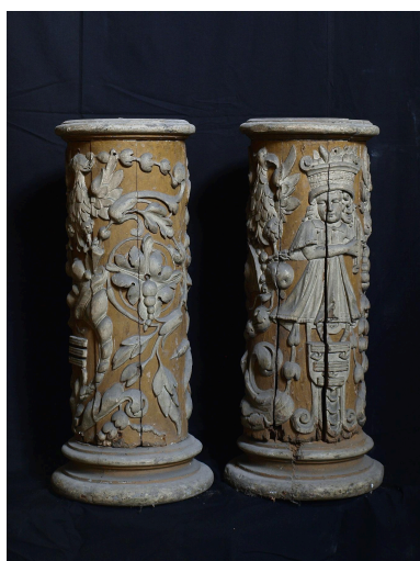
Vue générale. IVR31_20106207309NUCA