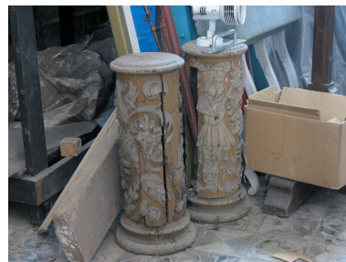
Vue d'ensemble. IVR31_20106207313NUCA