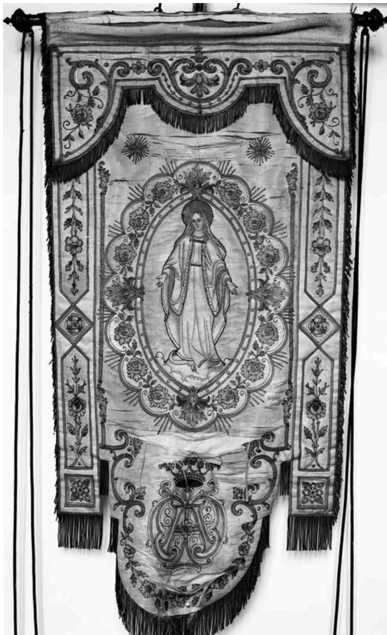
Bannière de procession : Immaculée Conception, 19e siècle.