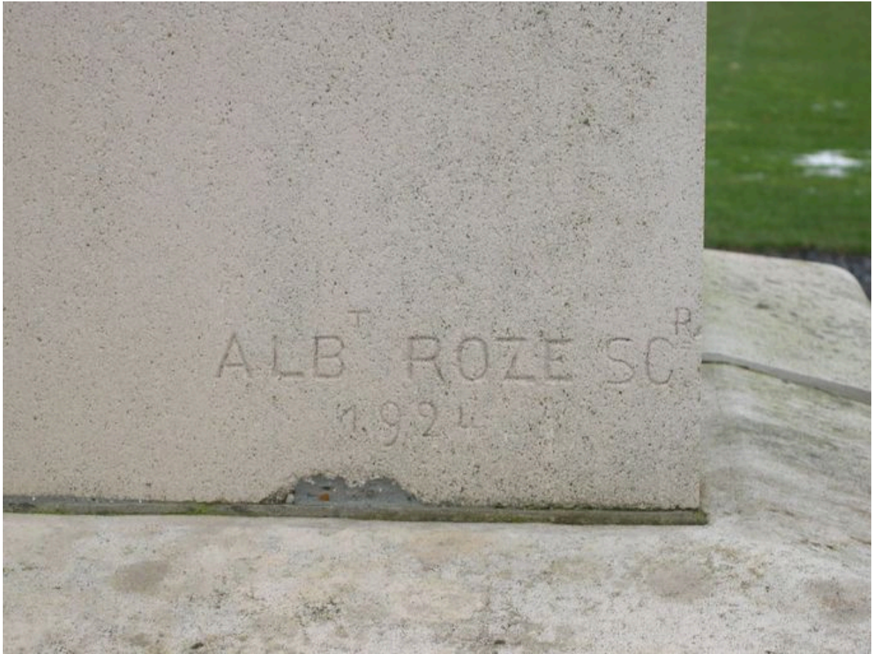
Vue de détail sur la signature et la date portées : Albert Roze, 1924.