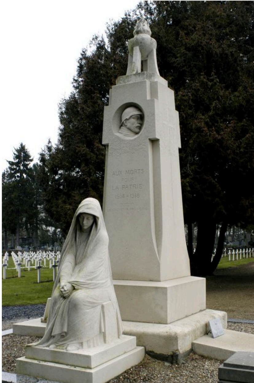
Détail de trois-quarts.