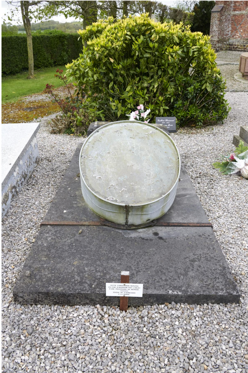
Boîte-vitrine funéraire, anonyme, 2e moitié du XIXe siècle (estimation).