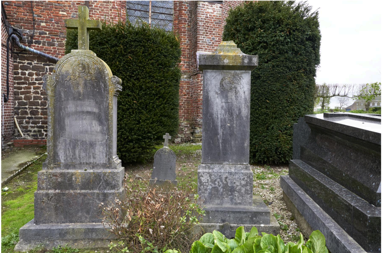
Tombeaux XIXe siècle. Pidou-Maes (1851 et 1865) et Hidden (1884).