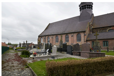
Vue générale du cimetière de Wemaers-Cappel.