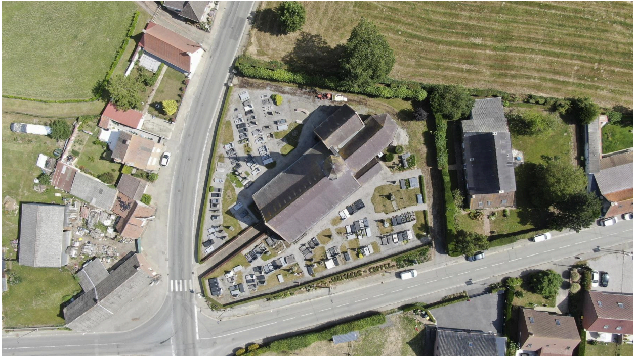
Vue zénithale du cimetière.