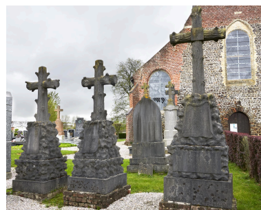
Ensemble de tombeaux en béton moulé daté du début du XXe siècle (1909-1916-1917). IVR32_20245901667NUCA