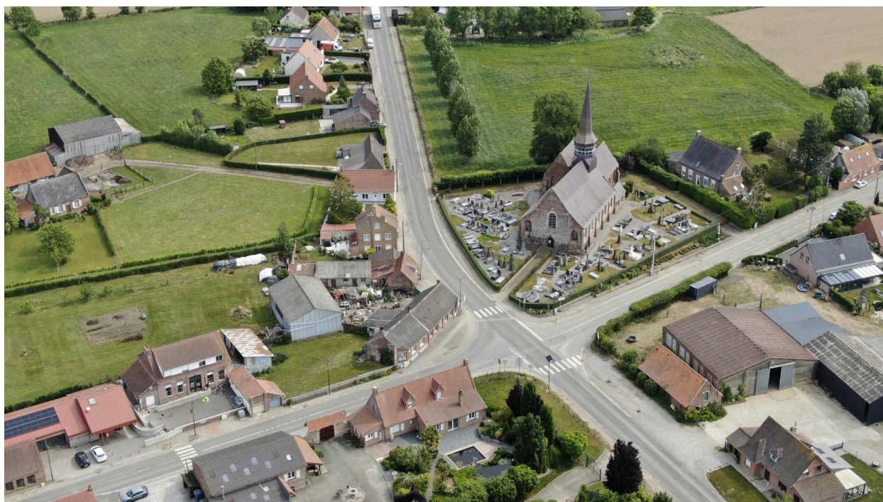
Vue aérienne oblique du cimetière.