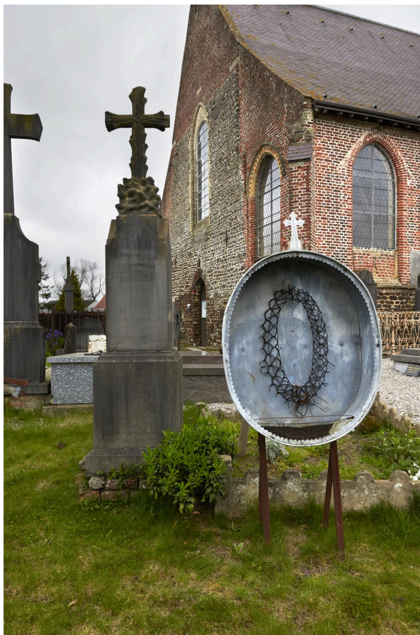
Boîte-vitrine funéraire, anonyme, 2e moitié du XIXe siècle (estimation).