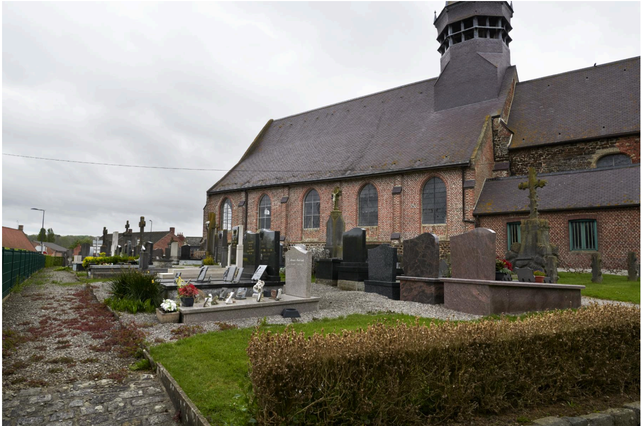
Vue générale du cimetière de Wemaers-Cappel.