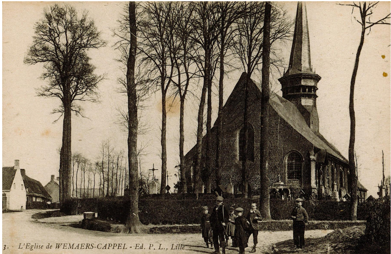
Carte postale. Église de Wemaers-Cappel. Début XXe siècle.