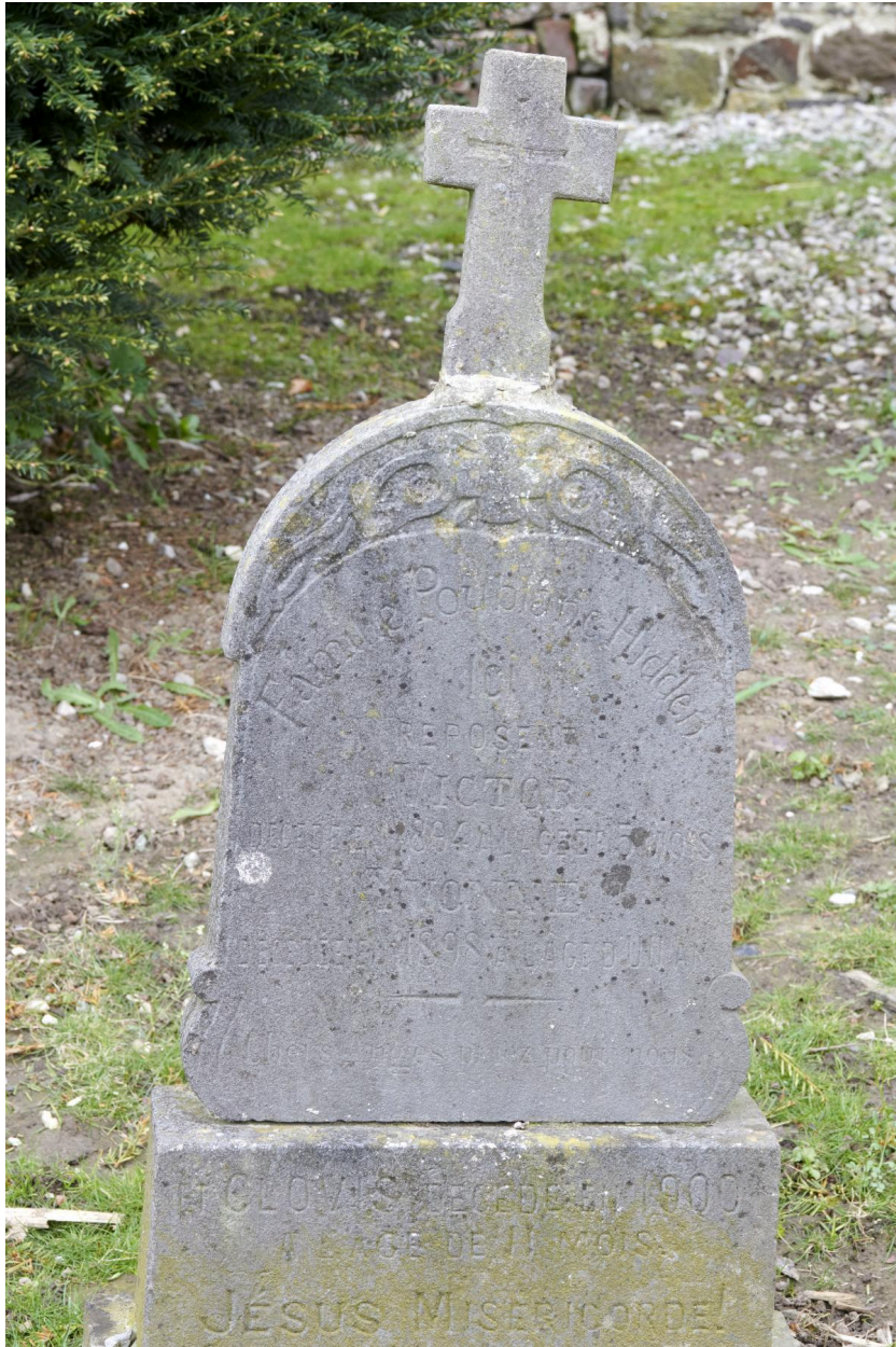
Tombeau de Victor Hidden (1898).