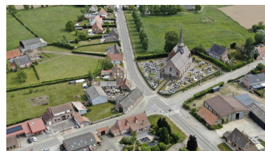
Vue aérienne oblique du cimetière. IVR32_20255901273NUCA