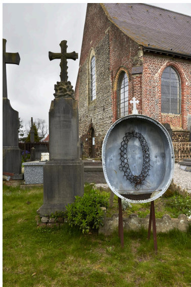
Boîte-vitrine funéraire, anonyme, 2e moitié du XIXe siècle (estimation). IVR32_20245901656NUCA