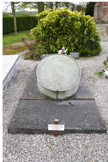
Boîte-vitrine funéraire, anonyme, 2e moitié du XIXe siècle (estimation). IVR32_20245901676NUCA