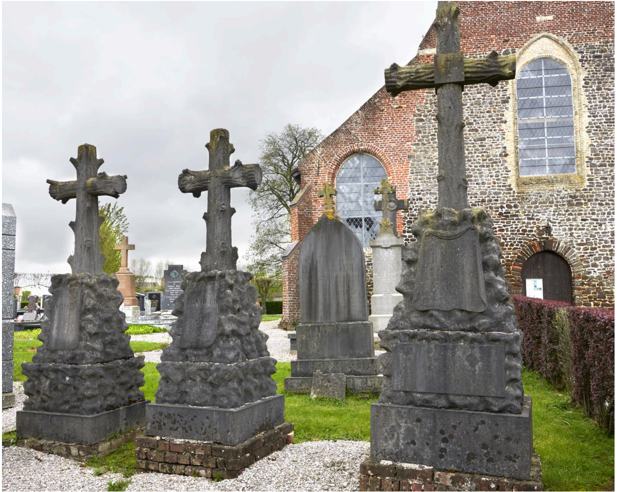
Ensemble de tombeaux en béton moulé daté du début du XXe siècle (1909-1916-1917).