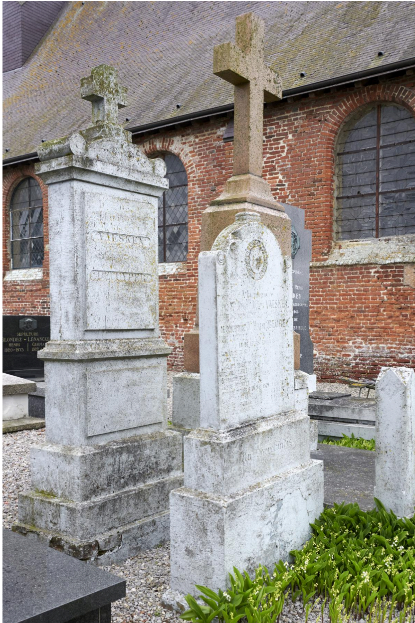
Tombeaux du XIXe siècle. Famille Vaesken.