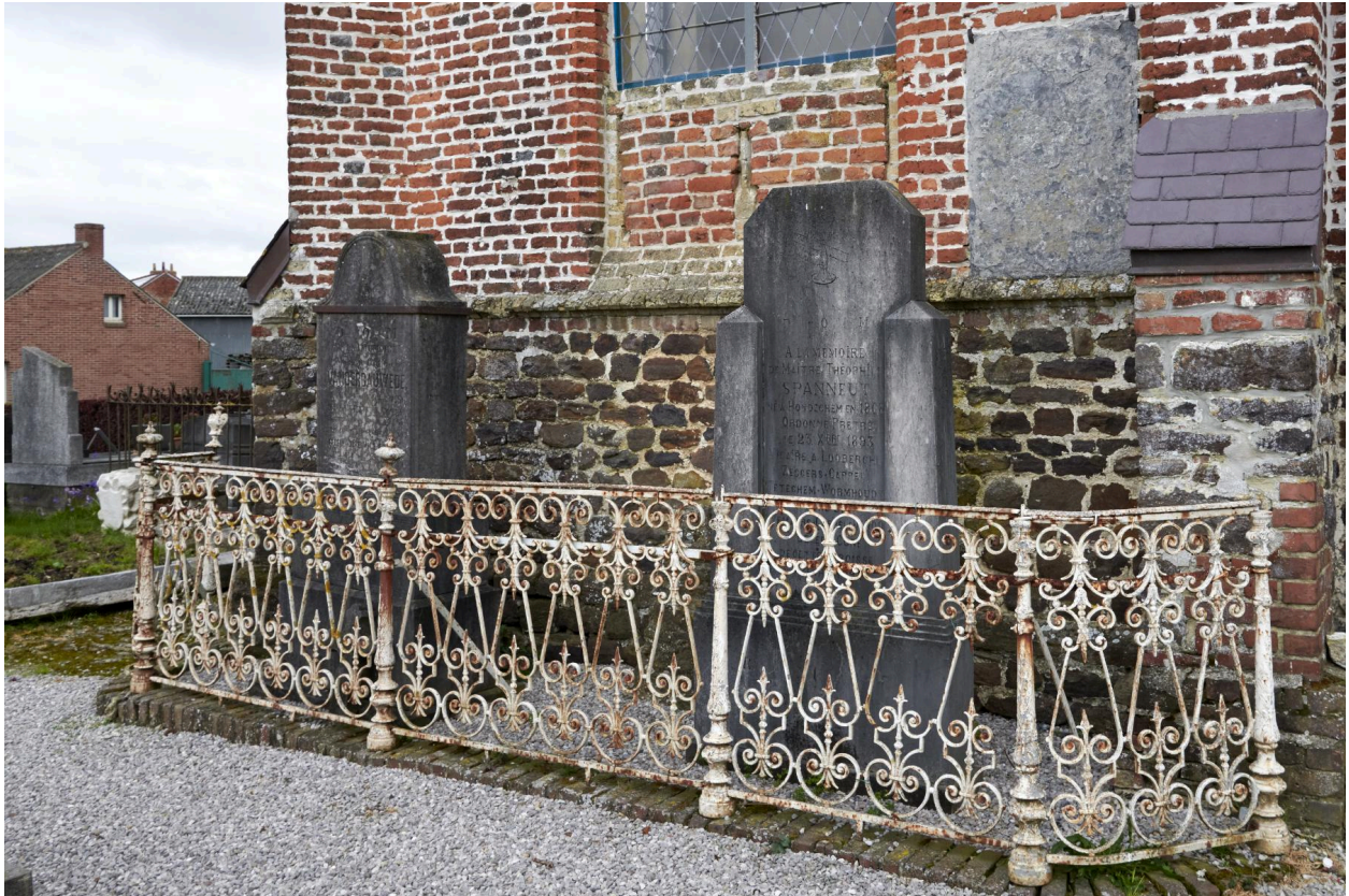
Tombeaux de Maître Théophile Spanneut, prêtre (1941) et Charles-Louis Vanderbauwede, curé (1872). Entourées d'une grille en fer forgé.