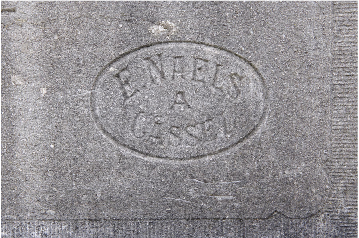
Cimetière de Wemaers-Cappel. Détail de la signature du marbrier E. Naels à Hazebrouck début XXe siècle.