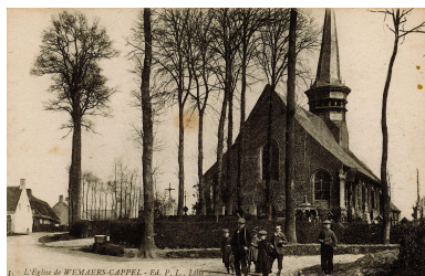
Carte postale. Église de Wemaers-Cappel. Début XXe siècle. IVR32_20245901906NUCA