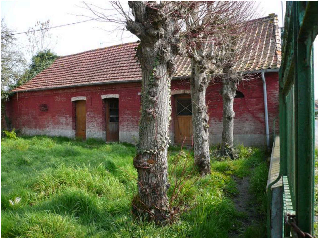
Vue des étables à l'est de la cour.