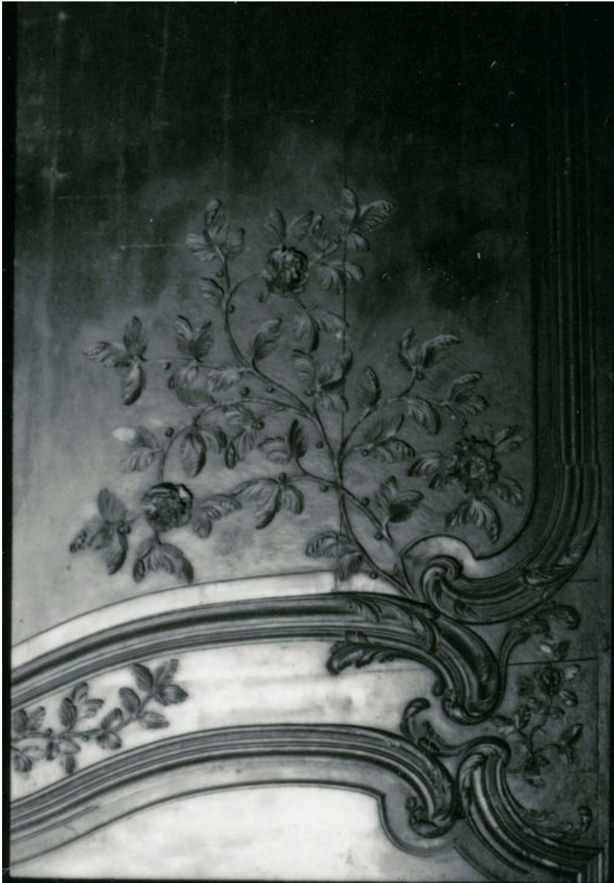
Vue de détail, relief