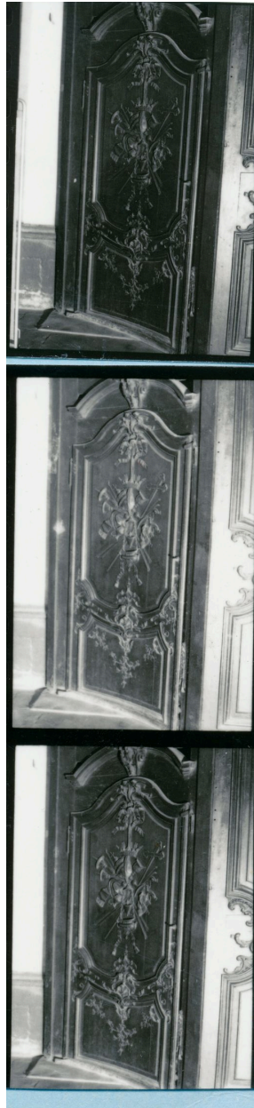
Vue latérale