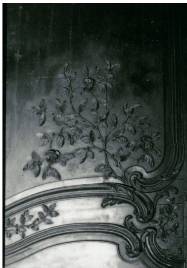
Vue de détail, relief IVR31_20106202007NUC