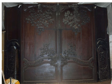
Vue générale IVR31_20106201999NUCA