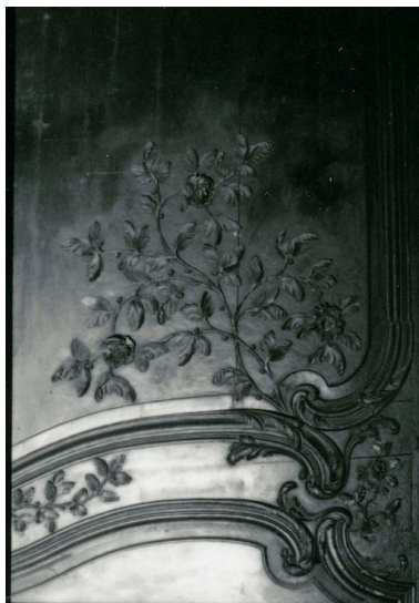
Vue de détail, relief IVR31_20106202007NUC