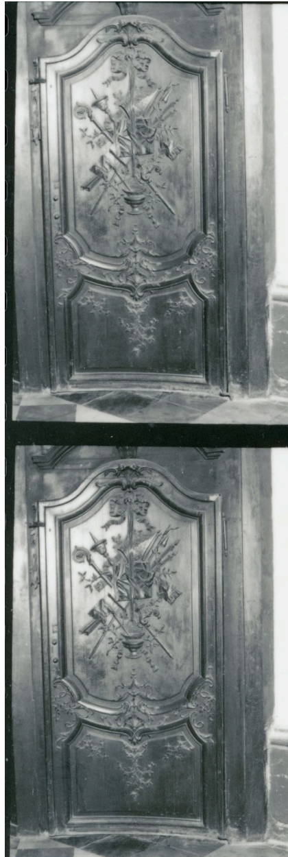
Vue latérale