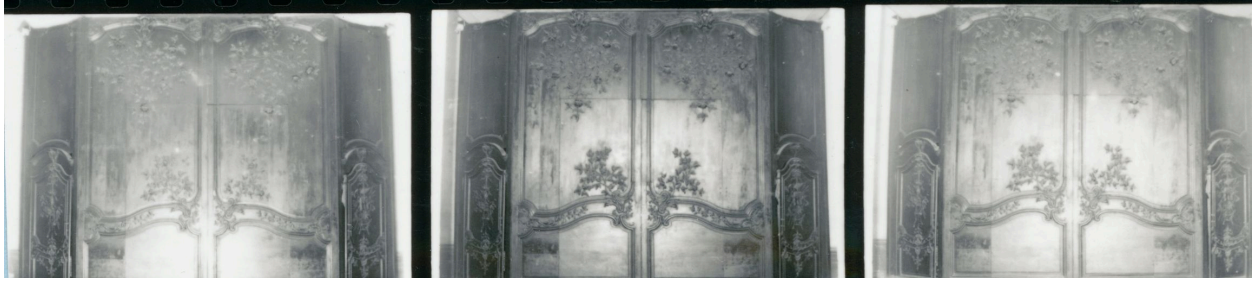
Vues générales