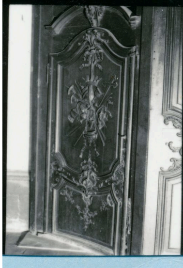
Vue latérale