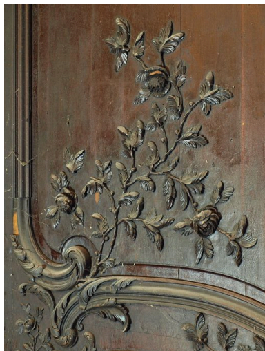
Vue de détail, relief IVR31_20106202002NUCA