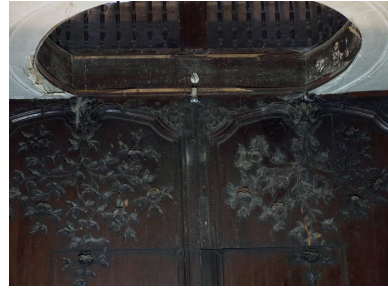
Vue de détail, partie supérieure IVR31_20106202001NUCA