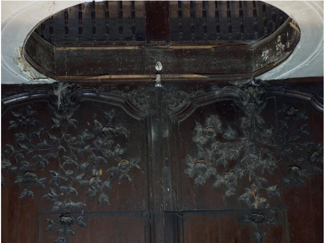
Vue de détail, partie supérieure