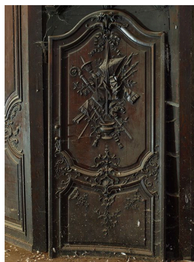
Vue latérale