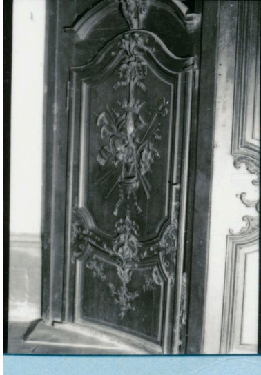
Vue latérale IVR31_20106202009NUC