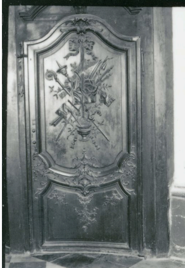
Vue latérale IVR31_20106202008NUC