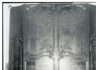
Vue générale IVR31_20106202005NUC