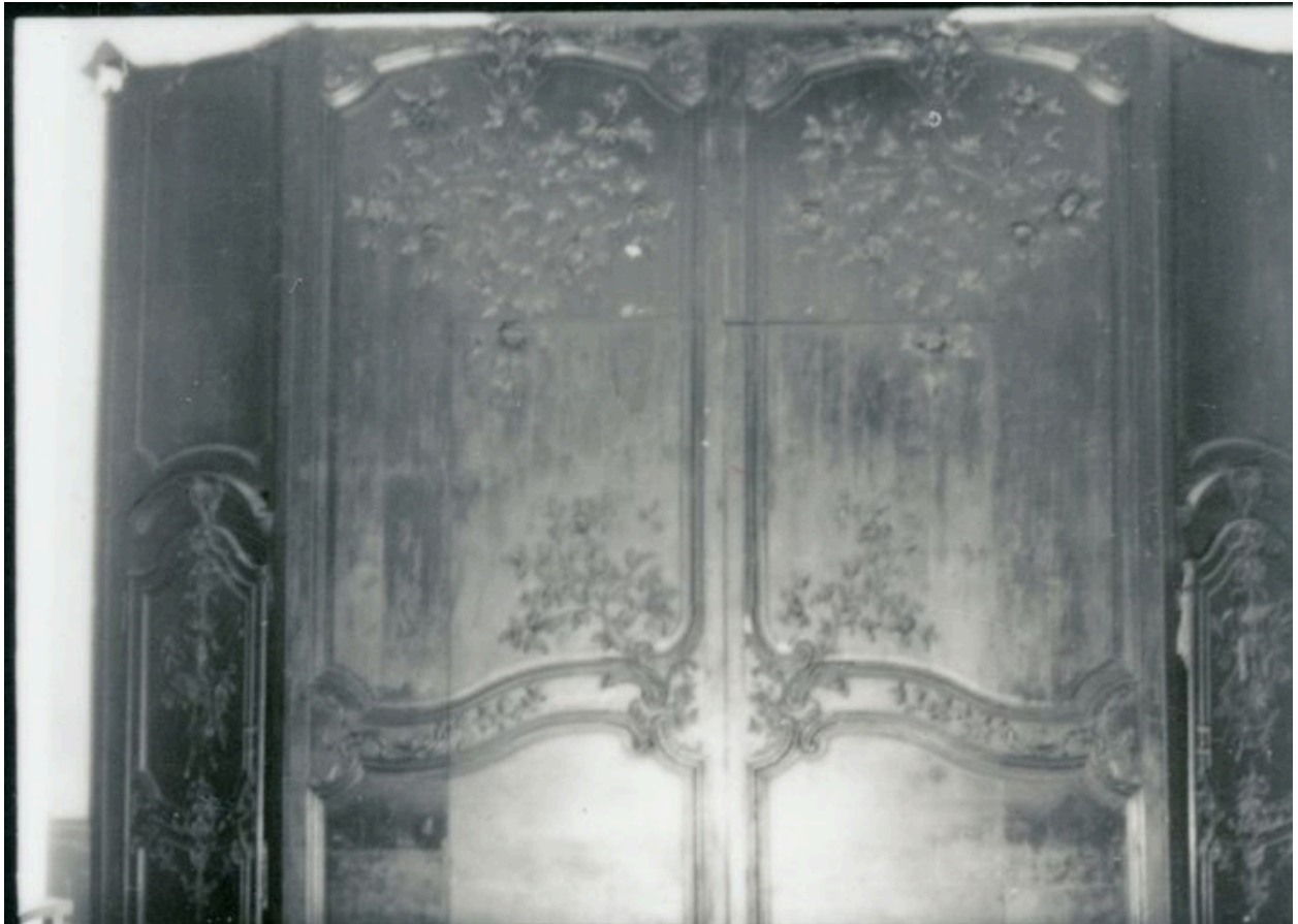
Vue générale (phot. Wintrebert, 1978, fonds AOA62)