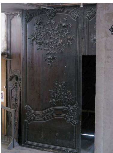
Vue partielle, porte de gauche