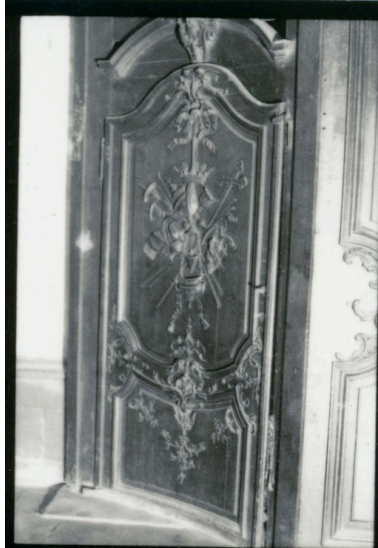
Vue latérale IVR31_20106202008NUC