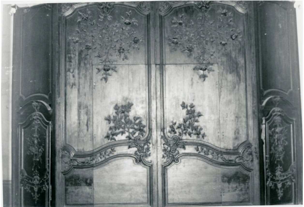
Vue générale (phot. Wintrebert, 1978, fonds AOA62)