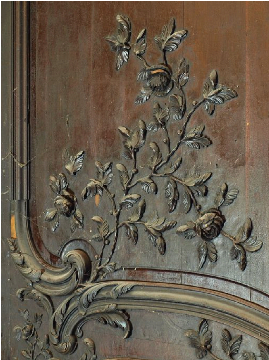
Vue de détail, relief