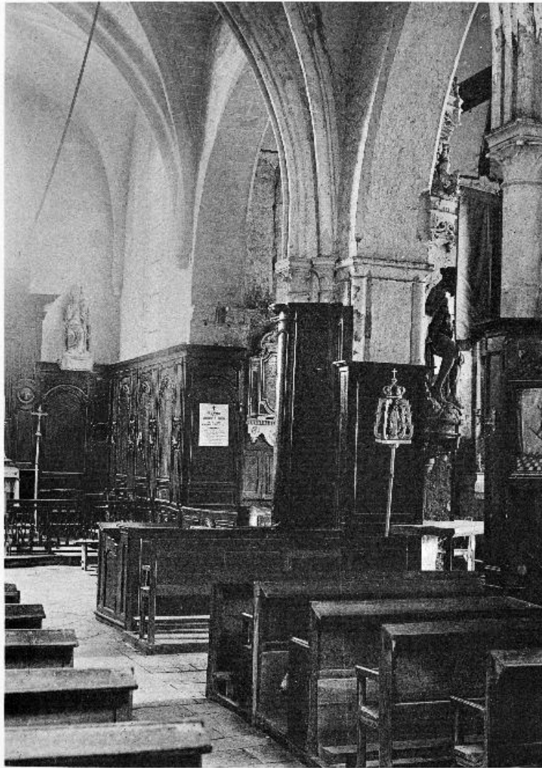
FIG. 287. — DAMPLEUX. La nef et le chœur.

Photographie partielle du chœur, réalisée par Étienne Moreau-Nélaton en août 1911, montrant une partie de la clôture de chœur (Les Églises de chez nous. Arrondissement de Soissons, t. 1, fig. 287).