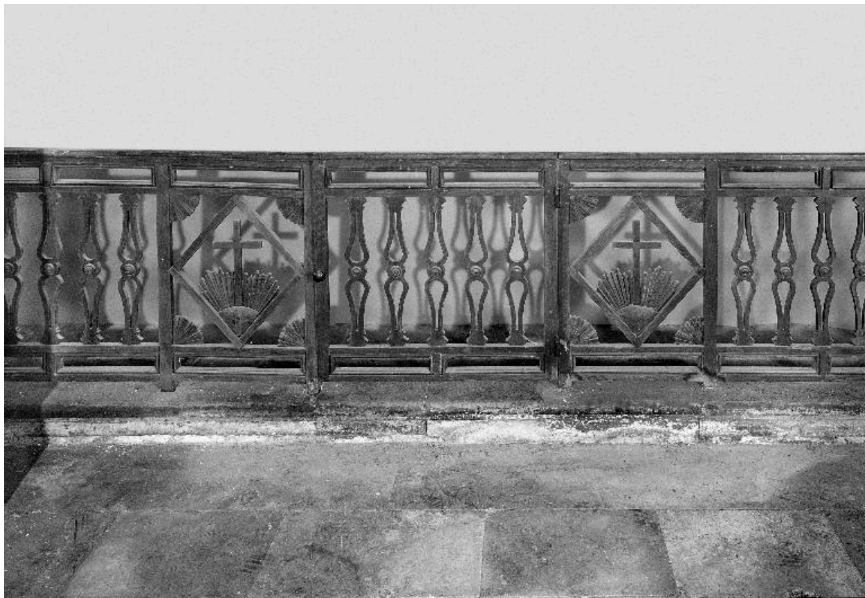
Vue partielle de la clôture des fonts baptismaux.