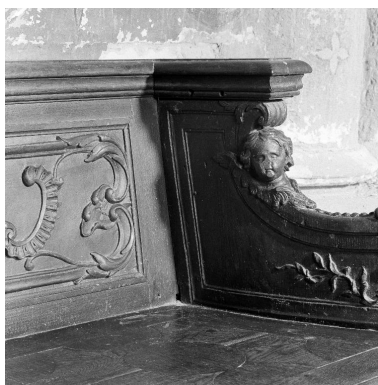
Détail du décor sculpté dans l'angle gauche : angelot et feuillage.