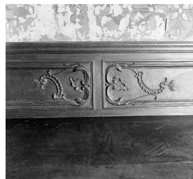
Détail du décor sculpté des panneaux du dossier et marqueterie de l'assise.