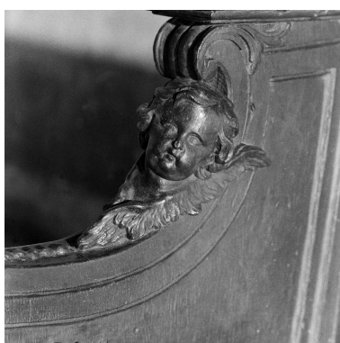
Vue rapprochée d'un des angelots.