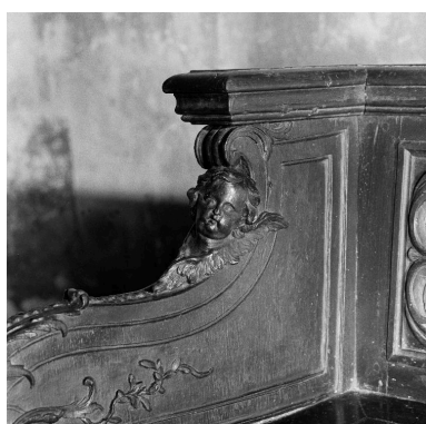
Détail d'un des angelots.